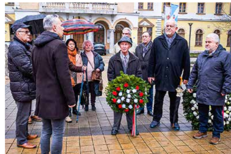
Az elesett katonákra emlékeztek

A II. világháború kispesztie harcainak befejezésére emlékeztek a Városház téren álló emlékműnél január 9-én tartott ünnepségen.