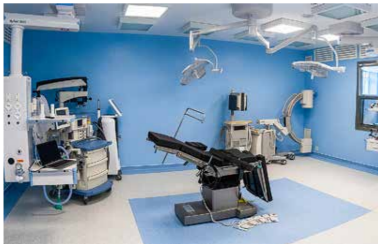
Februártól indulnak a műtétek

A technológiai és a technikai fejlődés eredménye, hogy lehetőség nyílik olyan műtétek elvégzésére, amelyek után a beteget nem kell kórházi körülmények között ellátni. Óriási előnye az egynapos sebészetnek, hogy kisebb a kórházi fertőzés kockázata, hiszen a beteg az otthonában gyógyul. Hogy ki kerülhet műtetre, azt szakorvosi javaslat és az azt követő alapos kivizsgálás (EKG, labor, mellkasröntgen) után minden esetben az aneszteziológus mondja majd meg, és tesz erre javaslatot. A továbbiak az úgynevezett eszmetedzser segítségével zajlanak – hangsúlyozta.