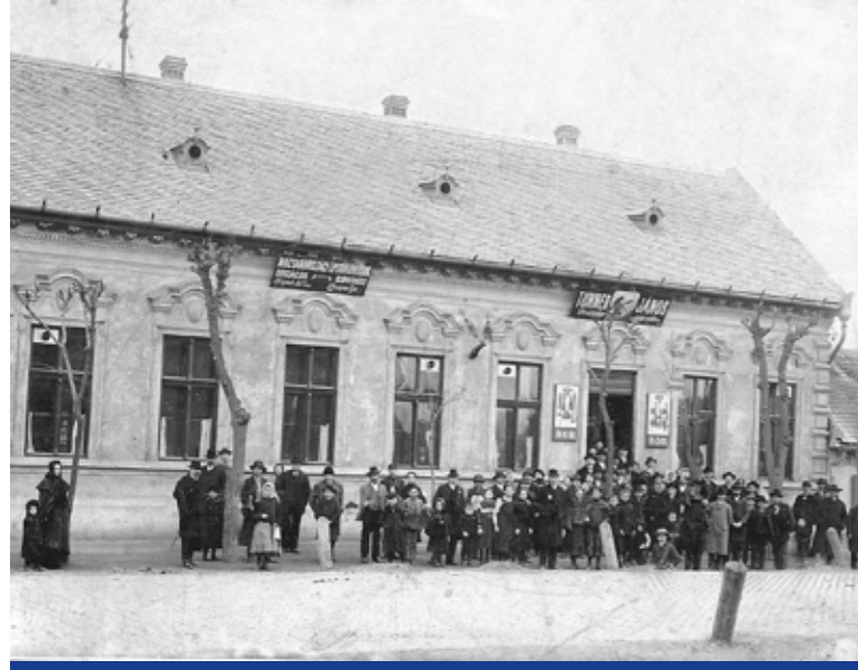
Tunner János vendéglője az Üllői út 125. szám alatt