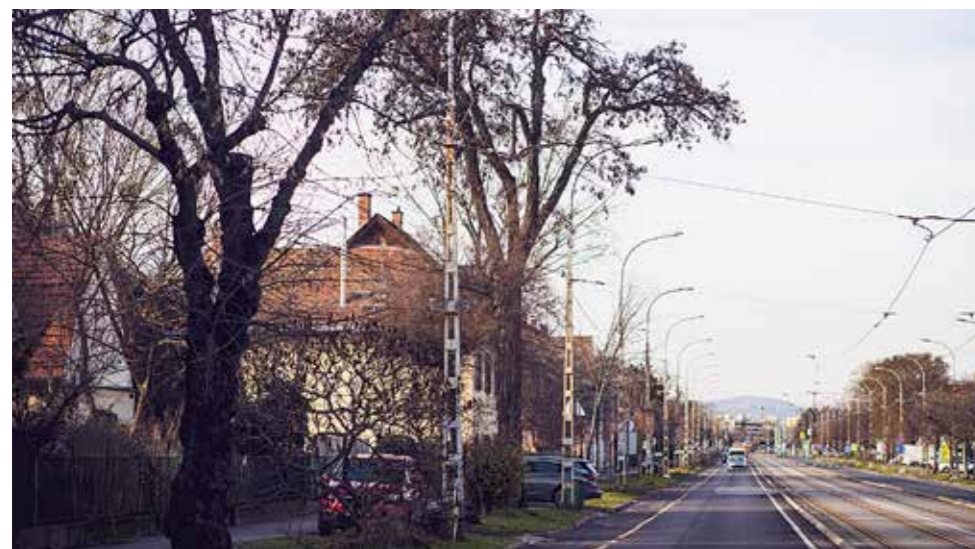
Decemberig tart a fasor-rekonstrukció

Várhatóan március közepétől már a teljes vonalon jár a metró, május közepétől pedig az utolsóként felújított Nagyvárad tér és Lehel tér állomásokat is használhatják az utasok.