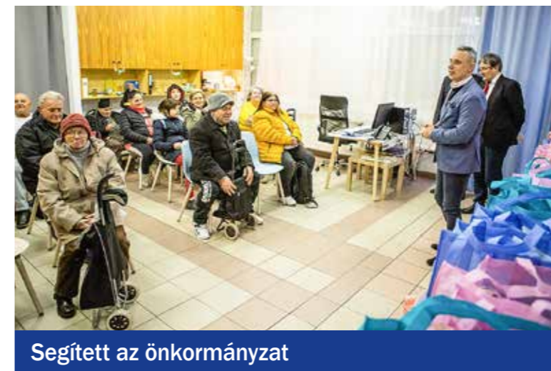
Segített az önkormányzat

Ötven rászoruló család, illetve egyedülálló kispesti kapott 20-20 ezer forint értékű élelmiszercsomagot az önkormányzattól múlt év végén. Az adományokat a Kispesti Szociális Szolgáltató Centrumban vehették át az érintettek Gajda Péter polgármestertől, Vinczek György alpolgármestertől, valamint Bogó Józsefné és Fekete László önkormányzati képviselőktől.