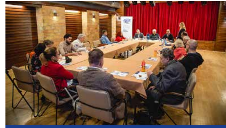
Rendszeresek lesznek a vállalkozói találkozók

Üzleti reggelit tartott január közepén a Budapesti Kereskedelmi és Iparkamara (BKIK) XIX. kerületi tagcsoportja a KMO-ban azzal a szándékkal, hogy a kerületi vállalkozókat összeismertesse, valamint tájékoztassa őket arról, milyen szolgáltatásokat nyújt a kamara a vállalkozások élénkítéséhez, gazdaságos és energiahatékony működtetéséhez.