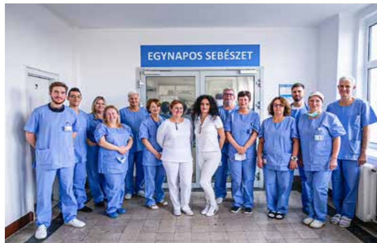
Együtt a szakmai csapat

Február elsején egy hasi műtéttel megkezdődnek a műtéti beavatkozások az egynapos sebészetben a Kispesti Egészségügyi Intézet (KEI) harmadik emeletén.