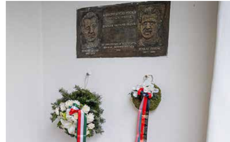
Jóbarátok voltak: Puskás és Bozsik

Az Aranycsapat kapitánya, a kiváló labdarúgó egykori, Szegfű utcai iskolájánál tartott megemlékezést az önkormányzat és az épületben működő Pannohalmi Béla Baptista Általános Iskola és Gimnázium. Az ünnepségen az iskola diákjai adtak műsort.