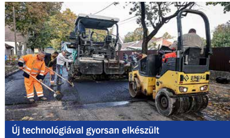
Új technológiával gyorsan elkészült

A Hunyadi utca és a Rákóczi utca között 60 méter hosszán, a Bercsényi utca és a Hungária út között további 230 méterem, összesen mintegy 2200 négyzetméteren újult meg teljesen az útburkolat október végén. A felújításnál fontos szempont volt a felszíni vízelvezetés megoldása. A FÖKERT-tel egyeztetve – a védett fasor érdekében –, ahol lehetséges volt, csapadékvízszikkasztó árkokat alakítottak ki. A Covid-időszak, majd az energiaválság következtében nem tudtunk akkora figyelmet fordítani az út- és járdahálózati javítására, mint kellett volna. Idén viszont újraindultak ezek a munkák, folytatódnak