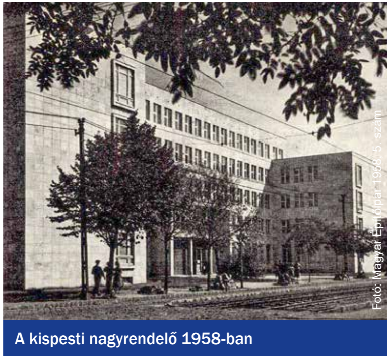
A kispesti nagyrendelő 1958-ban

Hidasi Lajos (1902–1970) építész pályája elején több más építésszel együtt, ösztöndíjjal Rómába utazott a Római Magyar Akadémia segítségével. A két háború közötti középületeink közül sok árulkodik a modern kori olasz építészet hatásairól, több közülük Hidasi munkája. Ilyen például a Dob utcai Postaigazgatóság, az óbudai Árpád Gimnázium vagy a pannonhalmi gimnázium és internátus. A kispesti rendelőintézet után a Budavári Palota helyreállítása következett 1959-től kezdődően hosszú éveken át. Neki köszönhetjük a mai palota múzeumainak belső tereit, küllemét.