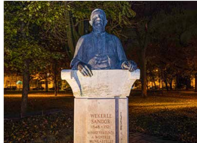
Egy igazi európeer volt

Wekerletelep névadója 175 éve, 1848. november 14-én született. Az önkormányzat 2008-ban állított szobrot a háromszoros miniszterelnöknek. Akkor ez volt az első Wekerle-szobor az országban.