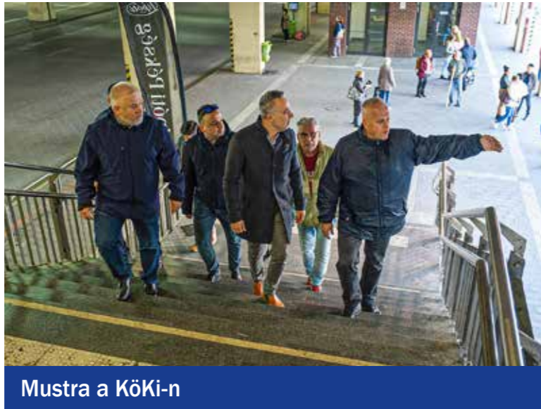
Mustra a KöKi-n

A közbiztonsági szempontból kiemelt területeket, az Atatürk parkot, a Kossuth teret és a KöKi-t érintette a november elején tartott szemle.