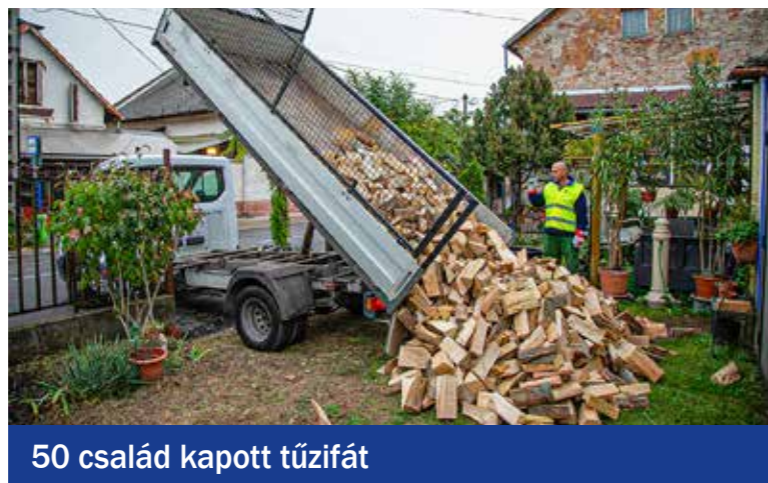
50 család kapott tüzfát

Rendkívüli települési támogatás keretében – természetbeni ellátásként – idén is ingyenes tüzifával segíti az önkormányzat a szociálisan rászorulókat. A Humánügyi és Szociális Iroda Szociális Csoportjának felmérése alapján 50 családot tudunk segíteni összesen 150 köbméter fával. Ez a természetbeni támogatás már régi hagyomány, többségében azok