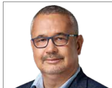
ARATÓ GERGELY országgyűlési képviselő (DK)

Egyéni bejelentkezés alapján a gergely.arato.kepviselo@gmail.com e-mail-címen vagy a 06-30-407-6369-es telefonszámon