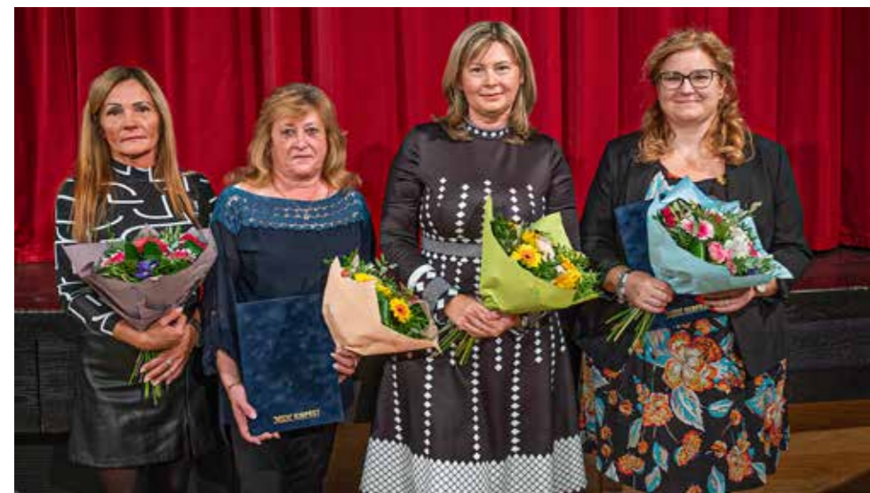
Kiemelkedő munkát végeztek

Az érzékenyítő foglalkozáson megbeszéltek, hogy a segítségnyújtónak nem újraéleszteni kell, mert az az orvos, szakember feladata, hanem észnél lennie, „átvenni a szív szerepét”, és aktívan kihasználni azt a négy percet, míg a szakszerű segítség megérkezik. De gyakorolták azt is, hogy milyen információkat kell megadni a mentőközpontra.