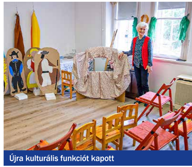
Újra kulturális funkciót kapott

Telephelybővülés miatt a képviselő-testület szeptemberi ülésén módosította a KMO Művelődési Központ és Könyvtár alapító okiratát. Ennek oka, hogy 2023. augusztus 10-én a fővárosi önkormányzat átadta Kispestnek a Kós Károly tér 15. szám alatti (korábban a Wekerlei Könyvtárnak is helyet adó) 35 négyzetméter alapterületű helyiségét, amelyet a továbbiakban a KMO a Wekerlei Könyvtár Klubkönyvtáraként használhat. Fontos volt számunkra, hogy ennek a helyiségnek az eredeti funkcióját vissza tudjuk adni, hiszen egy rövid ideig egy egyesület bérelte. A tervek szerint itt lesznek a könyvtár kulturális és ismeretterjesztő programjai – tudtuk meg Gajda Péter polgármestertől.