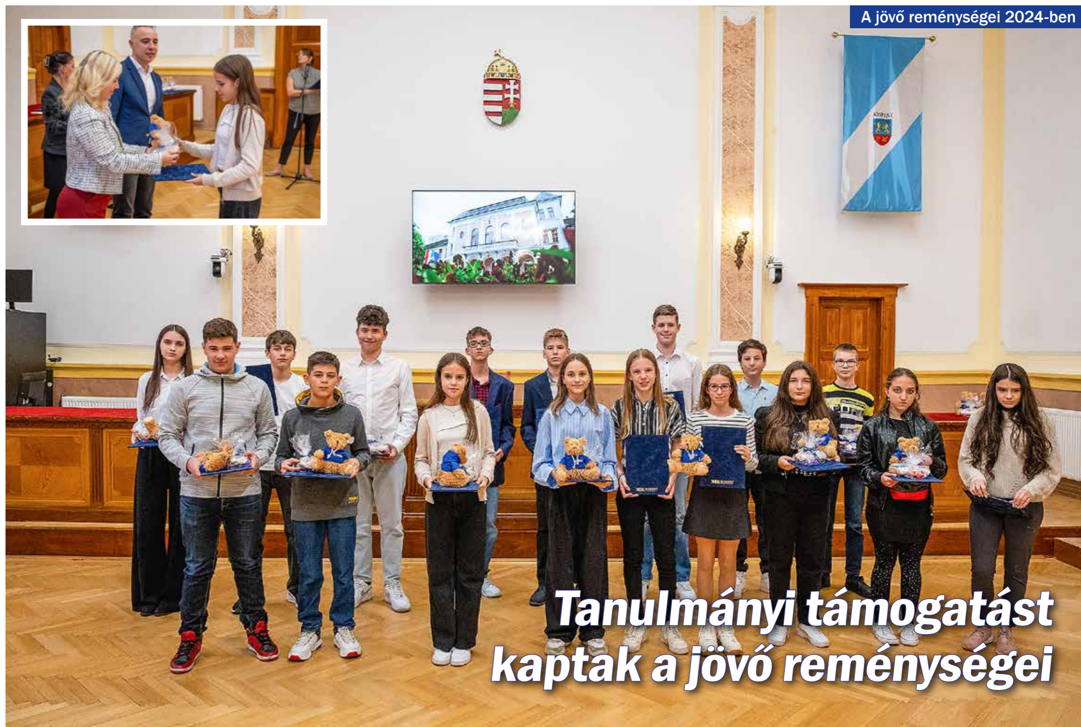
A jövő reménységei 2024-ben

Tanulmányi támogatást kaptak a jövő reménységei