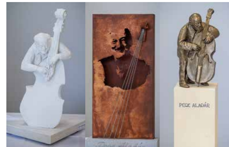
Közülük választ a testület

A képviselő-testület dönt arról, hogy a Pege Aladár emlékére kiírt szoborpályázatra beküldött tervek közül melyik valósulhat meg és ke-