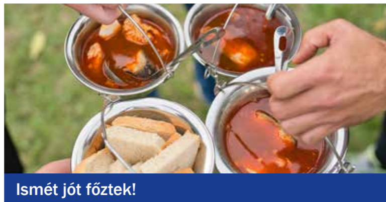
Ismét jót főztek!

Különdíjat kapott a Gasztro Devils By Gránit Ördögei (Gránit Kft.) réteges vaddisznópörköltje, a Dekiváló falatok (DK) káposztaágyon készített hús-gombócái, a Trió (Kispesti Román Nemzetiségi