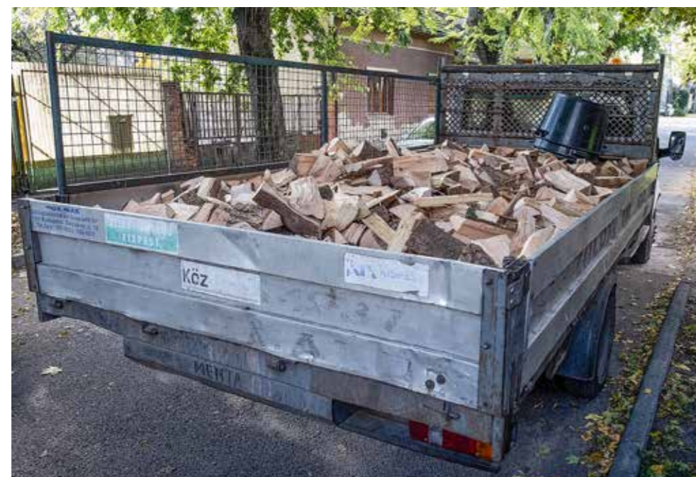
Háztartásonként 3,5 m 3 tűzifa jár a rászorulóknak

Mindenkit arra tudok ösztönözni, hogyha bármilyen anyagi jellegű, szociális vagy egészségügyi problémája van, nyugodtan forduljon az önkormányzathoz, közvetlenül hozzám vagy alpolgármester társaimhoz, de a szociális irodánál is tudnak konkrét segítséget kérni. És természetesen, akinek lehetősége van rá, az az önkormányzat egészségügyi (https://egeszsegugy.kispest.hu/fooldal) és szociális (https://szocialisugyek.kispest.hu) honlapjain, valamint a kispest.hu oldalon is pontos információkat kaphat arról, hogy milyen támogatásokat tud igénybe venni az önkormányzattól – hangsúlyozta a polgármester.