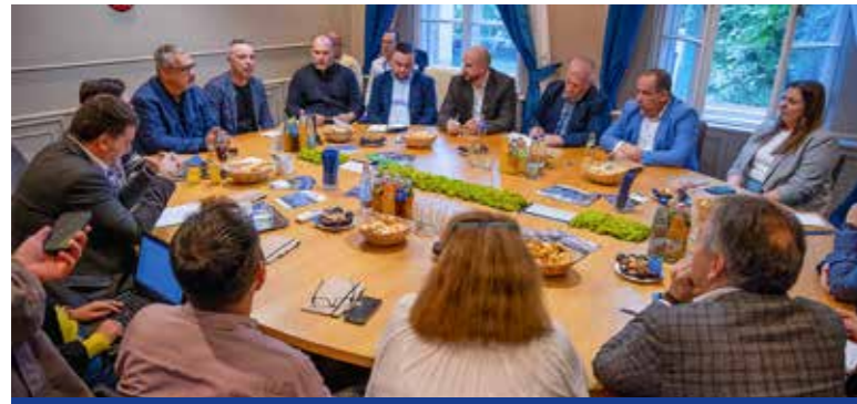
Együtt keresik a megoldást

A Kőbánya-Kispest csomópont helyzete volt a témája a Városházán október elején tartott munkamegbeszélésnek.