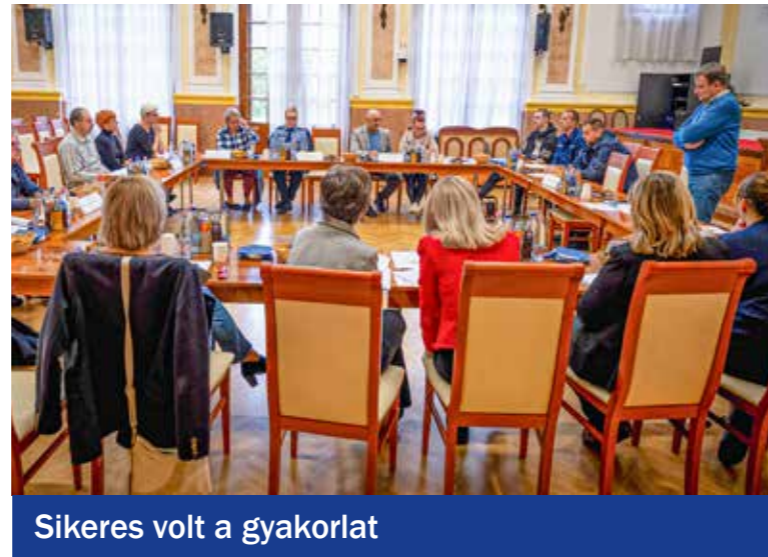
Sikeres volt a gyakorlat