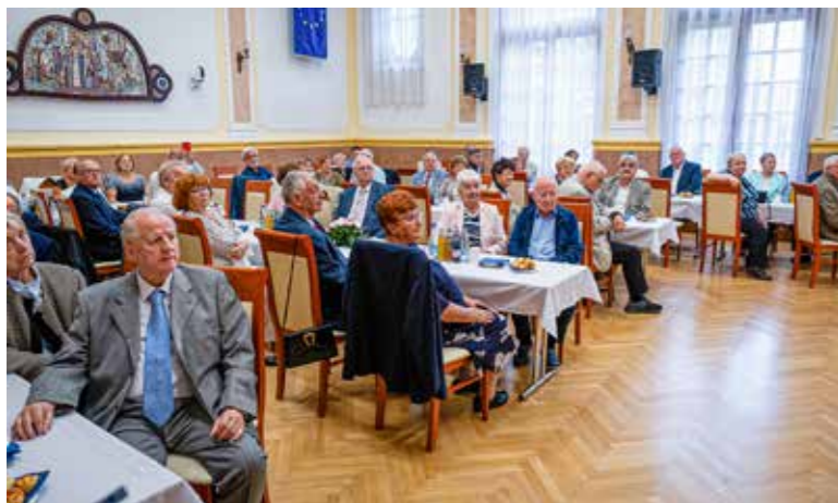
Két évtizedes hagyomány

Az 50 éve vagy annál régebben házasságot kötött párokat köszöntötték szeptember végén a Városházán.