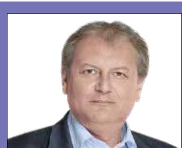
DR. HILLER ISTVÁN országgyűlési képviselő (MSZP)

2024. november 14., csütörtök 17.00 (XIX., Kossuth Lajos u. 50., MSZP-iroda)