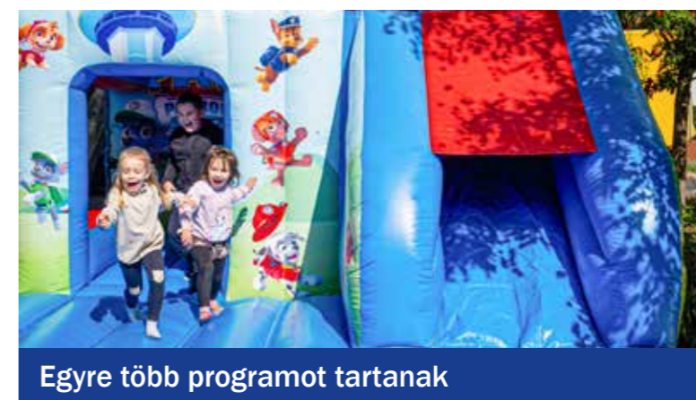
Egyre több programot tartanak

Ezúttal nem futással, hanem bográcsoszó-grillező-, valamint torta-, illetve süteménykészítő versenyekkel mozgatták meg a kertvárosiakat a szervezők. Négy csapat bográcsában rottyogott az étel, és még számtalan finomság várta a születésnapozókat. Rendeztek rajzversenyt egyesületi programok-élmények témában, a kicsik a felújított játszótér mellett kedvükre ugrálóvárazhattak, a nagyobbak 4D VR-szimulátorral próbálkozhattak, de volt darts, asztalifoci, pingpong és célba dobás is.