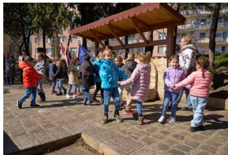
Fontos az ivóvíz védelme

Évek óta visszatérő programja az önkormányzatnak, hogy a víz világnapját (március 22.) közösen ünnepli a kerületi bolgár nemzetiségi önkormányzattal.