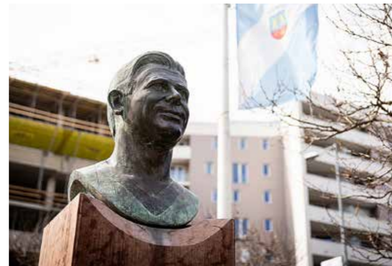
Kispest ápolja az emlékét

Az Aranycsapat kapitányára, Kispest Díszpolgárára, Puskás Ferencre emlékeztek 98. születésnapján (április 1.) a KÖKI Bevásárlóközpont előtt álló szobránál.