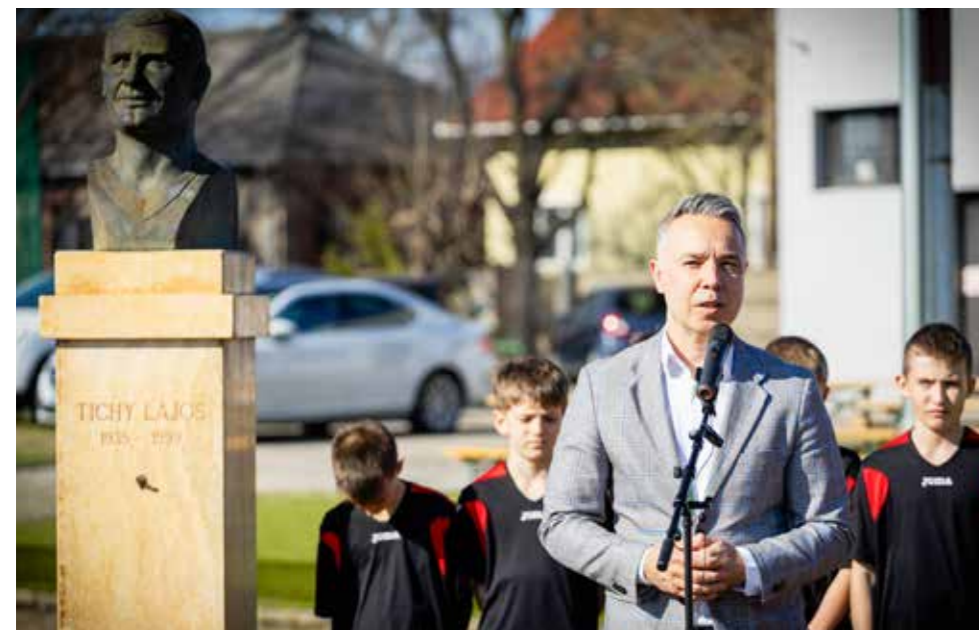
Tisztelgés a múlt nagy alakja előtt

A délután hátralevő részében gálameccsek következtek: előbb a Budapest Honvéd SE U13 fiú – Kispest SE U13 fiú csapatai, majd a Kispest Honvéd U19 lány – Astra HFC U19 lány csapatai, zárásként a Budapest Honvéd Öregfiúk – Kispest Önkormányzat csapatai játszottak.