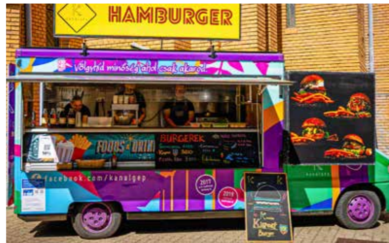
Kispest burgert kínált a Kanálgép

A nemzeti gyásznapi miatt egynaposra zsugorodott IV. Kispesti Street Food Fesztiválon kilenc „guruló étterem”, truck várta az ingyenciket a Templom téren.