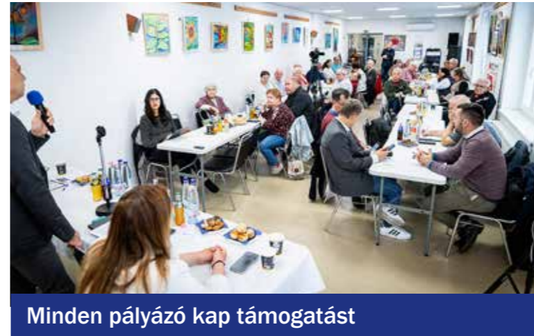
Minden pályázó kap támogatást

A májusi Civil Fórumon mutatták be a kedvezményes vásárlást biztosító kártyát.