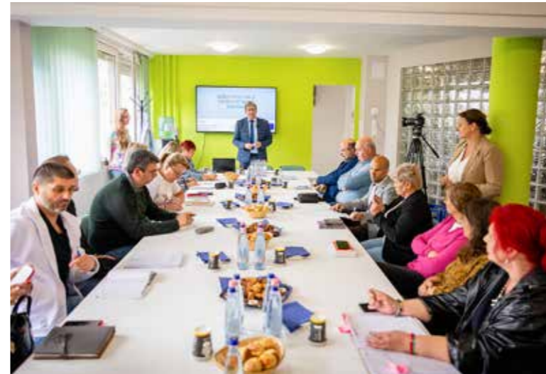
Cél a közétkeztetés javítása

Fontos döntések születtek az Étkezési Bizottság május elején tartott étlapmegbeszélésén a Városházán.