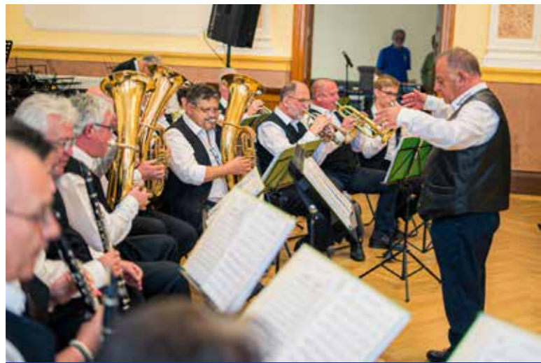
Játszik a Grossturwaller Musikanten

Kilencedik alkalommal rendezték meg a Dél-Pesti Fúvószenekari Találkozót, a kedvezőtlen időjárás miatt ezúttal nem a Városháza előtti téren, hanem a díszteremben, május 17-én.