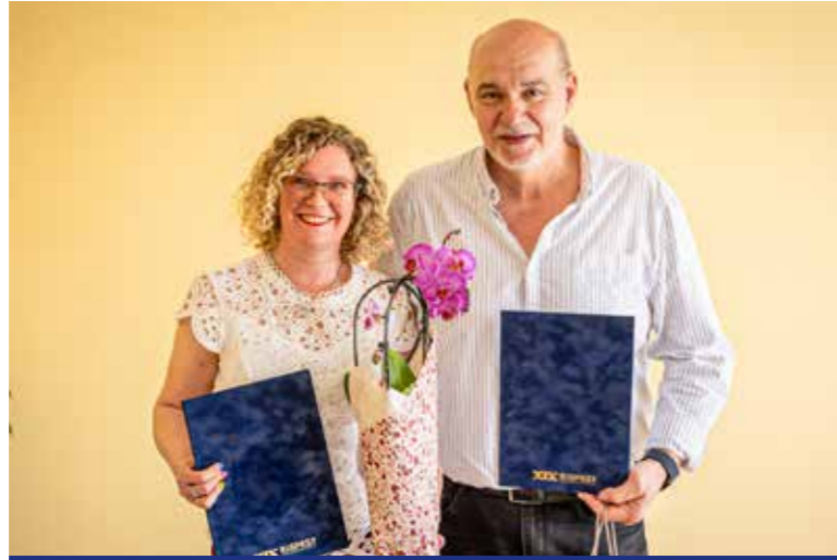
Kimagasló munkát végeztek

Az ünnepélyes díjátadón kívül idén szakmai programot is szerveztek a bölcsődék napján (április 21.) a kerületi kisgyermeknevelőknek, dajkáknak, bölcsődei dolgozóknak. A Kispesti Egyesített Bölcsődék – Csillagfény Bölcsődében megtartott ünnepségen a Kispesten élő művészházaspár, Márton Fruzsina és Szabó Gyula Győző verses-zenés műsora köszöntötte a díjazottak és a dolgozókat.