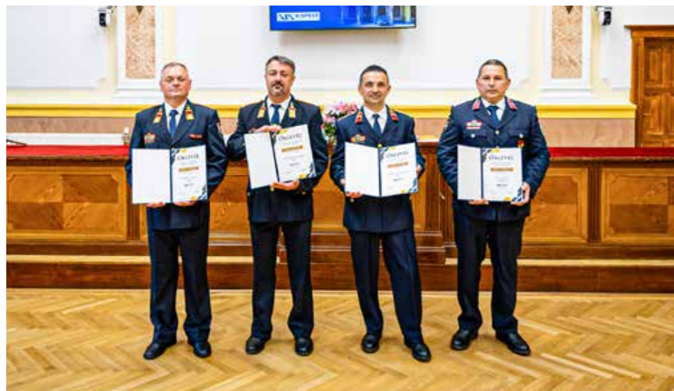
Biztonságot nyújtó lánglovagok

A begónia mutatós növény, virágágyásokba, balkonládába és cserépbe is ültethető. Sok természetes fényre van szüksége, de a tűző, nyári napsütést nem kedveli. Virágzási időszakában érdemes kéthetente tápoldatozni.