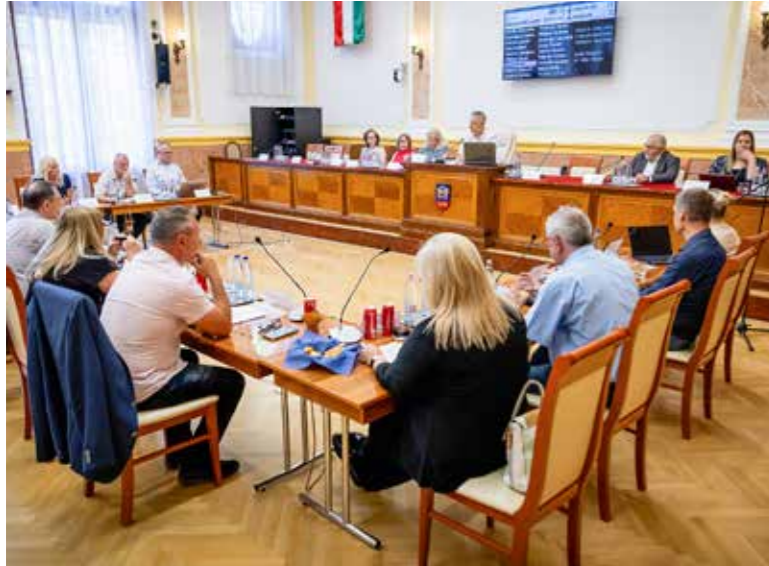
Új elismerésről is döntöttek

Több rendelet módosításáról, elfogadásáról döntöttek a képviselők, valamint létrehozták a Kispesti Állatbarát díjat is a június végi rendkívüli ülésen.