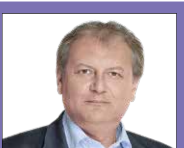
DR. HILLER ISTVÁN országgyűlési képviselő (MSZP)

2025. szeptember 11., csütörtök 17.00 (XX., Ady E. u. 84/A., MSZP-iroda)