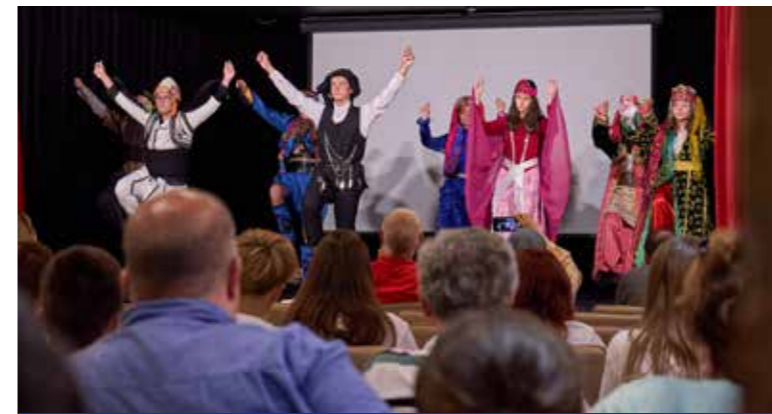
Mindig jó mulatság a gála

A testvérvárosokból, Pendikből (Törökország), Zomborból (Szerbia), Tasnádról (Románia), Smolyanból (Bulgária) érkezett gyerekdelegációk gálaműsorával ért véget a huszadik testvérvárosi diákcsereprogram kispesti fejezete a KMO-ban.