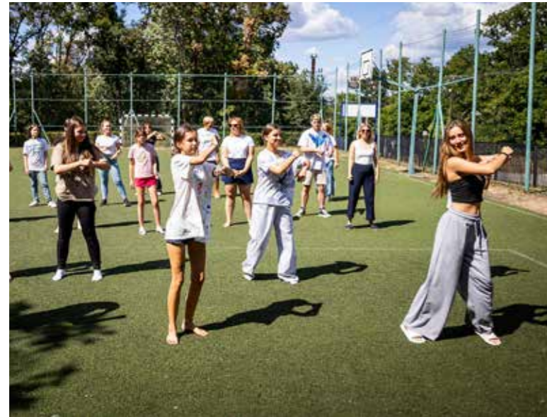
Mozgásban a KIFŐ

Tartalmas időtöltést és színvonalas programokat kínáltak a gyerekeknek 7 héten át a Kispesti Kóficok Kerületi Napközis Táborban. A Káptalanfüredi Tábor is benépesült a nyáron.