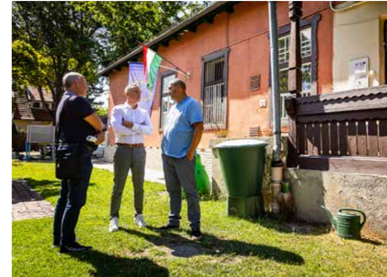
Minden intézményben volt karbantartás

A központi elvonások miatt nehéz helyzetben van az önkormányzat, de lehetőségeinkhez mérten minden intézményben végzünk karbantartási munkálatokat a nyári leállás alatt. Olyan feladatokat próbálunk elvégezni, melyek hosszú távra szólnak, ilyen például az elektromos hálózat felújítása. A mostani szabványoknak megfelelően végezzük el ezeket a munkálatokat, így reméljük, hogy a következő 20-30 évben már nem kell hozzányúlnunk. A karbantartásokat minden esetben egyeztetjük az intézmények vezetőivel, a dolgozókkal, és a Kispeszt Kft. létrehozott egy úgynevezett karbantartási ütemtervet is, valamint jelentős részben a saját szakembereivel végzi el a munkálatokat, ezzel is csökkentve a költségeket. Összesen