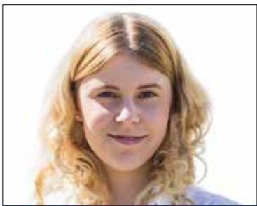
SZILAS KINCŐ 8. sz. választókerület (MSZP-DK-Momentum-Párbeszéd-LMP)

Előzetes telefonos egyeztetés alapján (06-30-270-0012) minden hónap második csütörtökén 17 és 18 óra között