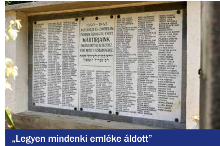
„Legyen mindenki emléke áldott”

Az 1944-ben haláltáborokba hurcolt zsidó és cigány áldozatokra emlékeztek a Kispesti Új temető izraelita parcellájában. 1944. június 30-án több mint háromezer zsidó és cigány származású embert deportáltak Kispestről különböző haláltáborokba. Kispest Önkormányzata gyásznappá nyilvánította június 30-át. A megemlékezést a Romák Felzárkóztatásáért Egyesület (ROMFEL) szervezte.