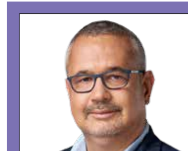
ARATÓ GERGELY országgyűlési képviselő (DK)

Egyéni bejelentkezés alapján a gergely.arato.kepviselo@gmail.com e-mail-címen vagy a 06-30-407-6369-es telefonszámon