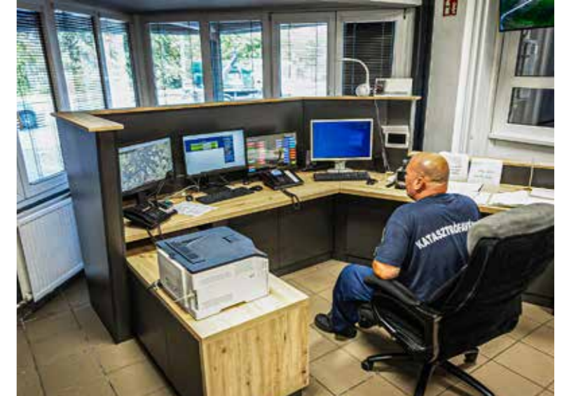
Megújult a kommunikációs helyiség

XVIII. kerületi önkormányzathoz hasonlóan, 2 millió forinttal támogattuk a technikai helyiség felújítását – hangsúlyozta a polgármester, és ígéretet tett arra, hogy a jövőben is törekszik rá az önkormányzat, hogy segíteni tudja a tűzoltókat. Kunhalmi Ágnes, a XVIII. kerület országgyűlési képviselője ez alkalommal arról beszélt, hogy örül annak, hogy a felújításhoz szükséges összeget a két önkormányzat közösen, „kooperációban” összerakta, és ő sikeresen lobbizhatott a hiányzó 1,6 millió forintért a Belügyminisztériumnál.