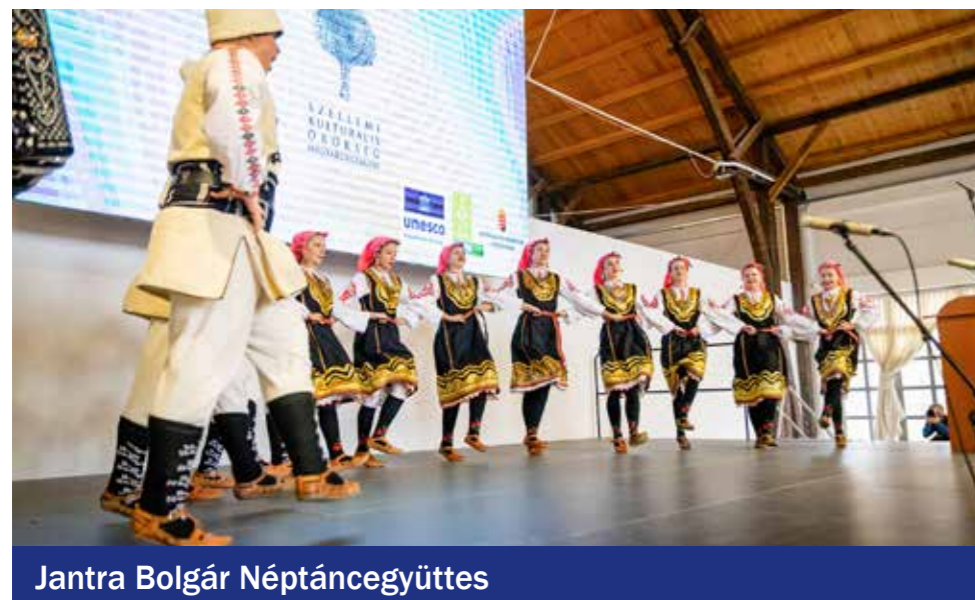
Jantra Bolgár Néptáncgyűttes