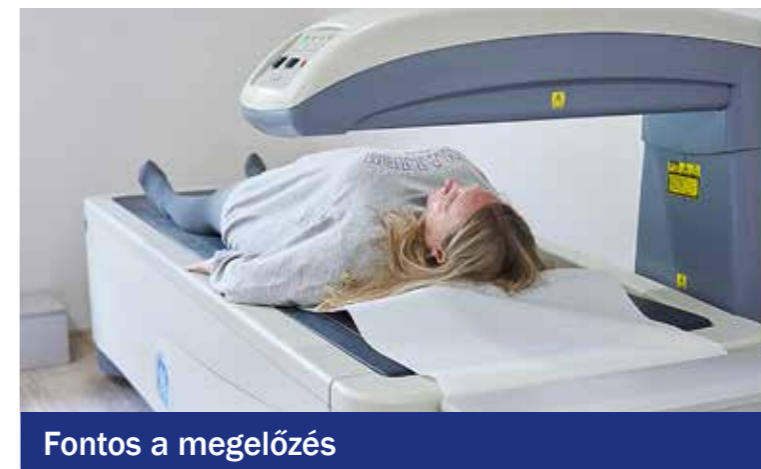
Fontos a megelőzés

A KEI az alábbi vizsgálatokra várta a kispestieket: citológiaszűrés (Nőgyógyászat), COPD-szűrés, légzésfunkció, csonttritkulásszűrés (Röntgen – DEXA), demenciaszűrés (Neurológia), EKG (Kardiológia), melanomaszűrés (Bőrgyógyászat), lúdtalpszű-