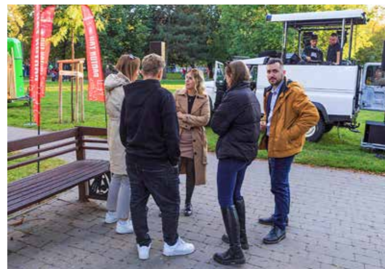
Több mint 700 kitöltés

A nyári sikerre való tekintettel ismét kérdőív kitöltő partit szervezett az önkormányzat a Kós Károly térre október elején. Az esemény a készülő ifjúsági stratégiához kapcsolódott.