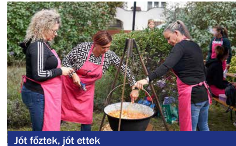
Jót főztek, jót ettek

A kertvárosi születésnapos főzőversenyen első lett a Wekerle Front csapatának (Honvéd utrak) pincepörköltje. Második helyen a Pingpongosok csapatának, cukkinivel megbolondított lecsója nokedlivel, míg a harmadik helyen a Jump-lányok hamis pásztortarhonyája végzett. A sütiversenyben