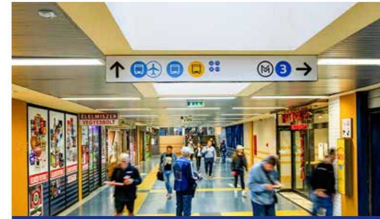
Fókuszban a köztisztaság

A térgondnokok hajnaltól késő estig, két műszakban dolgoznak kézi eszközökkel és gépi támogatással segítve a terek tisztaságának és rendezett megjelenésének megőrzését: köztisztasági szemlélet végeznek, felszedik az útlejtőbe kerülő szemetet, szükség esetén pedig felkérlik az illetékes fővárosi vagy kerületi önkormányzati szolgáltatókat, illetve az érintett elárúsítóhelyeket a kezelésükbe tartozó hulladékgyűjtők soron kívüli üritésére. A térgondnokok fontos feladata, hogy udvariasan