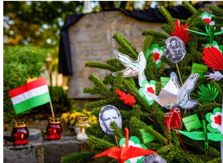
A hősök emléke