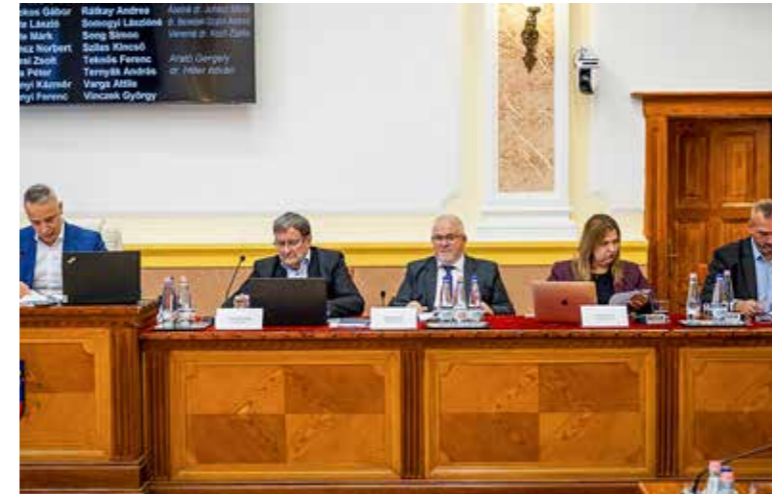
A polgármester és az alpolgármesterek

Péter polgármester elmondta: annak idején Budapesten ez volt az első görpark, március óta le van zárva a pálya, a tervek szerint nem véglegesen szűnik meg. Ternyák András hangsúlyozta: a szabályoknak nem felel már meg, ezért erre körülbelül 60-70 millió forintot kellene fordítani, de ebből már egy vadonatúj pályát lehetne létrehozni – tette hozzá. Végül a kiegészítő határozattal fogadták el a képviselők az előterjesztést, mely szerint a testület felkéri a polgármestert, hogy vizsgálta meg egy új pálya felépítésének lehetőségét a kerületben. Egyes közfeladatok átkerülhetnek a Kispest Kft.-hez és a Kispesti Uszoda és Sportközpont-hoz. A Kossuth téri piac és a Wekerlei Kispiac két olyan speciális ingatlanegyüttese az önkormányzatnak, amely vagyongazdálkodási és műszaki üzemeltetési feladatokat is igényel