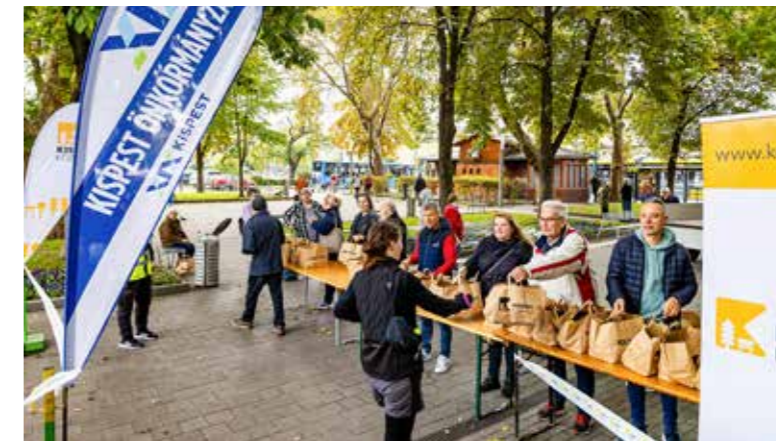
Mindenki 10 árvácskát kapott

Gondolva a várható nagy érdeklődésre, a meghirdetett ötezer tő árvácsk mellé még újabb ezer tővet készítettünk elő. Örömmel láttuk, hogy most valamennyi sorban állónak jutott az előre csomagolt növényekből. Egy-egy csomagba most is 10-10 tő árvácskát tettek a munkatársaink, amelyet lakcímkártya