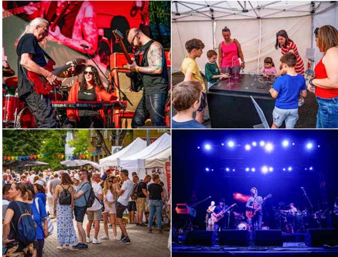
Remek koncertek, színvonalas programok

Kispest 155. születésnapján immár 18. alkalommal szervezte meg a Városünnepet a KMO csapata június első hétvégéjén.