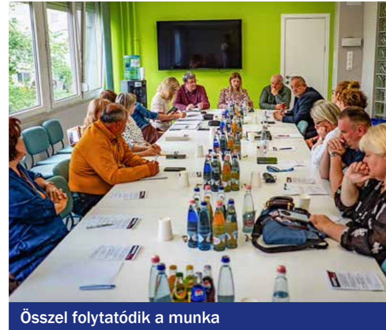
Ősszel folytatódik a munka