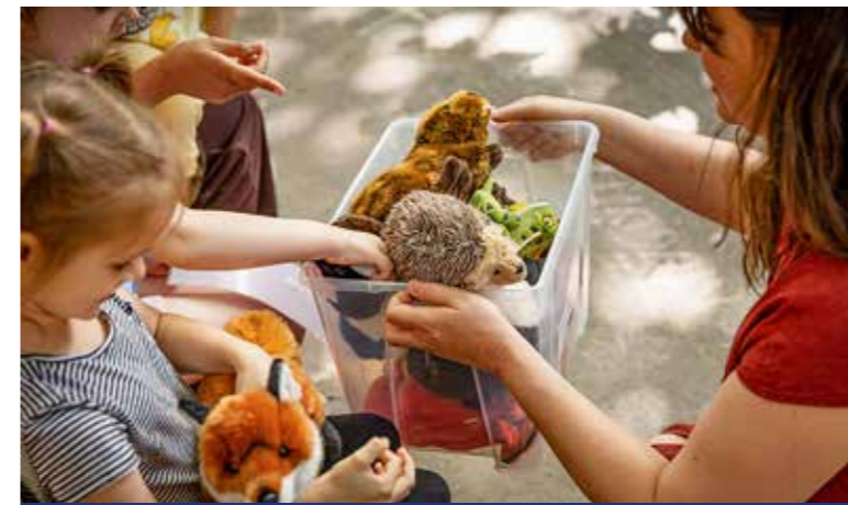
Játékosan a környezetvédelemről

A Fák között tanulva című programjával zárta első szemeszterét május végén a Közpark Tanoda a Móra EGYMI-ben.