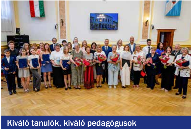
Kiváló tanulók, kiváló pedagógusok