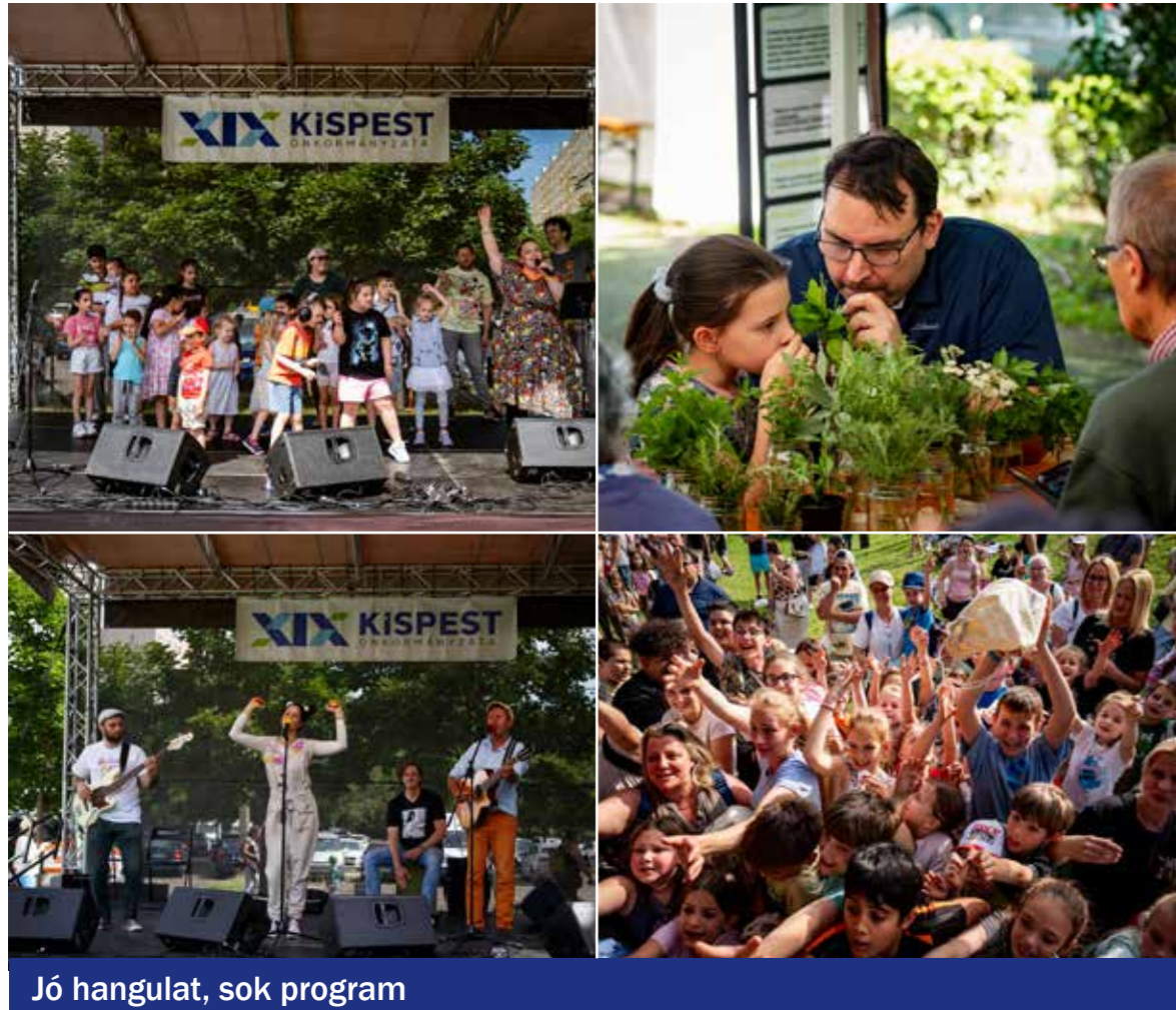
Jó hangulat, sok program

A szokásoknak megfelelően tombolasorsolással zárult az idei önkormányzati gyermeknap a Központi Játsszótéren. Gajda Péter polgármester a gyerekek segítségével 20 ajándécsomagot és három fődíjat: két kisebb és egy nagyobb JBL hangszórót sorsolt ki a nagyszínpadon. Tombolát a programokon való részvételért lehetett kapni a játékok vezetőitől.