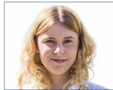
SZILAS KINCŐ 8. sz. választókerület (MSZP-DK-Momentum-Párbeszéd-LMP)

Előzetes telefonos egyeztetés alapján (06-30-270-0012) minden hónap második csütörtökén 17 és 18 óra között