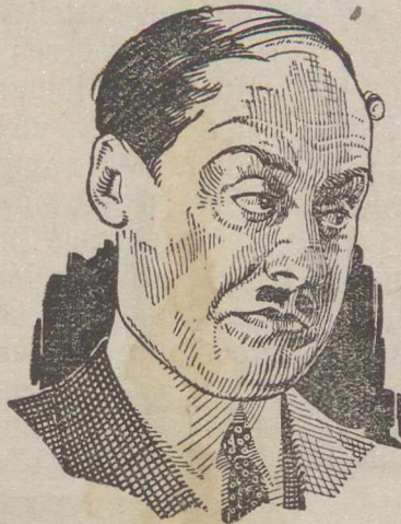
Genie „Merkwürdige Seifengossen“

Die Zigeuner sind deshalb ein Hindernis bei der Bekämpfung von Epidemien und schlechthin bei der Durchführung sanitätspolizeilicher Massnahmen. Die Geburtenziffer bei den Zigeunern ist eine unvergleichlich höhere als bei der weissen Rasse, dafür aber auch die Ziffer der Kindersterblichkeit. Die lebenswichtigen Bedarfsartikel und das Viehfutter verschafft sich der Zigeuner durch Diebstahl. Als Nomadenvolk hasst es die Arbeit und ist Nutzniesser der Arbeit anderer. Die für den Lebensunterhalt erforderlichen Mittel verschafft es sich durch Bettel, der ihm auch ermöglicht, Gelegenheitsdiebstähle zu verüben. Die Kriminalität innerhalb des Zigeunervolkes wächst von Jahr zu Jahr, unzählige Verbrechen werden von ihnen begangen.