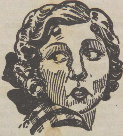
Geste „Strenghaltige Selbsterfüller“