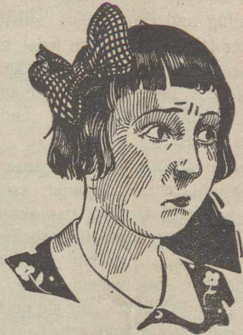
Serie „Merkwürdige Seltsamkeiten“

Wir unterscheiden bekanntlich zwischen Winter- und Sommerspritzungen. Durch die Winter- bzw. Vorfrühjahrsspritzungen mit einer 3prozentigen Solbarlösung werden eine Reihe von Schädlingen und sämtliche pilzliche Krankheiten wie Schorf, Mehltau usw. vernichtet. Die Schädlinge halten sich hauptsächlich am Fruchtholz und am jungen Holz auf, namentlich auf der Zweigunterseite, z. Teil hinter Knospenschuppen. Sollen hier die Spritzungen Erfolg haben, so kann dies nur bei gründlichster Arbeit sein. Man muss sich bemühen, sämtliche oberirdischen Teile des Baumes von allen Seiten zu treffen. Was an Schädlingen nicht getroffen ist, ist auch nicht vernichtet. Der Baum muss deshalb sozusagen abgewaschen werden; er muss nach dem Spritzen triefen. Flechten u. Moose sind bis zum Grunde zu durchfeuchten. Man spritze daher möglichst bei windstiller Witterung und schütze das Gesicht, damit man auch etwas gegen den Wind spritzen kann, durch eine Maske oder Tuch und fette sich die Hand ein. Neben den Sparverstäubern können auch gröbere Verstäuber, zum B. Nadelverstäuber, Verwendung finden. Der Verbrauch an Brühe ist bei den Winterspritzungen ein beträchtlicher, für ausgewachsene, grosse Bäume 60—70 l. Es ist aber besser gründlich, als nicht genügend gründlich zu spritzen. Werden die Spritzen