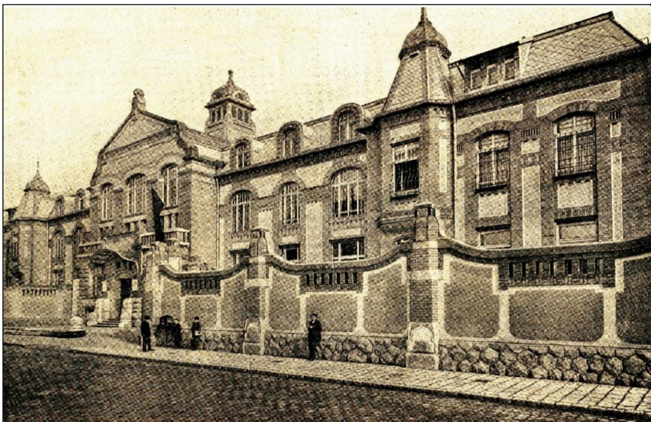
A Balassa utcai Elme- és Idegkórtani Klinika épülete 1908-ban

Éppúgy, mint Csáth, Moravcsik is vonzódott az irodalomhoz és a művészetekhez. A levelekből kiderül, hogy Csáth nemcsak mint igazgatóját, hanem barátját, vagy inkább atyai jóbarátját szerette és tisztelte Moravcsikot. Egyik késői levelében Csáth azt írja, hogy főnöke lehetett volna sokkal, de sokkal szigorúbb is hozzá, akkor talán nem fajult volna el annyira morfinizmusa. Levelében ezt írja: „ Jobb lett volna, ha akkor így szól hozzám, fiatalember a maga egészsége most már jó, de maga morfnista és magát elviszem Godesbergbe (Köln mellett) ott leszokik és azután 3 hó