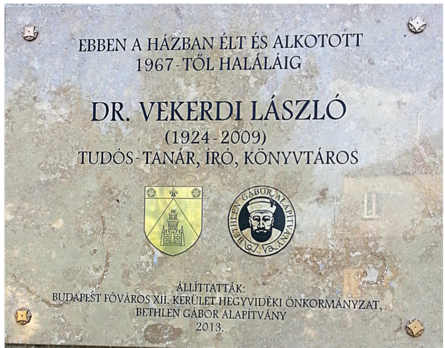
Vekerdi László emléktáblája Budapesten, (Határőr út 27.)

Legjelentősebb orvostörténeli munkája a XVIII. századi magyarországi (és erdélyi) pestisjárványokról tudósító írása. [21] A pestis kórokozóját 1894-ben fedték fel, addig csak találgatások voltak eredetéről. Vekerdi meggyőzően bizonyítja, hogy legfontosabb oka társadalmi: elsősorban a piszok, elhanyagoltság, fa- és vályogépületek okozzák a járvány terjedését, amely akkor kezd ritkulni, majd megszűnni, amikor a gazdasági és társadalmi fejlődés jobb életkörülményeket teremt. Jól jellemzi ezt a helyzetet, hogy a fejlettebb Nyugat-Európában a XVIII. században már lényegében megszűnt a járvány, amikor Közép- és Ke-