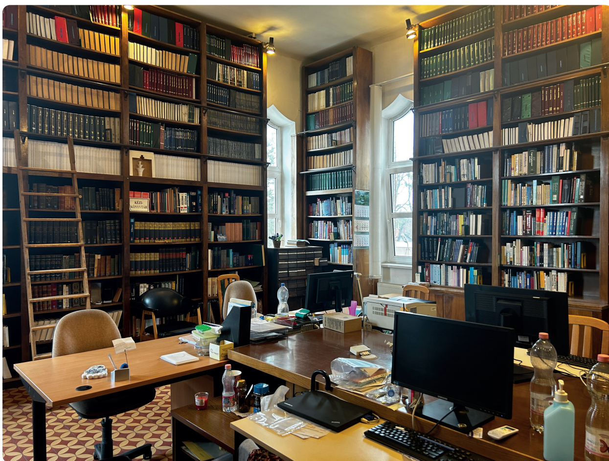
Fejér Vármegyei Szent György Egyetemi Oktató Kórház (FVSZGYEOK) - Orvosi Könyvtár 8000 Székesfehérvár, Seregélyesi u. 3. library@mail.fmkorhaz.hu