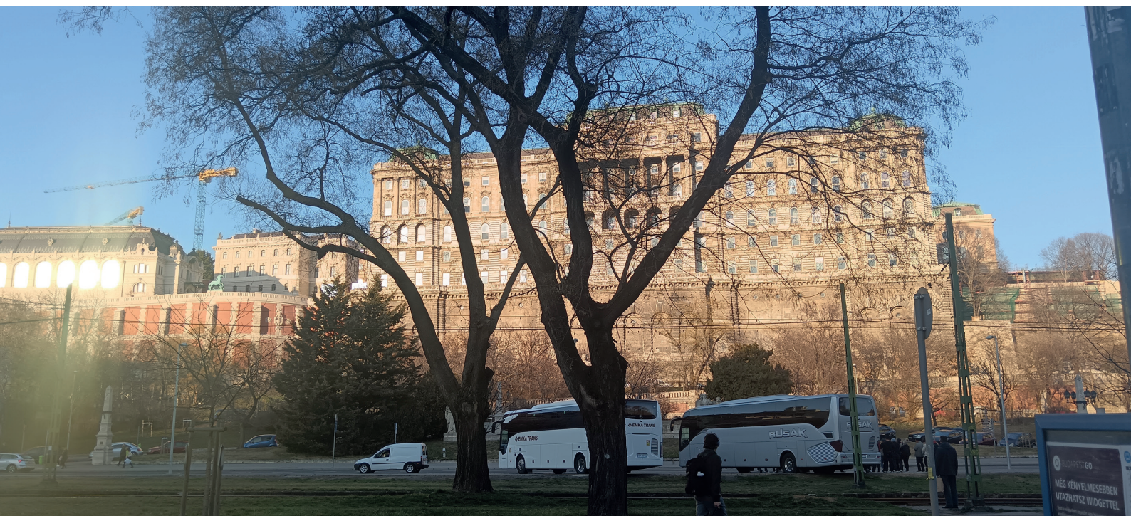
Nemzeti bibliotékánk, az Országos Széchényi Könyvtár impozáns épülete

https://www.facebook.com/photo.php?fbid=625353833459700&set=pb.100079552656601.-2207520000&type=3