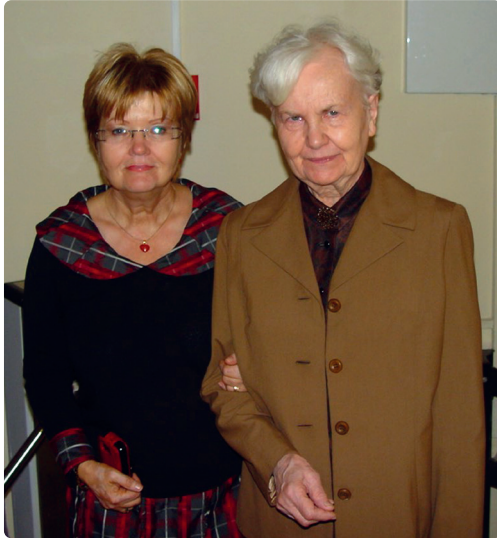
Informatio Medicata – 2010.

„A jó emberek elmúlnak; az istenfélők gyakran idő előtt meghalnak. De úgy tűnik, senkit sem érdekel, vagy nem csodálkozik, hogy miért. Úgy tűnik, senki sem érti, hogy Isten megvédi őket az eljövendő gonosztól. Mert azok, akik az istenfélő ösvényeket követik, békében nyugszanak, amikor meghalnak.” (Ézsaiás 57:1-2, NLT)