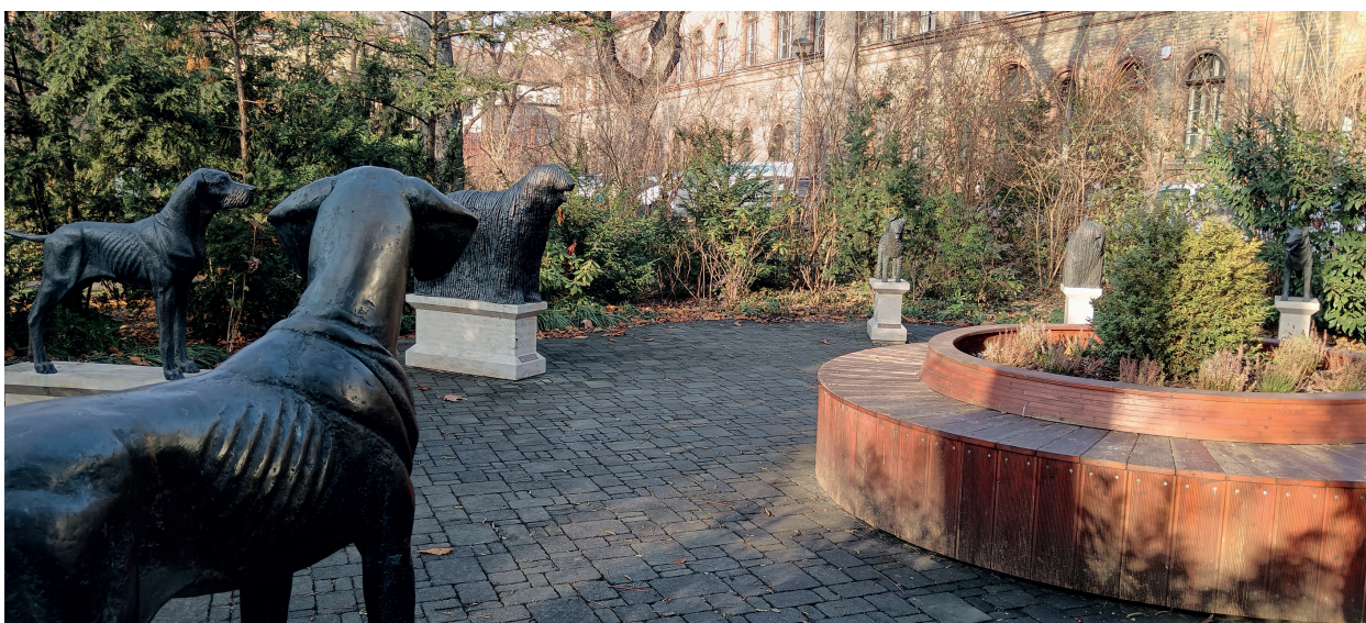
Őshonos magyar kutyafajták szobrai az egyetem parkjában