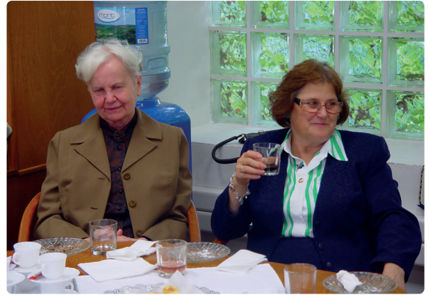
Adventi találkozó – 2022. Semmelweis Egyetem Központi Könyvtára