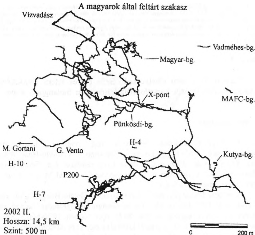
1. ábra: Részlet a Michele Gortani barlang alaprajzából Fig. 1. The Michele Gortani cave of the ground-plan of a detail

mélységűnek határozták meg azt. 2000-ben olasz kutatók összekötötték a Vianello-Buse d'Ajar rendszerrel. A magyar kutatók 1994 óta foglalkoznak rendszeresen a barlang feltárásával és 2002-ig további 14,5 km-el növelték meg annak hosszát, feltárva egy új sorrendben a 10. bejáratot is (Magyar-barlang, 1. ábra).