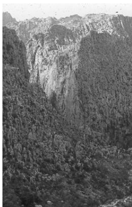
7. kép. Kopár karrok és karsztzurdok a Sierra Tramuntanában (Mallorca) Picture 7. Bare karren and karst canyon in Sierra Tramuntana (Mallorca)(original)