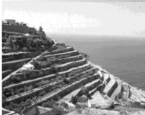
11. kép. Olajfa ligeterdők telepítése az erózió veszélyes karsztlejtőkön a Sierra Tramuntanában (Mallorca)

Picture 11. Parklike olive forestry on the erosive slopes in Sierra Tramuntana (Mallorca)(original)