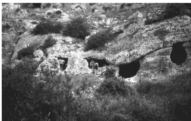
2. kép. Barlanglakások Massafrában (Dél-Olaszország) Picture 2. Cave „flats” (sassi) in Massafra (South-Italy) (original)

forniában), de pogány kegyhelyekként is szolgáltak a legendák szerint (pl. a Drach Mallorcán, a Teufelshöhle a Frank Jurában). Dél-Amerikában a puebló- és navajó indiánok krisztus után 1100 - 1300 között használták lakóhelyként a barlangokat. Dél-Olaszországban a Bizáncból elmenekült szerzetesek a 8. századtól a 13. századig letek menedékre a barlangokban. Később a 15. század folyamán a földművesek foglalták el a természetes barlangokból kialakított barlanglakásokat (2. kép), amit sassi néven említ a szakirodalom.