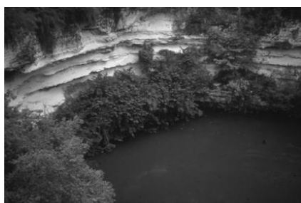
5. kép. Cenote (beszakadásos dolina) a Yucatán félszigeten Chichén Itza területén Picture 5. Cenote at Chichen Itza , Yucatan peninsula (Mexico) (original)

A mexikói Yucatán-félszigeten a maya civilizációktól kezdődően a 19. századig biztosították a karszt kutak a lakosság ivóvíz ellátását. A beszakadásos dolinák (cenote), vagy karszt-kutak is ivóvíz ellátására szolgáltak, mivel a Yucatán félszigeten a karsztvíz felszín közelben helyezkedik el (5. kép).