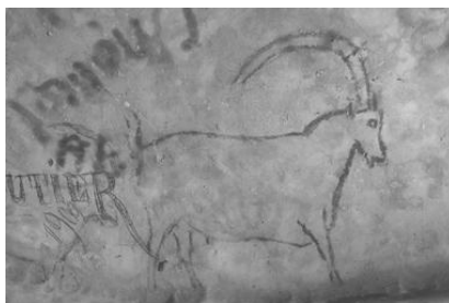
1. kép. Neolitikus barlangfestmény a Rouffignac barlangban (Dordogne völgy, Dél-Franciaország) Picture 1. Neolithic cave painting in Rouffignac cave (Dordogne valley, South France)

A neolitikum előtt a prehisztorikus idők embere a barlangokban tudott meghúzódni a természetes ellenségei elől. Az első karsztos tájhasználat a mediterrán régióban és Távols-keleti civilizációknál alakult ki. Az egymástól távol élő civilizációk azonos módon használták kezdetben a barlangokat. Több mediterrán ország barlangi festményein megtaláljuk a korai igénybevételre utaló bizonyítékokat. A barlang falfestményein megjelentek az állatok, amelyekkel gyakran együtt élt az ember a barlangban (1. kép). A barlangjáratok üledékeiben megmaradt csontvázak, eszközök, tűzhely- és ételmaradványok fontos információkat hordoznak az emberiség történetének egyes szakaszairól és lényegesek a prehisztorikus életterek rekonstrukciója szempontjából is. Az emberiség fejlődéstörténetének adatai, és az egyéb interdiszciplináris értékelések még sok információt szolgáltatnak a paleoökológiai történekekről.