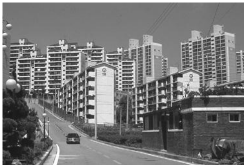
15. kép. A kőbányához tartozó bányász település Picture 15. The settlement belong to quarry (original)