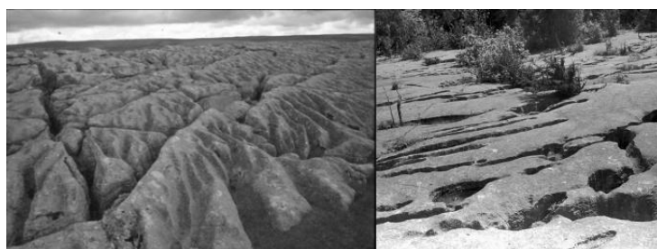
17. kép. Mészkőjárdák Great Asby Skarson (Anglia) Picture 17. Limestone pavements on Great Asby Kars (England)(original)

Komoly károsodást szenvedtek az emberi használat során a Nagy-Britanniában található mészkőjárdák (karrok), mivel legelő területek elhatárolására letermelték és elhordták sok helyről a felszínre bukkanó mészkőjárdákat (GOLDI 1987). Gyakran kerítések díszítésére ma is használják (17. kép) a mészkőjárdák anyagát.