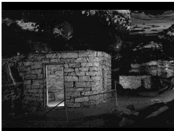
18. kép. Védő házikó a salétrom bányászok számára a Mammoth barlangban a történelmi bejárat közelében

egészségére, s a jó barlangi levegő ellenére voltak munkások, akik meghaltak itt, légúti ártalom következtében.