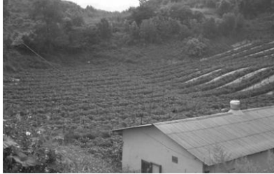
13. kép. Növénytermesztés (chili) a dolinákban (Dél-Korea) Picture 13. Arable land (chili) in a dolines (South-Korea) (original)

hegységben működő kőbánya ókori (Karbon) mészköve biztosítja (14. kép), a bánya mellett kialakult település (15. kép) képe hasonló az egykor Európában is létrehozott ipari városokéhoz.