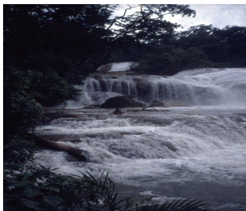
6. kép. Az Aqua Azul tetarata sor legalsó tufagátja (70 m széles) Picture 6. The undemost tufa damm of Aqua Azul tetarata (kalktuff) serie (original)

A szubtrópusi Mexikó barlangjainak mennyezetén, több helyen megjelenik a fák gyökérzete és mélyen behatol a páradús barlangi termekbe, gazdag cseppkőképződményein a laterites talaj magas vastartalmának nyomai jelennek meg.