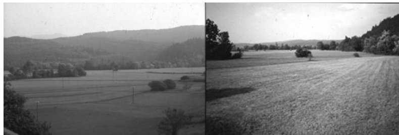
10. kép. Mezőgazdasági művelés a Popovo-(baloldal) és Planina poljén (jobboldal), a Dinári karszton Picture 10. Arable land on Popovo- (left) and Planina poljes(right) in Dinaric Karst (original)

A Föld lakossága folyamatosan nő, ezért a karsztok mezőgazdasági hasznosítása továbbra is fontos gazdasági tevékenység. A poljékben megfelelő vastagságú talaj biztosítja a mezőgazdasági művelést, annak ellenére, hogy azok időszakosan víz alá kerülnek, ami akadályozza a zavartalan művelést (10. kép). A lejtőkön viszont az erózió veszély miatt, csak a teraszos művelés lehetséges (11. kép).