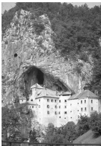
3. kép. Luegg vára a predjamai barlang (Szlovénia) bejáratánál Picture 3. Castle of Luegg at the front of Predjama cave (original)