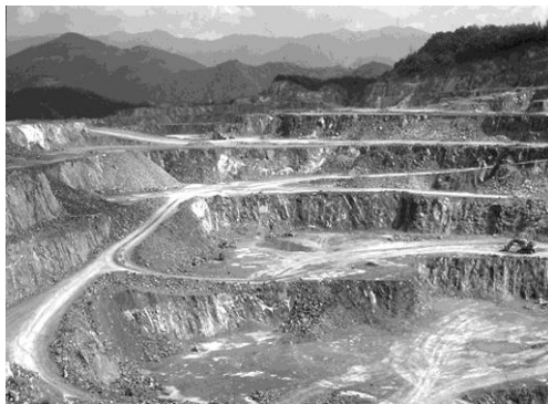
14. kép. Karbonkori mészkőbánya Dél-Koreában Picture 14. Limestone quarry (Karbon) in South-Korea (original)