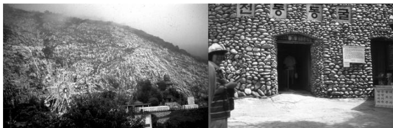
19. kép. Az Abukuma barlang kopár, külső környezete (baloldal), egy óriáskeréssel, és az Irimizu barlang bejárata (jobboldal)

Picture 18. Protection cottage for the miners near to „Historical entrance” of Mammoth cave (original).