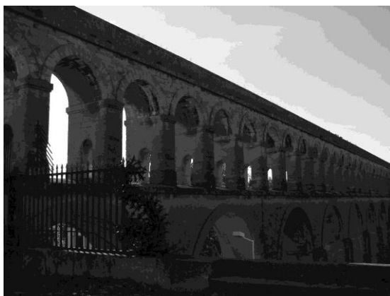
4. kép. Felszíni vízvezeték Montpellierben Picture 4. Aqueduct in Montpellier (original)

Kínában és a Kolumbusz előtti Amerikában is a karszt-kutak és a barlangi források voltak a legfontosabb ivóvízforrások. A mexikói Yucatán-félszigeten a maya civilizációk idejétől kezdődően egészen a 19. századig a karszt kutak jelentették a lakosság ivóvíz potenciálját.