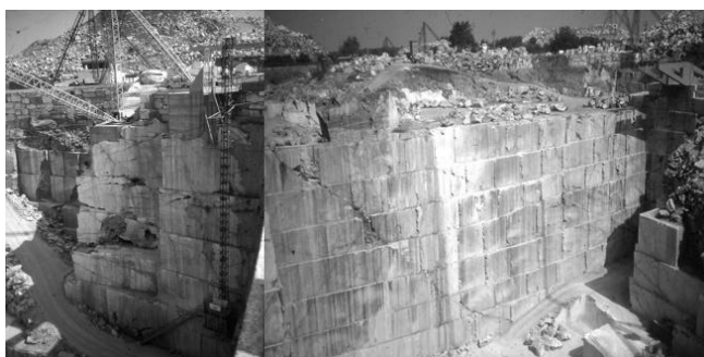
16. kép. Márványbánya Borba közelében Portugáliában Picture 16. Marble mining in Portugal near of Borba (original)

Igen jelentős mennyiségű márvány kitermelése folyik a portugáliai Borba közelében (16. kép), ahol helyben munkálják meg szállításra készen a márványlapokat (jelentős mennyiség exportra kerül).