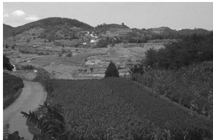
12. kép. Szántóföldi hasznosítás a Taebek-hegységben (Dél-Korea) (baloldal), terra rossa jellegű talajon (jobb- oldal)

Dél-Koreában a Taebek hegységben, az élénk reliefű területeket is szántóföldi művelésre hasznosítják, mivel itt az ellátandó lakosság-számhoz viszonyított termőterület igen kicsi, s emellett a terra-rossza jellegű talaj (12. kép) termőképessége sem túl jó.