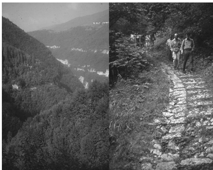
8. kép. Cala del Sasso Olaszországban (baloldal), a kitermelt fák elszállításának kiépített mesterséges útja (jobboldal), 4444 lépcsővel)(Italy) Picture 8. Cala del Sasso in Italy (left), the man made route for the transport of lumber threes (right)(Italy)(original)

A korai hajóépítésekhez nagymennyiségű fára volt szükség a Földközi-tenger vidékén, ami erdőirtásokhoz vezetett ezen a területen, ami szintén felerősítette lokálisan a talajeróziót (8. kép).