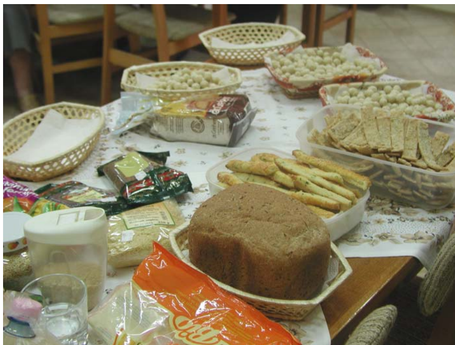
Egészséges ételek, magvak