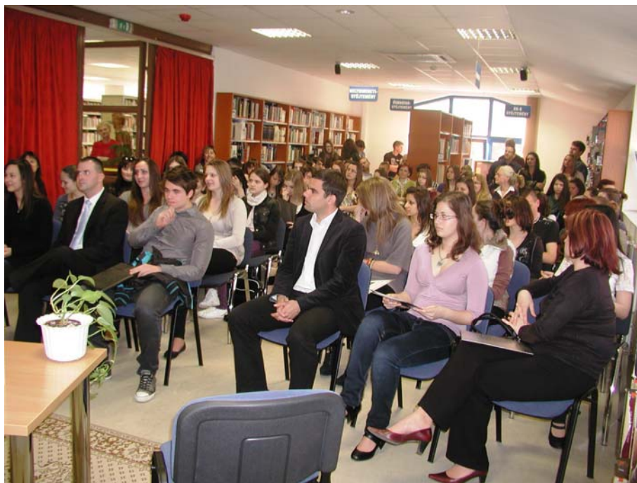
Magyar Költészet Napja – a hallgatóság

Ezen alkalomból került sor a „Tavasz és szerelem” című kiállítás megnyitójára is, melyen a Csány László SZKI diákjainak József Attila verseihez készített illusztrációi voltak láthatóak.