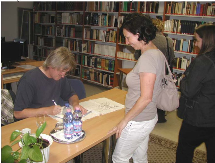
Háy János dedikál

Az Ünnepi Könyvhét keretében Háy János író, drámaíró volt a vendégünk. A Gyimesi Katalin gimnáziumi tanárnő által vezetett találkozón a szépszájú közönség az író életéről, zalaegerszegi kapcsolatáról, a műveiről, további terveiről tudhatott meg érdekességeket. Rendezvényünket a Márai-program támogatásával valósítottuk meg. A találkozó végén sokan éltek a dedikálás lehetőségével is.