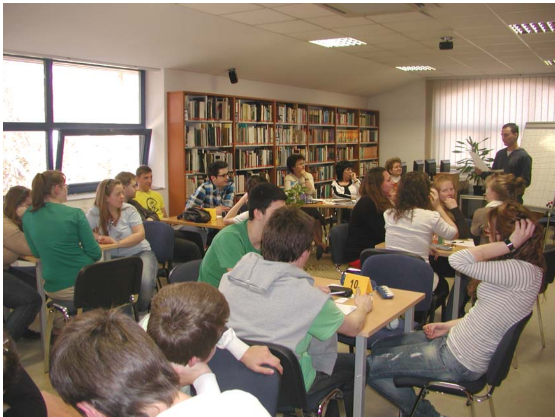
A könyvtárhasználati vetélkedő résztvevői és a zsűri

A végig izgalmas, jó hangulatú vetélkedő első két helyén a Zrínyi Miklós Gimnázium csapatai végeztek, míg harmadik helyezettek a Páterdombi SZKI diákjai lettek. Ezúton is köszönjük valamennyi csapat részvételét, a felkészítő tanárok áldozatos munkáját, és várjuk jelentkezésüket a következő években is. Minden részt vevő emléklapot kapott, a helyezettek pedig oklevelet és könyvjutalmat.