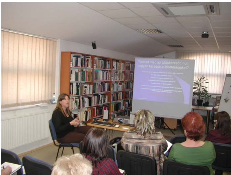
Előadás felnőtteknek – álláskereső a Neten

Az Informatikai és Könyvtári Szövetség – a Nemzeti Kulturális Alap támogatásával – immár 13. alkalommal rendezte meg az Internet Fiestát a könyvtárakban, 2012. március 23-30. között, melyhez könyvtárunk is csatlakozott. A gyerekeknek szóló játékos foglalkozásokon túl a felnőtteknek az „Internet a munka világában” című előadásra került sor