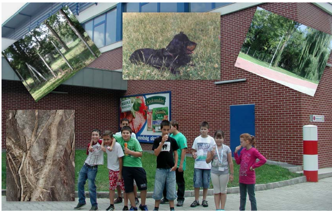
A József Attila Városi Könyvtár informatikai táborában résztvevő gyerekek fotó kollázsa