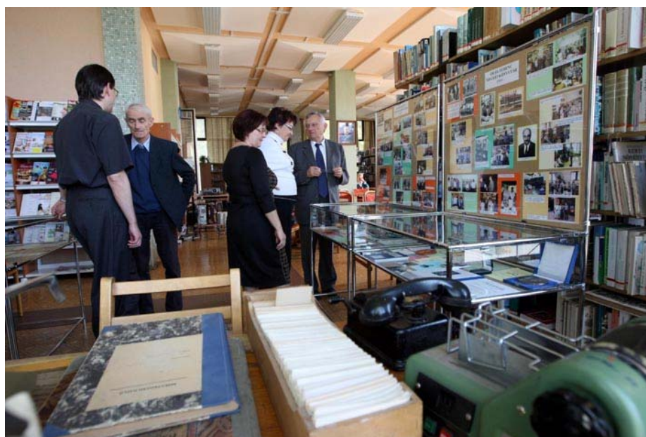
A kiállítás első látogatói