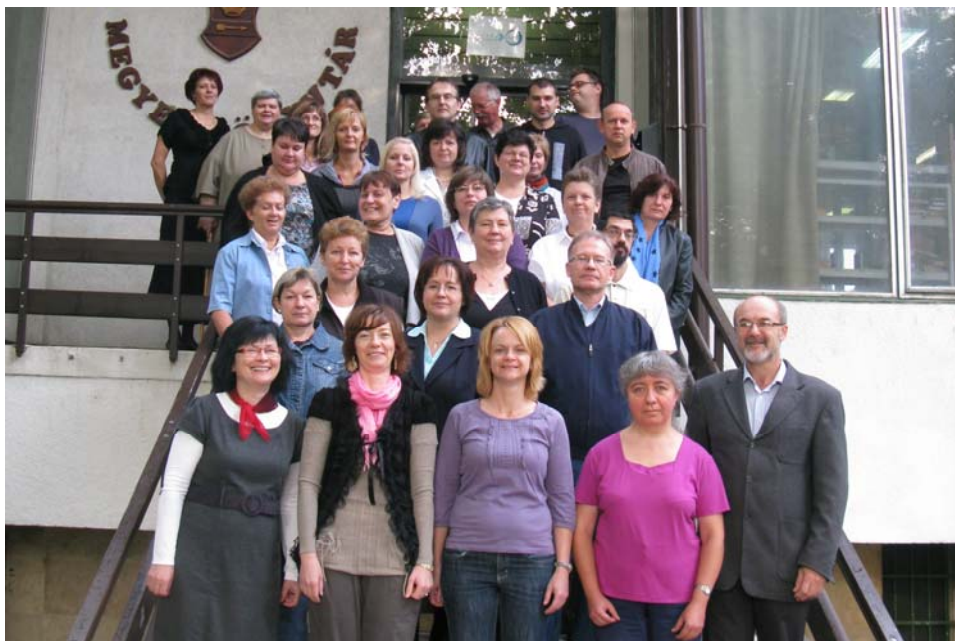
A megyei könyvtár munkatársai az épület előtt

Az ünnepség utáni fogadáson Bakos Klára, a Magyar Könyvtárosok Egyesülete elnöke mondott köszöntőt. A visszajelzések alapján bátran állítható, hogy igazán meghitt és méltó ünnepséget sikerült szerveznünk.