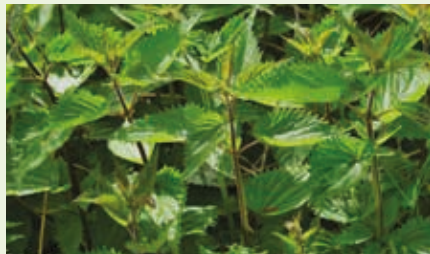
Sokoldalú segítőnk a csalán

Szedjünk 1 kg friss csalánt a kevésbé forgalmas utak széléről vagy patakpartról. A bátrabbak kesztyű nélkül is megpróbálkozhatnak vele, mert a csaláncsípés jótékony hatású, főleg a reumás panaszokkal küzdők számára. Az összegyűjtött növényt aprítsuk fel egy nagyobb, zárható edényben, ami fából, agyagból, kőből vagy műanyagból, de semmiképpen sem fémből készült. Majd engedjük fel a tartályt 10 liter eső- vagy forrásvízzel. Ha ennek híján vagyunk, akkor állott csapvizet használjunk. Fontos, hogy a csalánt ellepje a víz, ha másképp nem