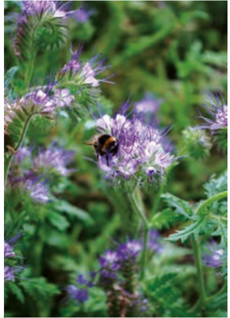
A mézontófű sok vadméheknek, dongónak nyújt táplálékot, és a talajszerkezetet is javítja

A bio növényvédelem igazi Jolly Jokere a csalánlé, ami permetezve vagy belocsolva nemcsak elűzi a nem kívánt betolakodó rovarokat, hanem a