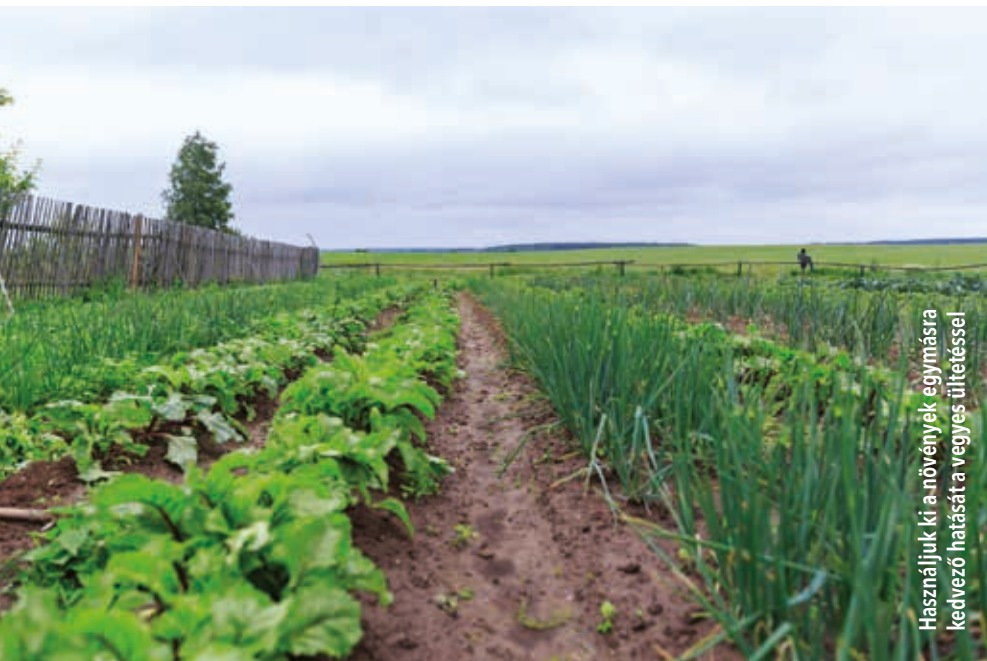
Használjuk ki a növények egymásra kedvező hatását a vegyes ültetéssel