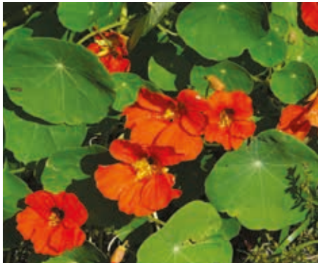
A sarkantyúka talajtakarónak alkalmas növény, ráadásul salátában is felhasználhatjuk a virágát és a levelét

Ha retkünk levele lukacsos, minden bizonnyal földibolhák vetették meg a lábukat a növényen. Ez a rovar viszont csak a száraz helyeken érzi jól magát, így alapos locsolással költözésre kényszeríthetjük őket. Jó megelőzés ugyanerre a problémára, ha fátyóflóliát terítünk az egész sorra.