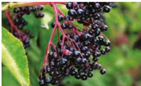
A bodza bizonyítottan segít a felső légúti betegségek leküzdésében

A healthline.com oldalon 15 olyan növényt sorolnak föl, amelyek laboratóriumi körülmények között képesek gátolni egyes vírusok működését, vagy lassítani a szaporodásukat. Az oregánó, az olasz ételek egyik nélkülözhetetlen fűszere a karvakrol hatóanyaga ré-