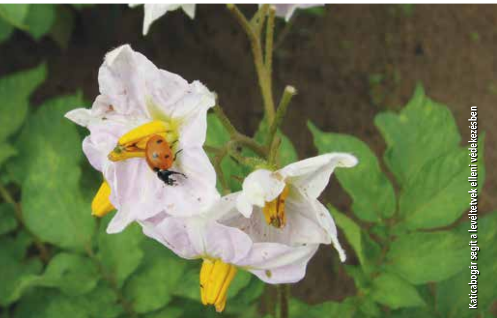
Katicabogár segít a levéltetvek elleni védekezésben