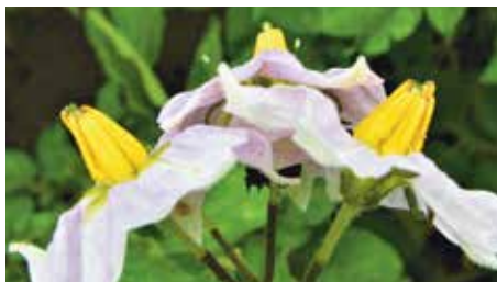
Fátyolkatojások a burgonyavirágon