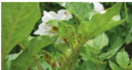
Levéltetvek a burgonya levélfonákán

Meg kell még említeni a burgonya gyökerét és gumóit károsító drótférget, a pattanóbogár lárváját, valamint a pajorokat is, mint például a cserebogárpajor. Ellenük szükség esetén talajfertőtlenítéssel tudunk védekezni. A cserebogarakat csapdázással össze lehet fogni, így a talajban gyökeret rágó lárvák nem tudnak éveket károsítani.