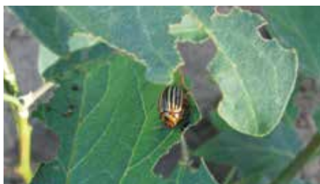
Burgonyabogár a tojásgyűmölcs lombját rágja