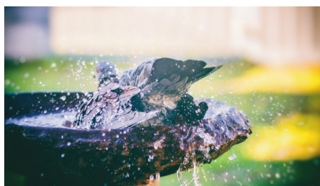
A madarak az itatókat fürdőzésre is használják

A vizet rendszeresen, naponta többször is ajánlott cserélni, egyfelől a szennyeződések miatt, ugyanakkor a nagy melegben hamar fölmelegedhet az itató.