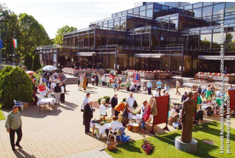
A Honvéd Kulturális Központ kertjében, naposított időben találkoztak a budapesti kertbarát körök képviselői