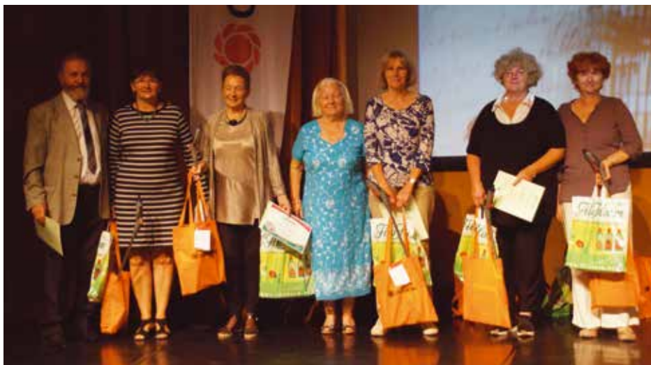
A legjobb budapesti díszkertek kategória nyertesei a szervezőkkel

delmet, a komposztálást, a saját szaporítást, a másodhasznosítást vették figyelembe, sorolta a szempontokat. Mindezek alapján egyes kategóriákban több első és második díjat is odaítéltek.