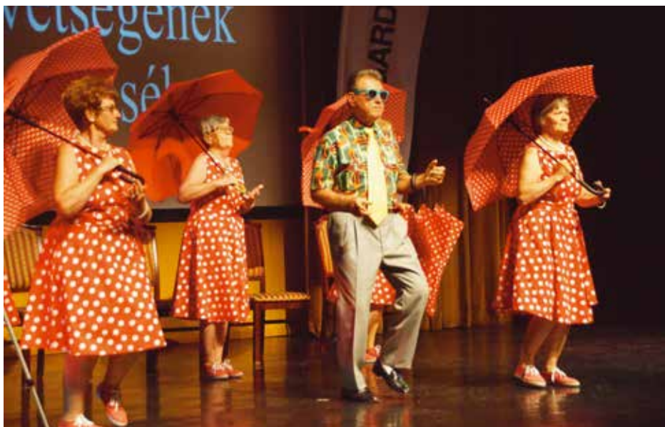
Mindenkit fölpezsdített az egri Nyolcpettyes táncsoport produkciója