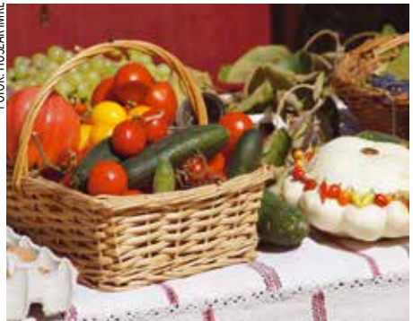
Sokféle különleges zöldség kerül ki a budapesti kertekből

tait is, és aktív kapcsolatot ápolnak felvidéki kertbarátokkal. Rimaszombaton is kialakítottak egy kis génbankot régi magyar fajtákból.