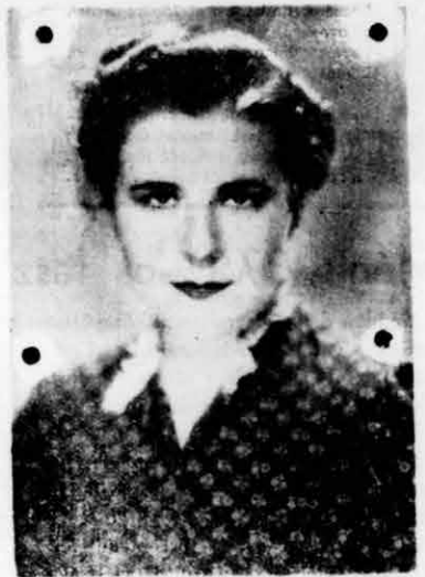
PAULA WESSELY az „ARATÁS” (Julika) film főszereplője. A filmet 27. 28. 29-én mutatja be az APOLLO MOZGÓ.