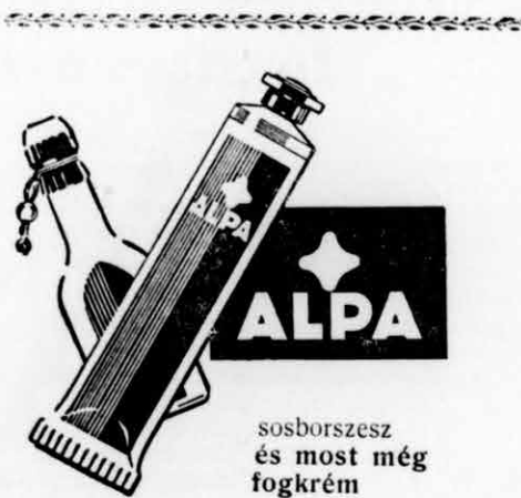
sósorszesz és most még fogkrém