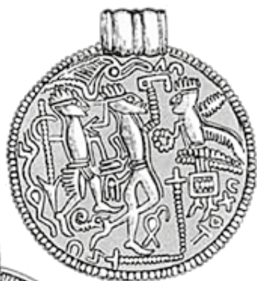
Az ún. háromalakos brakteáták, melyeken feltehetően Baldr meggyilkolása látható