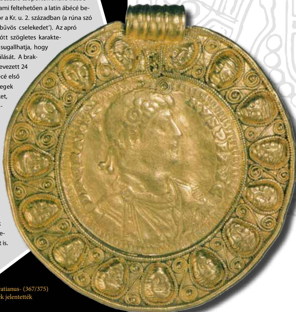
A híres szilágysomlyói kincslelet Gratianus- (367/375) medalionja. Az ehhez hasonló érmék jelentették a legkorábbi brakteáták előképét

A rúnairás a germán nyelvet beszélő csoportok önálló írásbeliségének első terméke volt, ami feltehetően a latin ábécé betűiből fejlődhetett ki valamikor a Kr. u. 2. században (a rúna szó jelentése: 'titok', 'mormogás', 'bűvös cselekedet'). Az apró tárgyakra, fára, fémre és kőre rótt szögletes karakterekből álló írás szakrális jellegét sugallhatja, hogy az Eddákban Odinhoz kötik feltalálását. A brakteátákon látható feliratokat az úgynevezett 24 karakterből álló futhark-al (a rúnabécé első elemeivel) jegyezték le. Az ismert szövegek döntő hányada jókívánságokat, neveket, ezek kombinációját, vagy éppen az önmagában is mágikus tartalommal bíró futhark sort jeleníti meg. Emellett természetesen ismerünk önmagukban álló vagy talán anagrammaként értelmezhető véseteket is. A Szatmár lelőhelyről származó brakteátán a tualet Iní rúnasor olvasható, mely szintén anagrammaként értelmezhető. Az egyes rúnakarakterek feltételezhetően magukban is hordozhattak egyfajta önálló jelentést, vagy feltételezhetünk esetükben betűmágiát is.