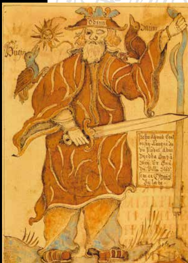
Odin ábrázolása egy 17. századi izlandi prózai Edda kéziratából