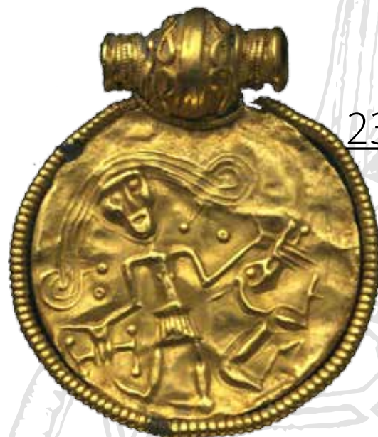
A trollhätteni brakteata, Tyr hősi tettének ábrázolásával

A rúnairás a germán nyelvet beszélő csoportok önálló írásbeliségének első terméke volt, ami feltehetően a latin ábécé betűiből fejlődhetett ki valamikor a Kr. u. 2. században (a rúna szó jelentése: 'titok', 'mormogás', 'bűvös cselekedet'). Az apró tárgyakra, fára, fémre és kőre rótt szögletes karakterekből álló írás szakrális jellegét sugallhatja, hogy az Eddákban Odinhoz kötik feltalálását. A brakteátákon látható feliratokat az úgynevezett 24 karakterből álló futhark-al (a rúnabécé első elemeivel) jegyezték le. Az ismert szövegek döntő hányada jókívánságokat, neveket, ezek kombinációját, vagy éppen az önmagában is mágikus tartalommal bíró futhark sort jeleníti meg. Emellett természetesen ismerünk önmagukban álló vagy talán anagrammaként értelmezhető véseteket is. A Szatmár lelőhelyről származó brakteátán a tualet Iní rúnasor olvasható, mely szintén anagrammaként értelmezhető. Az egyes rúnakarakterek feltételezhetően magukban is hordozhattak egyfajta önálló jelentést, vagy feltételezhetünk esetükben betűmágiát is.