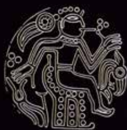
A várpalotai 21. sír arany B típusú brakteátája

Az 5. század második felében a skandináviai területeken kialakult egy egyedi tárgytípus, melyet a szakirodalom már a 19. század kezdete óta brakteátának (latin bracteata – 'érem') nevezett. Az aranyból és ezüstből készült tárgyak gyakorlatilag kerek érmék voltak, melyeknek csak az egyik oldalán volt kép, s egy függesztőfüllel is ellátták őket. A tárgytípus alapformája a késő császárkori császárportrés pénzekből alakult ki (ezeket a Római Birodalom feltehetően az egyes barbaricum szövétségeinek elismerés gyanánt küldte el). A legkorábbi példányok tehát még a profilból ábrázolt római uralkodók arcával díszített érméket utánozták. A mediterrán kapcsolatok azonban olyan szívósnak mutatkoztak, hogy gyakorta még a későbbi darabok ábrázolásain is felfedezhetők. Ezeket a vezetőik presztízsük és a rómaiakkal ápoló kapcsolataik kifejezéséül a nyakukban hordva viselték. Az idő előrehaladtával azonban a császárok képeit és a medalionokon látható antik ábrázolásokat a skandináviai ötvös mesterek a saját kultúrájuk igényei szerint kezdték el átalakítani. A motívumok egy részét megtartották, de már önálló elemeket is illesztettek hozzájuk, melyek feltehetően összefüggésben lehetnek az északi csoportok vallási képzeletével is (erre utalhatnak a tárgyakon található mágikus rúnafeliratok is).