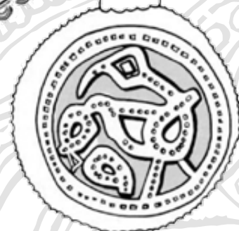
Brakteáták a Kárpát-medencéből