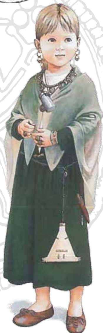
A frankfurti dóm alatt nyugvó előkelő lány viseletének rekonstrukciója (7–8. század fordulója), nyakában brakteátákkal

A vallástörténeti kutatás számára komoly problémát jelent egy-egy írott kultúrával nem rendelkező társadalom hiedelemvilágának és istenképzeteinek rekonstrukciója. Az ókor és kora középkor germán nyelvet beszélő csoportjainak a különböző magas kultúrákkal (így a görögökkel vagy a rómaiakkal) vívott fegyveres harcainak ismertetése mellett az antik szerzők révén megörökítésre került a barbárok hitvilága is. Ezek a tudósítások azonban sok esetben egyfajta szűrőn mentek keresztül, hiszen a görög és latin nyelven író szerzők gyakorta saját isteneikhez hasonló rendszerbe próbálták meg a germánok által tisztelt mitikus alakokat is beilleszteni. Igen komoly problémát és kihívást jelent a kutatás számára az a jelenség is, hogy a belső keletkezésű, a saját kultúrát megőrkítő leírások igen kések. A germán kultúrkör kozmológiájára vonatkozó belső keletkezésű munkák (az Eddák ) a 12–13. században íródtak, amikor már a korábbi vad vikingek leszármazottjai is a keresztény hitet vallották.