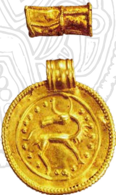
A poysdorfi langobard temető brakteátája a szarvasszerű mitikus lényvel

Az egyes rokon motívumokat rendszerezve a régészeti-ikonográfiai kutatás hat csoportot különített el, melyeket a latin ábécé betűivel (M, A, B, C, D, F) jelölnek. Napjainkra már több mint 1000 darab ismert ezekből a tárgyakból, melyeknek döntő hányadát az 5–6. században készíthették. Az északi medalionok kutatásában jelentős áttörést az 1960-as, 1970-es évek hoztak, amikor Karl Hauck vezetésével egy külön kutatócsoport alakult, mely a nagy mennyiségű leletanyag széleskörű feldolgozását tűzte ki céljává. Az 1980-as évekre megszülettek az első ikonológiai katalógusok, melyekben az egyes darabokat és típusokat minden részletre kiterjedő vizsgálat alá vetették és rendszerezték. Az időrendi és tipológiai rendszerezésük mellett Karl Hauck foglalkozott az egyes fő motívumkörök mögött rejlő szellemi háttér, a „mondanivaló” megfejtésével is. A germán hiedelemvilágra vonatkozó írott kútfőket jól ismerve az egyes jeleneteket a mai napig tartó érvénnyel sikerült megfejtetnie. A B típusú brakteáták három alakot felvonultató darabjait például Baldr isten halálának legendás történetéhez kötötte.