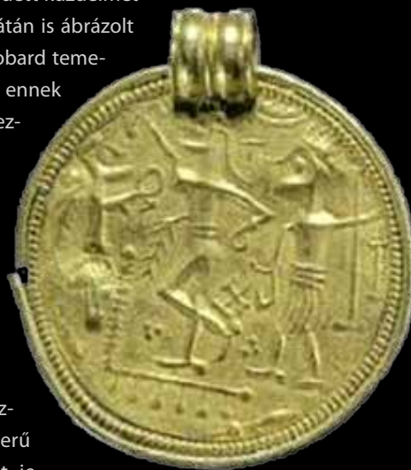
Brakteáta a Kárpát-medencéből (Szatmár)

A langobard területekről származó példányok között megtalálhatóak a B típusba sorolható emberalakos és a D típushoz tartozó, mitikus állatábrázolásokat (kígyót/sárkányt, szarvast) a középpontba helyező darabok is. A Várpalotán előkerült egyik B típusú brakteáta közepén elhelyezkedő alakot és kíséző állatait (madarak, farkas) a korábbi kutatás szintén Wodannal azonosította. A várpalotai példánnyal kapcsolatban fontos kiemelni, hogy egy eddig párhuzam nélküli brakteátával állunk szembe. A hasonló ikonográfiai sablon alapján készült darabokon a középpontban álló alak általában elkeseredett küzdelmet folytat a várpalotai brakteátán is ábrázolt állatfigurákkal, míg a langobard temetőből származó ékszeren ennek nyomát biztosan nem fedezhetjük fel. Másik három – ugyancsak Várpalotán előkerült – brakteátán különböző kígyószerű testtel és csőrrel ábrázolt mitikus állatalakok fonódnak össze, míg a Poysdorffban előkerült példányon pedig egy visszafelé forduló, hullószerű nyelvvel ábrázolt szarvast jelenített meg az egykori ötvösmester. A mitikus állatalakok egyszerre értelmezhetőek ártó lényként (pl. Midgard kígyó), valamint óvó-védő alakként is. Az utóbbi magyarázatnak feltehetően nagyobb valószínűséget tulajdoníthatunk, amit több írott forrás (Paulus Diaconusnál a kígyó segítő szellemként jelenik meg) és régészeti lelet (kígyófejekkel díszített koporsók) is bizonyíthat.