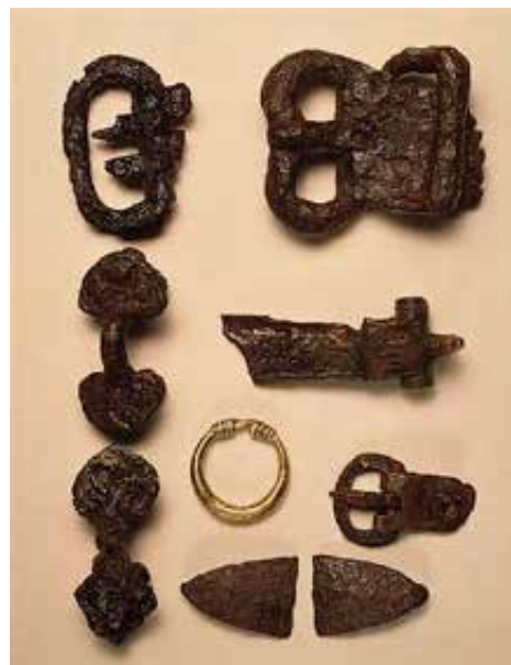
A groix-i viking leletek