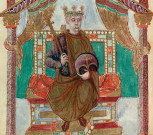
Kopasz Károly középkori portréja

tak apróbb részleteiben is megvalósítani. Ehhez egy erősebb, kezdeményezőbb központi hatalomra lett volna szükség, ám Kopasz Károly és legfőképp utódai már egyre kevésbé uralták a Nyugati Frank Királyság egészét. A szajnai folyami erődök, hidak és partvédelmi rendszerek mindenesetre azon kevés példa közé tartoznak, amik még Kopasz Károly kezdeményezésére épültek ki a 860-as évektől, és később is használható védelmi infrastruktúrának bizonyultak. A Loire-on ilyen védművek nem épültek, ám egyedi példák előfordultak azért a folyamzárás