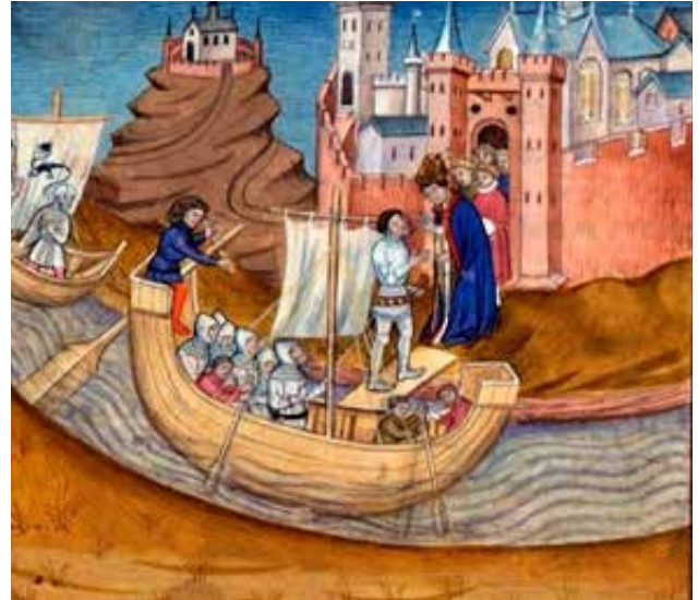
Rollo normann vezér ábrázolása a Grandes Chronique-ban

tak apróbb részleteiben is megvalósítani. Ehhez egy erősebb, kezdeményezőbb központi hatalomra lett volna szükség, ám Kopasz Károly és legfőképp utódai már egyre kevésbé uralták a Nyugati Frank Királyság egészét. A szajnai folyami erődök, hidak és partvédelmi rendszerek mindenesetre azon kevés példa közé tartoznak, amik még Kopasz Károly kezdeményezésére épültek ki a 860-as évektől, és később is használható védelmi infrastruktúrának bizonyultak. A Loire-on ilyen védművek nem épültek, ám egyedi példák előfordultak azért a folyamzárás