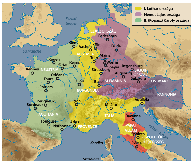
A Frank Birodalom felosztása után