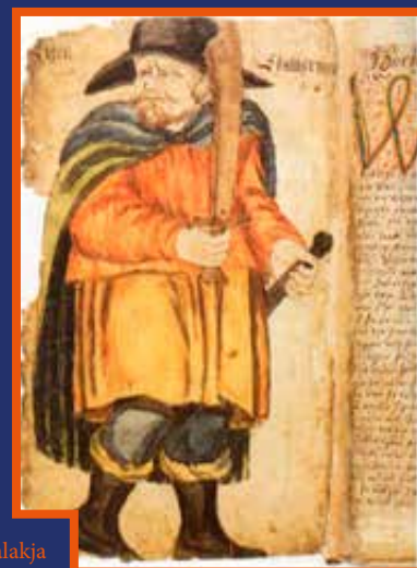
Egill alakja egy 17. századi kéziratban