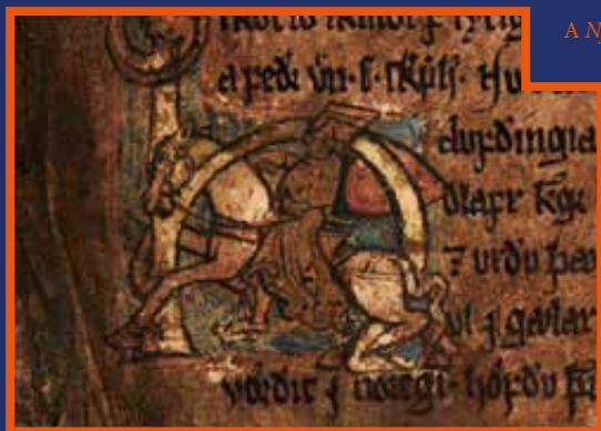
A Njáls saga egyik részlete