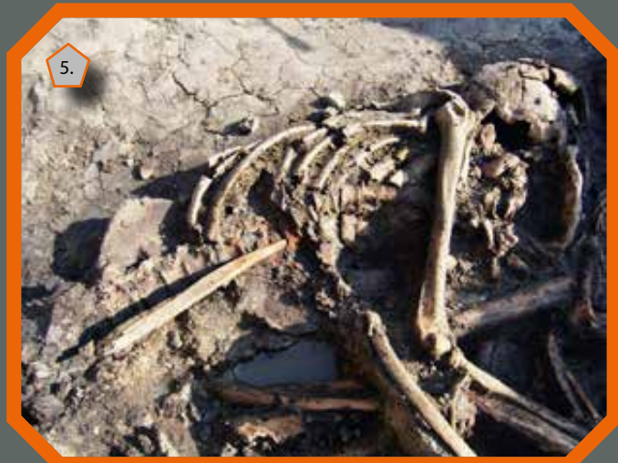
Egy felnőtt nő hasába döfött emberi szárkapocscsont feltárás közben

Az ásatás északi részén feltárt gödör csoportba temetett/dobott 48 egyén kor és nem szerinti megoszlása változatos képet mutat: 16 magzat/újszülött, 8 gyermek, 24 felnőtt