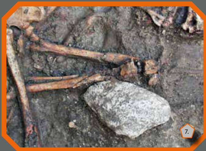
Örlőkővel összetört emberi vázcsontok

A késő rézkor kezdetére (Kr.e. 3700–3600) keltezhető leprás megbetegedések jelentősen módosíthatják a lepra időbeni megjelenéséről szóló korábbi paleoepidemiológiai ismereteinket, és azokat az eredményeket támasztják alá, miszerint a lepra Kelet-Afrikából kiindulva Európán (vagy a Közel-Keleten) keresztül érte el a Távol-Keletet.