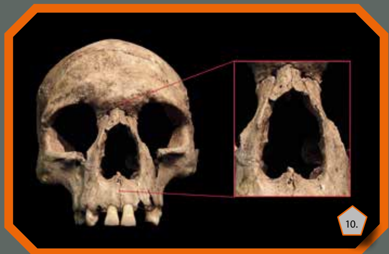
Lepra jelenlétére utaló csontelváltozások az egyik emberi koponyán