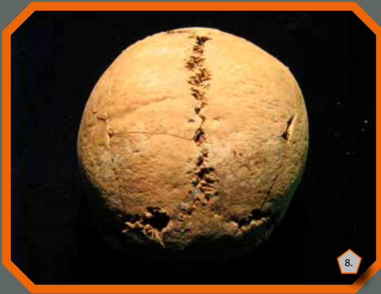
Emberi koponyán megfigyelt gyógyult sérülések nyomai

Az emberi vázakat nem tartalmazó rituális gödrökben végzett áldozati tevékenység „normál” menete az állati húsos vázrészek, illetve (feltételezhetően étellel, itallal megtöltött) edények rendszeres elhelyezése. A régészeti megfigyelések alapján az emberi maradványok bekerülése ugyanakkor a rítusnak egy következő fejlődési fokozata lehet, melynek oka valószínűleg a közösséget ért egyszeri váratlan krízishelyzet. A későbbiek során ezek az elemek egyre inkább beépülhettek a mindennapi rituális cselekvések sorába, erre utal az egyes csontvázak hasonló módon történő feldarabolása is.