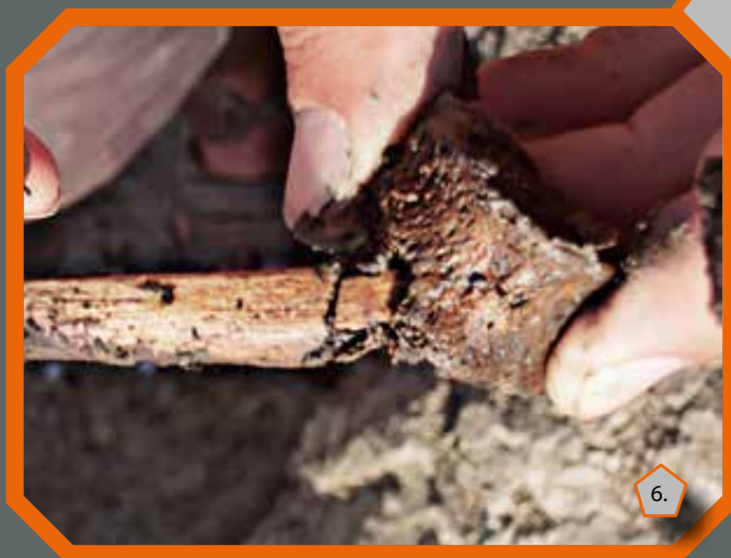
A csigolya szöveti állományába fúródott szárkapocscsont

Mind a feltárt rituális gödrök értelmezése szempontjából, mind általánosabb, történeti embertani szempontból igen fontos egy jellegzetes, öt egyén arckoponyáján megfigyelt elváltozás, mely valószínűleg a mindmáig jelenlevő specifikus fertőző megbetegedés, a lepra jelenlétére utal a rituális gödrökbe helyezett halottak között (10. kép). Bár közvetlen bizonyítékok nem támasztják alá, nem zárható ki az erőszakos cselekmények összefüggése a lepra látványos elváltozásokat okozó külső megjelenésével. Ez az egykori társadalom tagjai számára megmagyarázhatatlan, félelmetes jelenség lehetett, mely mint egy „rituális válasza” ösztönözhette őket.