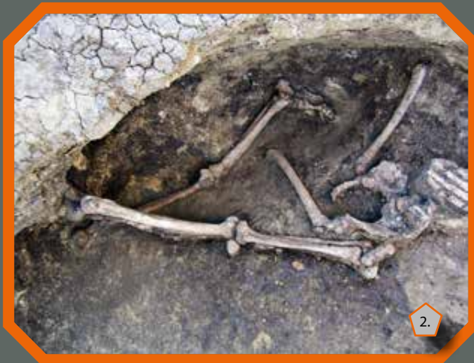
Emberi vázrészek és végtagok anatómiai rendben

A feltárt gödrökből előkerült kerámialeletek stílusjegyei alapján a település a késő rézkor kialakuló szakaszával, a régészeti kutatás által protobolerázi horizont néven elkülönített kulturális egységgel hozható összefüggésbe, mely az abszolút kronológia dátumai szerint a Kr. e. 3700–3500 közötti időszakban terjedt el.