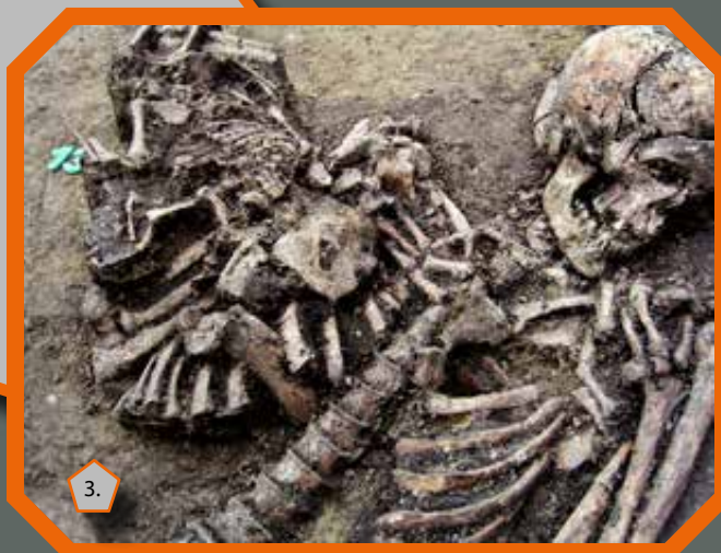
Egy felnőtt nő csecsemőjével együtt eltemetve