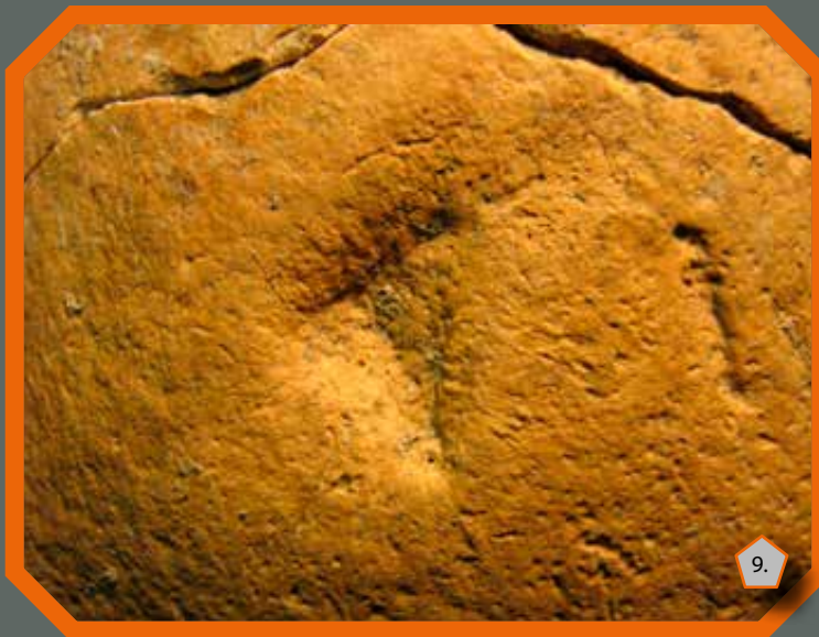
Emberi koponyán megfigyelt, valószínűleg kőbalta által okozott gyógyult sérülés nyoma

egyszerű, a maradványok közvetlenül csak az áldozatokra utalnak, az „elkövetőket” viszont csak cselekedeteik közvetett nyomai alapján tanulmányozhatjuk.