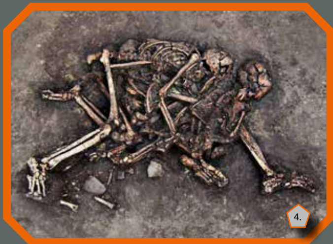
Egy nő és egy kisgyerek csontváza

A jellegzetes háztartási objektumok – tároló és hulladékgyödrök, anyanyerő gödrök, kutak – mellett a terület északi és keleti szélén két, jól elkülöníthető területen, kilenc-kilenc, régészeti szempontból kiemelkedő jelentőségű gödör került elő, melyek mind méretükben, mind belső rétegződésükben eltértek a település többi objektumától. A 3–3,5 méter átmérőjű gödrök mélysége 2 és 4,5 méter között változott.