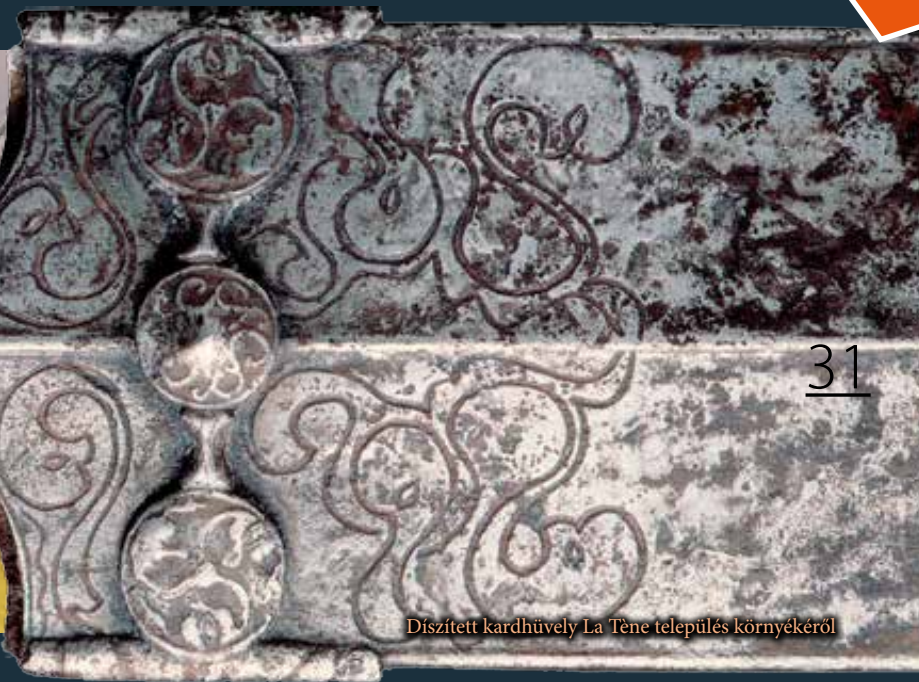
Diszített kardhüvely La Tène település környékéről