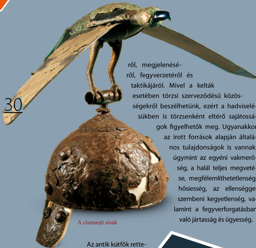
A ciumești sisak

ről, megjelenéséről, fegyverzetéről és taktikájáról. Mivel a kelták esetében törzsi szerveződésű közösségekről beszélhetünk, ezért a hadviselésükben is törzsenként eltérő sajátosságok figyelhetők meg. Ugyanakkor az írott források alapján általános tulajdonságok is vannak, úgymint az egyéni vakmerőség, a halál teljes megvetése, megfélemlíthetlenség, hősiesség, az ellenséggel szembeni kegyetlenség, valamint a fegyverforgatásban való jártasság és ügyesség.