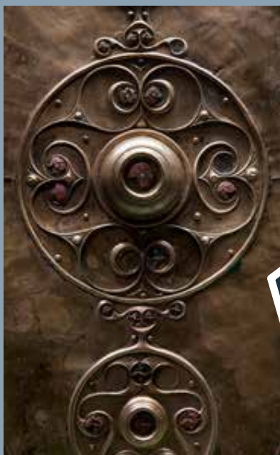
A Temzéből előkerült különleges pajzs részlete (Battersea, Kr. e. 2–1. század)

Ritkaságszámba mentek ugyanakkor a különböző vértetek. A sisakok bronzból és vasból készültek, de fejlődési reprezentáció céljából vagy szakrális (pl. vallási) célokra készítették őket időnként nemesfémből is. A leggyakoribbak az egyszerű kúpos típusok, melyek szinte kizárólag csak a fejtető védelmére szolgáltak. A későbbiek folyamán jelennek meg a tarkó, a homlok és a halánték védelmére is alkalmas sisakok. A test védelmére sodronyinet vagy mellvértet használhattak. De