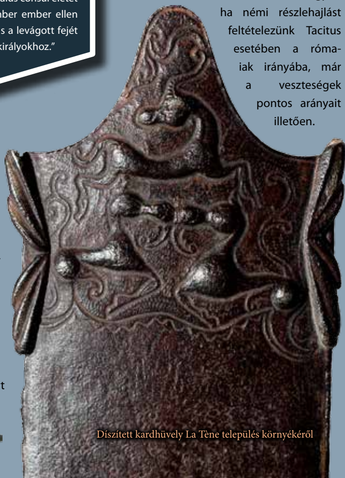
Diszített kardhüvely La Tène település környékéről

A kelták gyalogos és lovas seregstestei mellett komoly szerep jutott a harci szekereknek is. E szekerek régészeti rekonstrukciójának az írott forrásokkal történő összevetése érdekes betekintést nyújt e különleges fegyvernem harctéri felhasználásba is. A csaták során a főerők kibontakozása előtt a feladatuk az ellenség folyamatos zaklatása volt, ezzel akadályozva a csapatok hadrendjének kialakulását és mozgását, később gyakorta az ellenség hátába kerülve keltettek zavart, győzelem esetén pedig a menekülőket üldözték. Ismereteink szerint utoljára Kr. u. 84-ben a Mons Graupiusnál zajlott ütközetben vetették be e harci szekereket a 'kaledóniai' kelták. Az esetről beszámoló római történetíró, Tacitus szerint a kb. harmincezer főt számláló kelta sereg tízezer veszteséget szenvedett el, s bár a rómaiak létszáma jóval kisebb volt, mégis mindössze 360 főt veszítettek. Talán nem tévedünk nagyot, ha némi részlehlást feltételezünk Tacitus esetében a rómaiak irányába, már a veszteségek pontos arányait illetően.