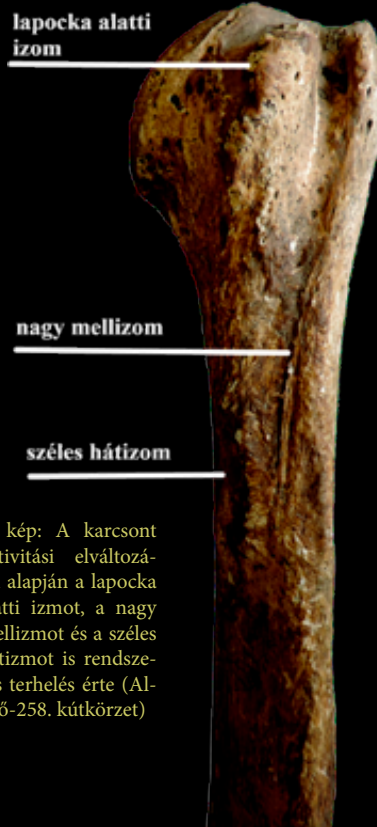
5. kép: A karcsont aktivitási elváltozásai alapján a lapocka alatti izmot, a nagy mellizmot és a széles hátizmot is rendszeres terhelés érte (Algyő-258. kútkörzet)

A rendszeres edzés, terhelés egyébként alapvetően pozitív hatást gyakorol a szervezetre, de a gyakori túlerőltetés következtében kóros folyamatok megindulhatnak, elsősorban az ízületi régiókban.