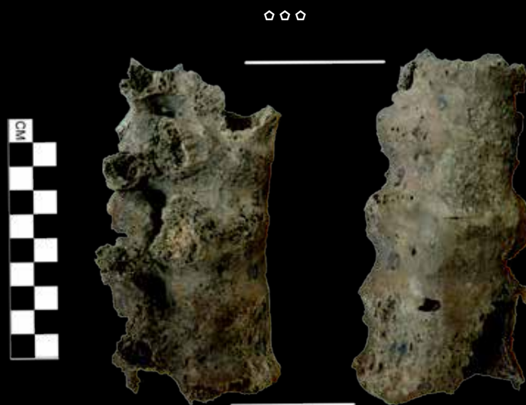
7. kép: A hátcsigolyák ilyen fokú összezsugorodása nagyban korlátozta a mozgás lehetőségeit (Algyő-258. kútkörzet)

A háborúk és a harcosok témaköre a régészeti kutatások egyik leglátványosabb szeletét képezi. Kutatásuk azonban nem könnyű feladat, több tudományág együttes vizsgálati módszerei és szempontjai szükségesek hozzá. Annak megállapítása tehát, hogy az adott sírban elhunyt személy valóban harcos volt-e életében, teljes bizonyossággal csak nagyon ritkán sikerülhet. Éppen ezért érdemes mindig kritikával kezelni tehát azokat a figyelemfelkeltő híradásokat, miszerint „régészek harcos sírját tárták fel” itt vagy ott.