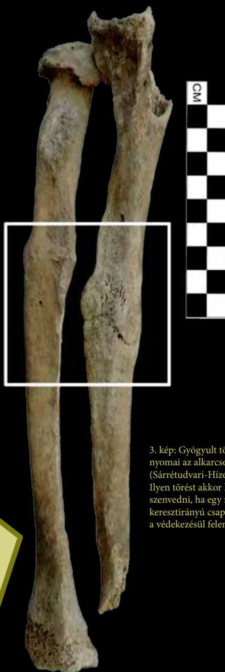
3. kép: Gyógyult törés nyomai az alkarcsontokon (Sárrétudvari-Hízó föld). Ilyen törést akkor lehet elszenvedni, ha egy nagy erejű, keresztirányú csapás éri a védekezéstől felemelt kart

A katonák esetében a rendszeres terhelést jelentő gyakorlatozás, edzés és a gyakori harci cselekmények következtében a különböző aktivitási elváltozások nagyobb arányban jelentkezhetnek, vagy éppen az adott fegyver egyedi használati technikája révén a csontváz speciális részein jelenhetnek meg. Az erőteljes kifejezettséget, felületi barázdálódást mutató enthesisek alapján pedig visszakövethető, hogy mely izmokat érte