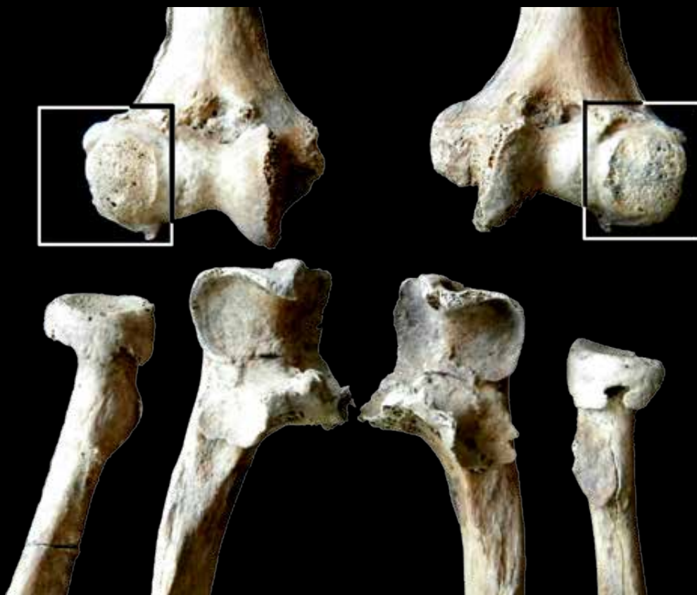
6. kép: Mindkét könyöknél az erős ízületi porcokpással járó csontfelszín-átalakulás figyelhető meg az orsócsont és a karcsont kapcsolódásánál. Az illető csak nagy fájdalmak árán tudta behajlítani a karjait (Sárrétudvari-Hízőföld)

vékenységek végzésére (7. kép). Esetükben, ha fegyvermelléklet került elő a sírból, akkor joggal gyanakodhatunk arra, hogy a tárgyak sírba tételének valamilyen egyéb jelentéstartalma is lehetett, például óvó, bajelhárító szándék.