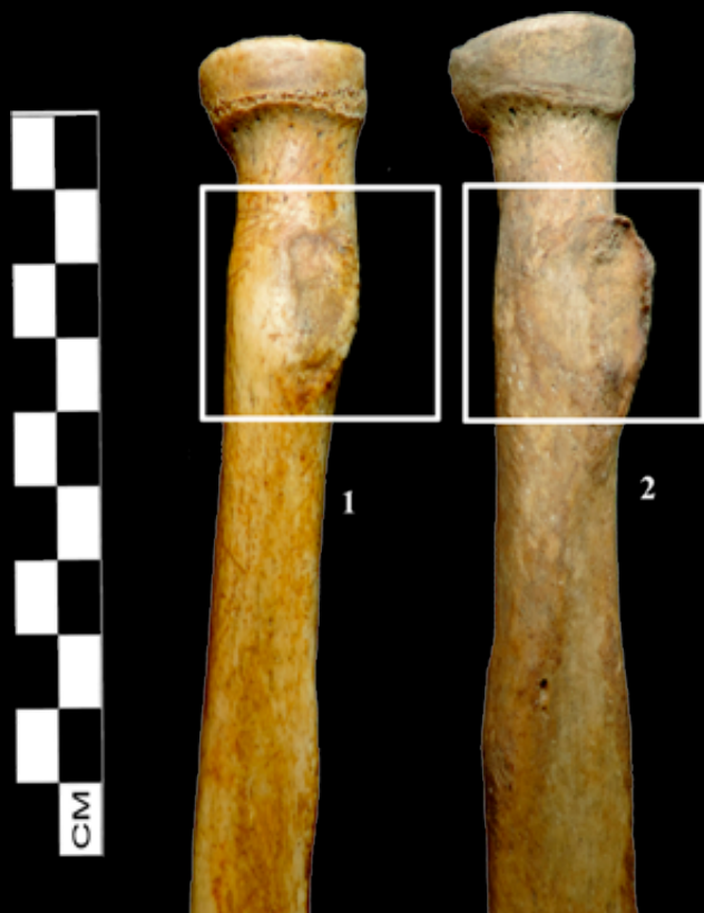
2. kép: Normál felszínt (1) és fejlett csontbarázdát (2) mutató enthesisek az orsócsonton a kétféjű karizom tapadásánál (1. Bácsalmás-Homokbánya; 2. Sárrétudvari-Hízó föld)

metést végzők a hitvilágukból eredő szokásaik vagy éppen aktuális anyagi helyzetük miatt mégsem helyeztek semmilyen fegyvert a sírjába. Természetesen azt a lehetőséget sem szabad elvetnünk, hogy előfordulhatott olyan eset is, hogy valaki ugyan nem tartozott a katonáskodó réteghez, de hatalmi szimbólumként vagy éppen hitvilági okokból (pl. babonás szokások) mégis került fegyver a sírjába.