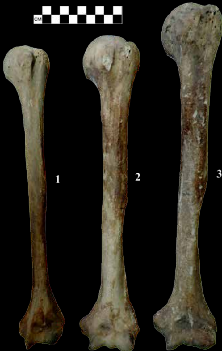
4. kép: Látványos robuszticitásbeli különbségeket mutató karcsontok (1. Orosháza-Bónum II. Téglagyár; 2. Sárrétudvari-Hízóföld; 3. Algyő-258. kútkörzet).

rendszeres fizikai terhelés (5. kép). Az érintett izmok funkciójának ismeretében megtudhatjuk, hogy milyen mozgásformák voltak a dominánsak az adott egyén életében, amiből ideális esetben következtetni lehet magára az aktivitásra is. Természetesen a gyakorlatban bonyolultabb a helyzet, hiszen számos dolog befolyásolhatja az enthesisek elváltozásainak kialakulását (pl. tápláltsági szint, életkor, hormonális zavarok), másfelől pedig nagyon sok olyan aktivitás létezik, ami ugyanazokat az izomcsoportokat terheli, mint a fenti, harchoz kapcsolódó tevékenységek, ebből adódóan pedig többnyire nem lehet egyértelműen egy adott tevékenységre szűkíteni a kört. Egyes esetekben viszont a rendszeresen ismétlődő mozgásformák egyedi, jól körülhatárolható elváltozásokat eredményeznek. Ilyen például a törzset és a felső végtagokat nagy terhelésnek kitevő íjászat, vagy a törzset és az alsó végtagokat erősen igénybevevő lovaglás. Komplexitásuk miatt a különböző íjfestési módok és lovagló technikák eltérően hathatnak a szervezetre, ebből adódóan ideális esetben nem csupán a cselekvés életvitelszerű folytatását lehet megállapítani, de finomabb részletekre is fény derülhet.