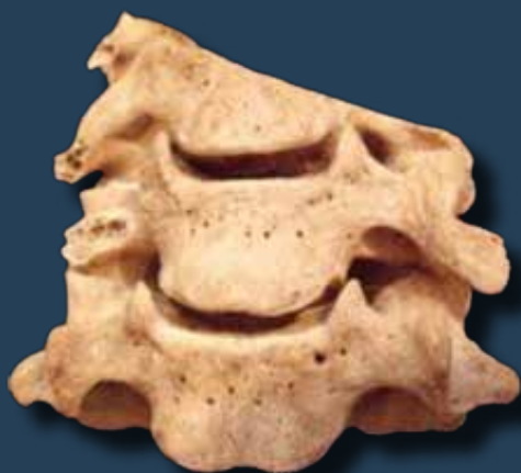
Lefejezés nyoma a nyakcsigolyán

Az antropológiai vizsgálatok megállapították, hogy a koponyákon és a végtagokon megfigyelt vágások egy része minden bizonnyal fokos élettől, egy esetben pedig a fokos „boldogabbik felétől”, azaz a kalapácsszerű végétől származik. A sérülések többi részét valószínűleg szablyák okozták, de a viszonylag egyenes vonalú hosszú vágások alapján az sem kizárt, hogy ezeket a nyugati zsoldosok által használt egyenes kardok (spádék) okozták. Ezekkel a szablyákkal és kardokkal végezték tehát a lefejezéseket is.