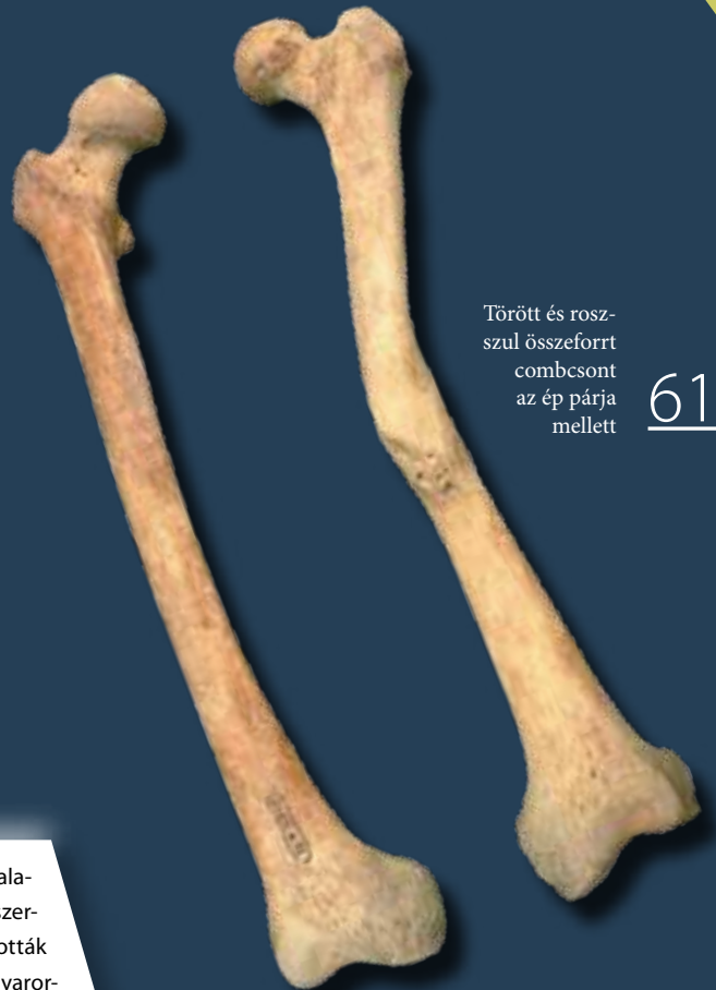
Törött és rosszul összeforrt combsont az ép párja mellett

A 16–17. században jelentős hadászati átalakulás zajlott Európában. A feudális hadseregvezetést az állandó zsoldos kötelékek váltották fel. A törökökkel vívott harcok során a magyarországi katonai rendszer is átalakult, de nem az európai utat követte, hanem alkalmazkodott az oszmánok harcmódorához. A magyar haderő hagyományosan lovasságközpontú volt. Már a 15. század végétől törvény mondta ki, hogy a bandériumok fele páncélos nehéz lovas, a másik fele huszár legyen. Majd a mohácsi csatától kezdve fokozatosan áttolódott a súlypont a könnyűlovasságra. A portyázó hadviseléshez igazodva a bandériális haderő is megszűnt, helyét az állandó katonaság vette át, a hivatásszerűen szolgáló hadinép, az időlegesen felfogadott zsoldosok. A végvári katonaság nagyrészt azokból került ki, akiknek a lakhelyét elpusztították a harcokban, de sokan menekültek az örökös jobbágyrendszer szorításából is.