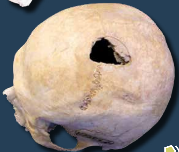
Fokos nyoma a koponyán