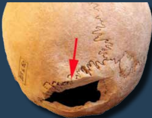
Vágás nyoma a koponyán