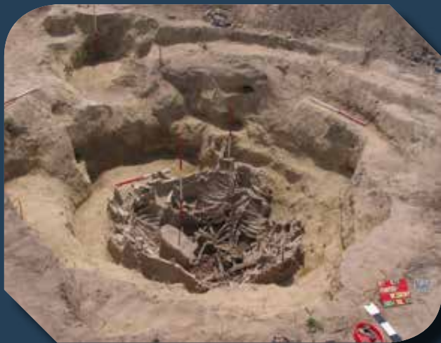
Tömegsír a lelőhelyről