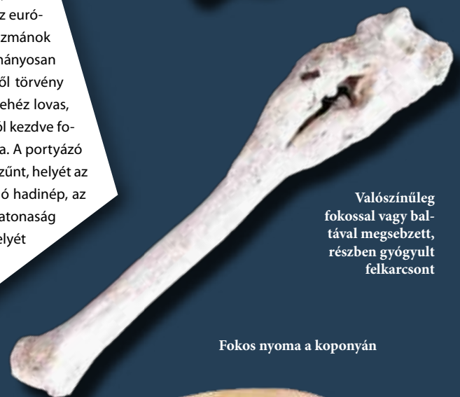
Valószínűleg fokossal vagy bal-tával megsebzett, részben gyógyult felkarcsont