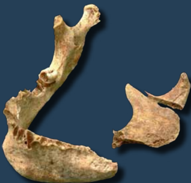
Pontatlanul kivitelezett lefejezés vágásnyoma az állkapcszon