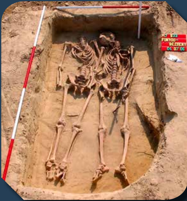
Kettős sír a lelőhelyről

Az erőszakos halál tehát sok esetben egyértelműen rekonstruálható pl. a jobb kéz egy vágással való amputációja formájában, amit nem kísért gyógyulás, de gyakran a koponyán találtak nem gyógyult vágások vagy ütések nyomait. A lefejezés gyakran rosszul sikerült és az állkapocs, az arckoponya területét érintette, ami arra utal, hogy a lefejezés harctéri körülmények között történhetett. Ugyanakkor volt olyan elhunyt is, akinek a csigolyái között puskagolyó volt, de a lövés csontsérülés nélkül akadt el a lágyszövetekben.