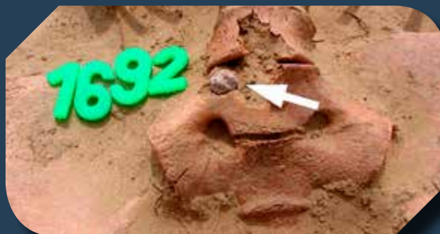
Puskagolyó az egyik vész csigolyái között