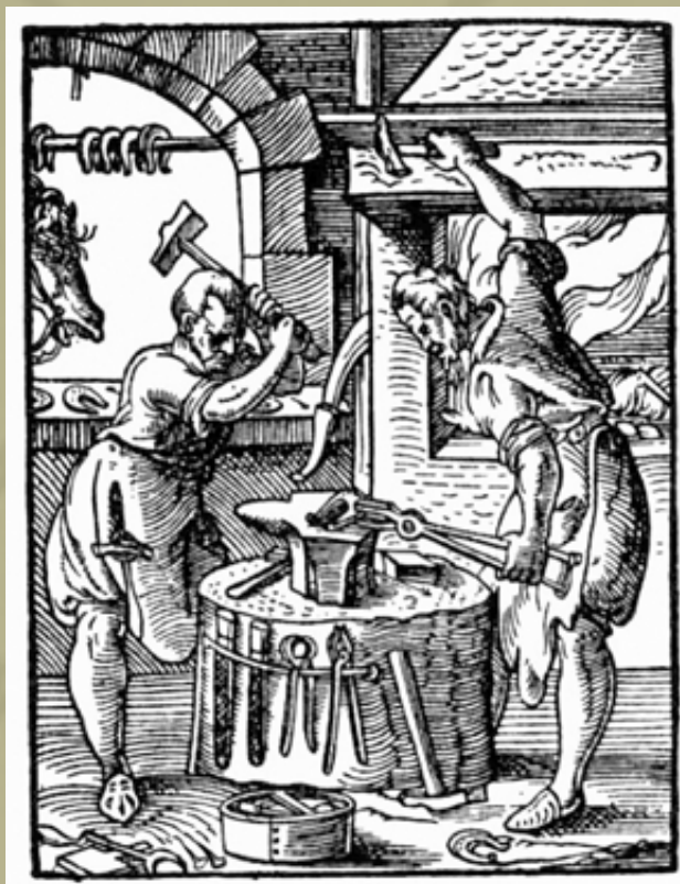
Kovácsok Jost Amman fametszetén (1568)

A legkorábbi veret ebből az időszakból II. Lajos (1516–1526) 1526-ban vert denárja, míg a legkésőbbiek Rudolf pénzei, melyek közül az egyik az 1596-os évszám látható. A denárok között I. Ferdinánd (1531–1564) (24 db), Miksa (1564–1576) (9 db) és Rudolf (1576–1608) (22 db) veretei fordulnak elő. Ezekon kívül lengyel és porosz garasokat és félgarasokat találunk még a pénzek között. A 16. századi veretek között 20 db hamis denár is volt!