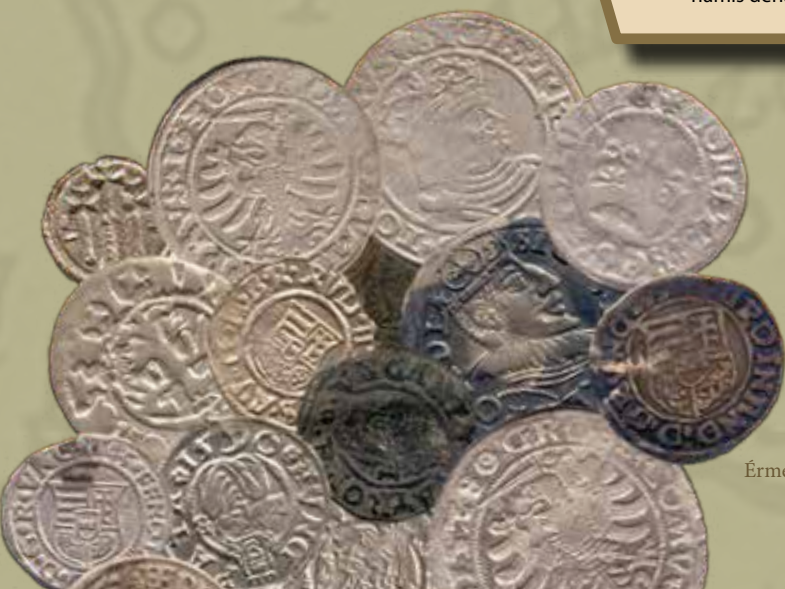
Érmék a depó környezetéből