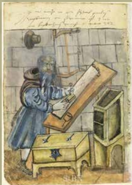
Ládát készítő asztalos egy 15–16. század folyamán összeállított német könyvben