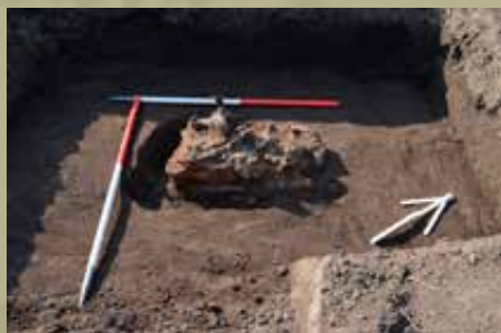
A láda formájához idomult vastömb