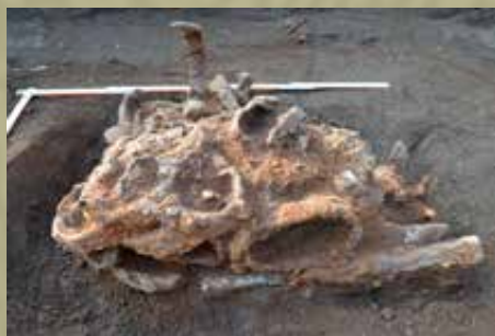
Különböző vastárgyak egy tömbben