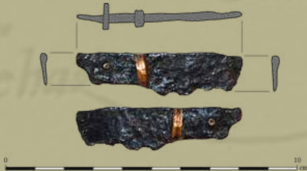
Vaskés töredéke rézdíszítéssel

A vasdepóból előkerült ösztöke pedig a földművelés jelenlétére utal. Az ösztöke ugyanis az eke járulékos részét képezi, feladata az eke és a csoroszllya tisztítása a ráragadt földtől és növényi maradványoktól. De ezen eszközre utal az „öztö-