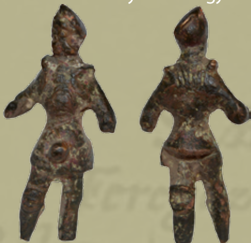
Landsknechtet formáló bronzfigura