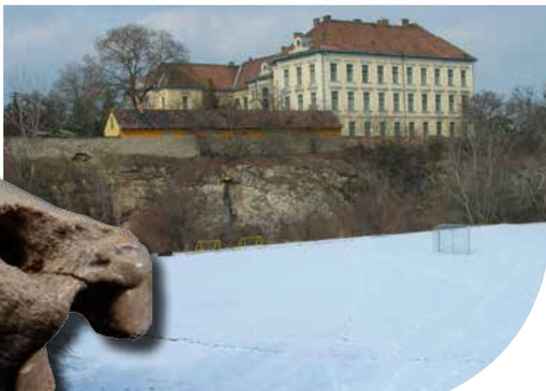
Csontsíp vagy hiéna harapása? Rénszarvasujjperc a Kiskevélyi-barlangból