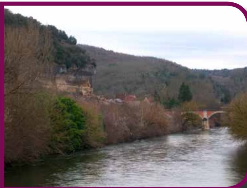
A Dordogne Les Eyziesnél a híres sziklaereszekkel