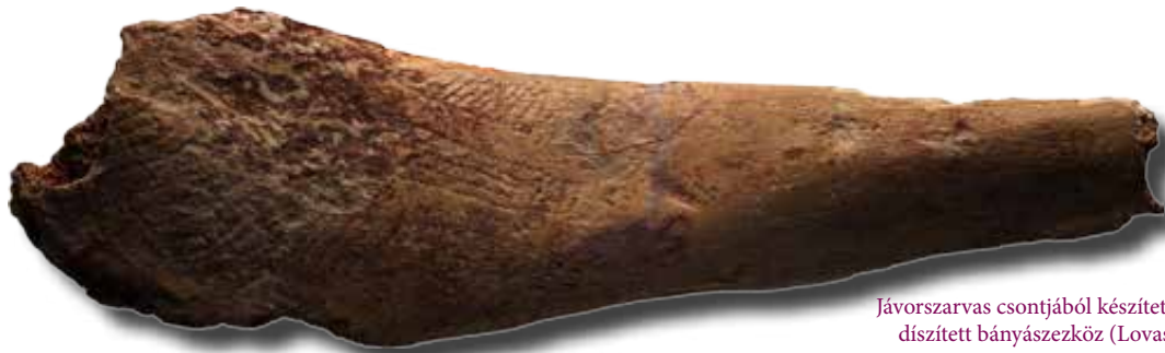
Jávorszarvas csontjából készített, díszített bányászkező (Lovas)

Hasonlóan zavarba ejtő az Erd mellett a hatvanas években feltárt és a radiokarbon adatok alapján mintegy 40 ezer éves Neander-völgyi településén előkerült lapos kavics, melyen olyan párhuzamos vonalak látszanak, melyek bizonyosan nem természetes eredetűek. Ez esetben is csak annyit állíthatunk biztosan, hogy általunk nyilvánvalónak tekintett gyakorlati szempontok nem tették volna szükségesszerűvé a kemény kvarcit kavics felületének bekarcolását, illetve a leleten ez esetben sem lehet felfedezni semmiféle használat okozta nyomot.