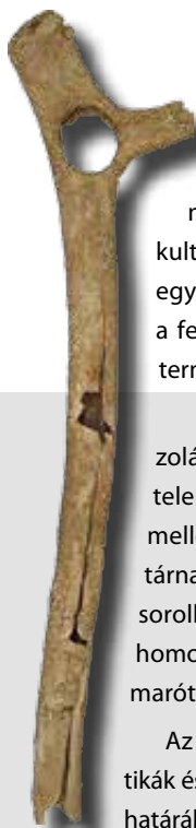
18 ezer éves „kommandóbot”, Ságvár-Lyukás-domb

szágról ennél kissé fiatalabb, mintegy 30 ezer éves rétegben került elő az a lelet, melyet az egyik legkorábbi európai hangszerként azonosítottak. A fiatal barlangi medve combcsontjából kialakított fuvolával vagy furulyával a hatvan ével ezelőtti vizsgálatok szerint öt különböző hangot lehetett megszólaltatni. Az istállóskői furulyát akár szertartások során is alkalmazhatták, de erre tényleges adatokkal nem rendelkezünk. A hegység belsejében, eldugott helyen, nagy magasságban fekvő barlang rendkívül szórványos felső kultúrreége valójában minden bizonnyal igen rövid, talán csak egy-két éjszakát kitevő megtelepedések nyomát őrizte meg, míg a feltárt állatcsontok a barlangi medvék átteleléséhez köthető, természetes felhalmozódás eredményei voltak.