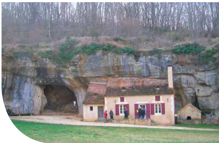
Díszített barlang bejárata a Dordogne völgyében (Franciaország)

A paleolitikum vagy őskőkor az emberiség történetének leghosszabb időszaka. Kezdetét az első, előemberek által készített kőeszközökkel, jelenleg a 3,3 millió éves kelet-afrikai leletek jelzik, míg végét a földtörténeti pleisztocén vége jelöli ki, így az európai kontinensen több mint másfél millió, a Kárpát-medencében több mint 700 ezer, a mai Magyarországon 350 ezer éves időszakról beszélhetünk.