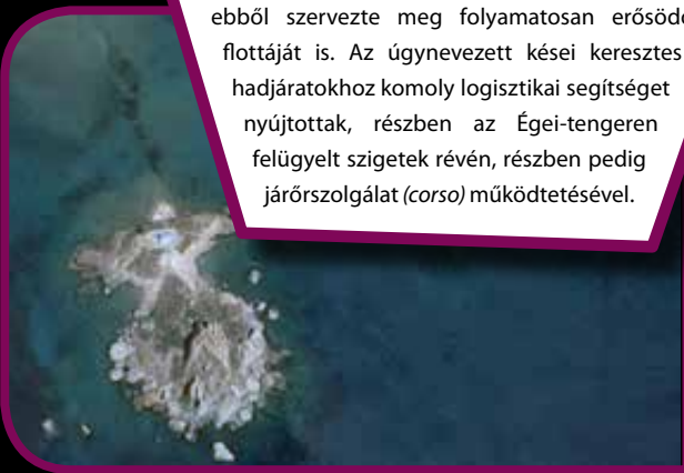
Palaiokasztro műhaldképe

A johanniták Keresztelő Szent János lovagjai voltak. A 11. század végéig a zárandokok istápolására alakult szerzetesrend, amely néhány évtized alatt militarizálódott, és a Szentföld fegyveres védelmét segítette számos eszközzel. Anyagi bázisát az európai rendtartományok adójából teremtette elő, és a Szentföld 1291-es elését követően ebből szervezte meg folyamatosan erősödő flottáját is. Az úgynevezett kései kereszties hadjáratokhoz komoly logisztikai segítséget nyújtottak, részben az Égei-tengeren felügyelt szigetek révén, részben pedig járőrszolgálat ( corso ) működtetésével.