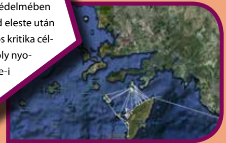
A viglák által kialakított „vivő” rendszer láthatóan redundáns volt, azaz két pont között több úton is felépíthető volt a kód útja

A templomosok rendje Clairvaux-i Szent Bernát támogatásával 1119/20-ban alapított lovagrend, amely a Szentföld, illetve az odaérkező zárandokok fegyveres védelmére szerveződött. Elnevezésük Salamon egykori templomának (vélt) helyén létrejött központjukból alakult ki: ők voltak Salamon templomának szegény lovagjai. A fegyveres harcokban, illetve a szentföldi várak védelmében komoly szerepet vállaló testület a Szentföld eleste után nem tudta újrafogalmazni céljait, így számos kritika célpontjaként végül IV. (Szép) Fülöp komoly nyomására V. Kelemen pápa a vienne-i zsinaton (1311–1312) felszolta a rendet.