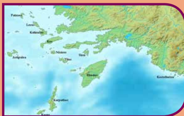
A Dodekanészosz az Égei-tengeren. A johanniták által elfoglalt és többnyire helyőrséggel ellátott szigetek, amelyek között kialakították az információs csatornákat

A johanniták egyik ábrázolása. A lázadó török Dzsem herceg, bátyja II. Bajezid elől Rodoszon, a johannitáknál talál menedékre. A nagymester azonban később kiegészített a szultánnal, és fogságban tartotta a herceget annak haláláig (Guillaume Caoursin: De Obsidione Rhodie Urbis Descriptio: De casu regis Zyzymy . Ulm: Ioannes Reger, 1496.)