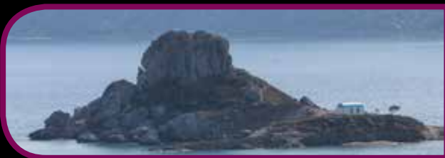
Rendszeresen hoztak létre a part közelében kisebb szigeteken, szirteken viglak kat, amelyek a part menti magaslati pontokról vették át a jelzéseket. Palaiokasztro, Kósz, Görögország

A templomosok rendje Clairvaux-i Szent Bernát támogatásával 1119/20-ban alapított lovagrend, amely a Szentföld, illetve az odaérkező zárandokok fegyveres védelmére szerveződött. Elnevezésük Salamon egykori templomának (vélt) helyén létrejött központjukból alakult ki: ők voltak Salamon templomának szegény lovagjai. A fegyveres harcokban, illetve a szentföldi várak védelmében komoly szerepet vállaló testület a Szentföld eleste után nem tudta újrafogalmazni céljait, így számos kritika célpontjaként végül IV. (Szép) Fülöp komoly nyomására V. Kelemen pápa a vienne-i zsinaton (1311–1312) felszolta a rendet.