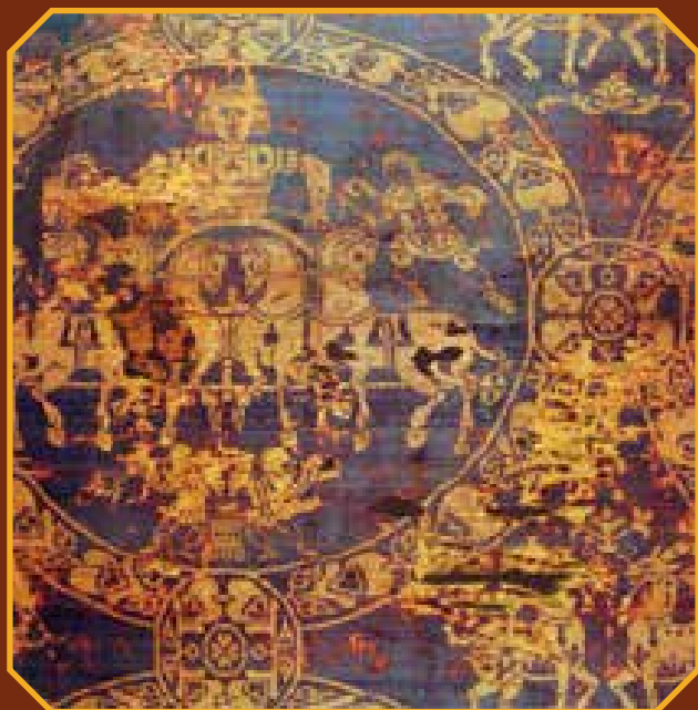
Nagy Károly 814-ben Bizáncban készült selyemleple kvadriga, azaz négy ló vontatta kocsi ábrázolásával