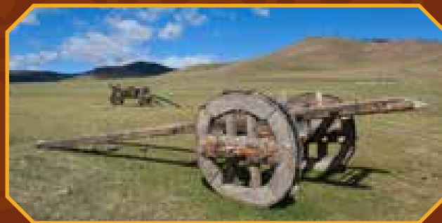
Máig használt jellegzetes kétkerekű szállítóeszköz Mongóliában

egyetlenegy fém alkatrész felhasználása nélkül készültek, sőt készülnek a mai napig is (úgy a kerekek, mint a „kocsiszekrény”). A Kárpát-medence éghajlati és talajviszonyai között a fából készült tárgyak, így a feltehetően ugyancsak kizárólag fa alkatrészekből konstruált kocsik ép állapotban történő előkerülésének esélye tehát roppant csekély. Így lényegében az lenne a meglepő, ha régészeink már nagyobb számban találtak volna az avarokhoz kapcsolható kocsi- vagy szekér-