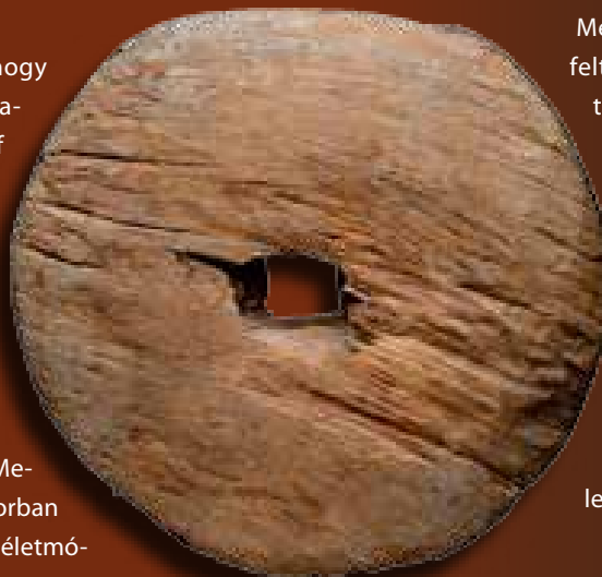
Egyetlen fából kifaragott kocsikerék

Menandrosz fenti passzusa alapján feltételezhetjük, hogy az Erik dux ál- tal elrabolt szekerek az avar kagáni háztartás, köztük a kincstár tárgyait, eszközeit tartalmazhatták, s az sem kizárt, hogy ezek folyama- tos jelleggel a kagáni lakóhely épületei (jurtái?) között álltak, s a rablóportyán részt vevőknek az örök legyőzése után szinte más dolga nem is volt, mint be- fogni az igás állatokat, és a lehető leggyorsabban távozni a zsákmánnyal.