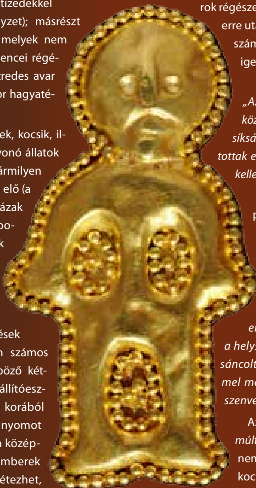
Emberalakot formázó korai avar kori aranytárgy egy rákóczifalvai sírból

Az egyik jóval későbbi forrásunk, a Régmúlt idők elbeszélése című orosz öskronika nem fest éppen hízelgő képet az avarokról, kocsijaik emlegetése kapcsán: „Ezek az avarok