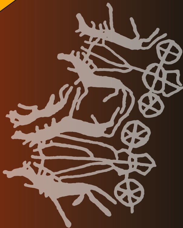
Mongóliai sziklarajz kétkerekű kocsik ábrázolásával