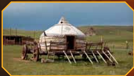
„Nomád lakókocsi”. Az ökrök vontatta nagy méretű kocsi egy teljes jurtát képes szállítani