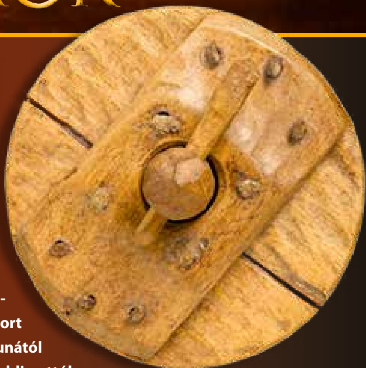
Kizárólag fa alkatrészekből konstruált kocsikerék

Az Úr 567–568. évében rendkívüli népmozgások zajlottak le a Kárpát-medencében. A vidéket a korábbi évtizedekben alapvetően két germán nyelvű csoport tartotta a kezében. Míg a Dunától keletre zömmel a gepidák, addig attól nyugatra zömmel a longobárdok szállásterületei húzódtak. A két nép gyilkos háborújába a messzi, keleti pusztákról ideérkező nomád avarok is bekapcsolódtak a longobárdok oldalán, ezzel el is döntve a háború kimenetelét. A longobárdok azonban hiába szerezték meg így a győzelmet, nem várták meg a minden korábbinál harciasabbnak tűnő új szomszédok térfoglalását, még abban az évben elhagyták a Kárpát-medencét, és Észak-Itáliába vonultak. Az avarok és a korábban nekik alávetett, a Kárpát-medencétől keletre meghódított népek, néptöredékek tehát birtokba vehették a térség stratégiai fontos pontjait. Arról azonban, hogy ez a beköltözés miképpen is zajlott le, a korszakról beszámoló, zömében bizánci görög forrásaink sajnos hallgatnak. Erről pedig a több mint 250 évig tartó folyamatos Kárpát-medencei avar uralom egyébként valóban rendkívül gazdag régészeti hagyatéka is alig valamit árul el nekünk.