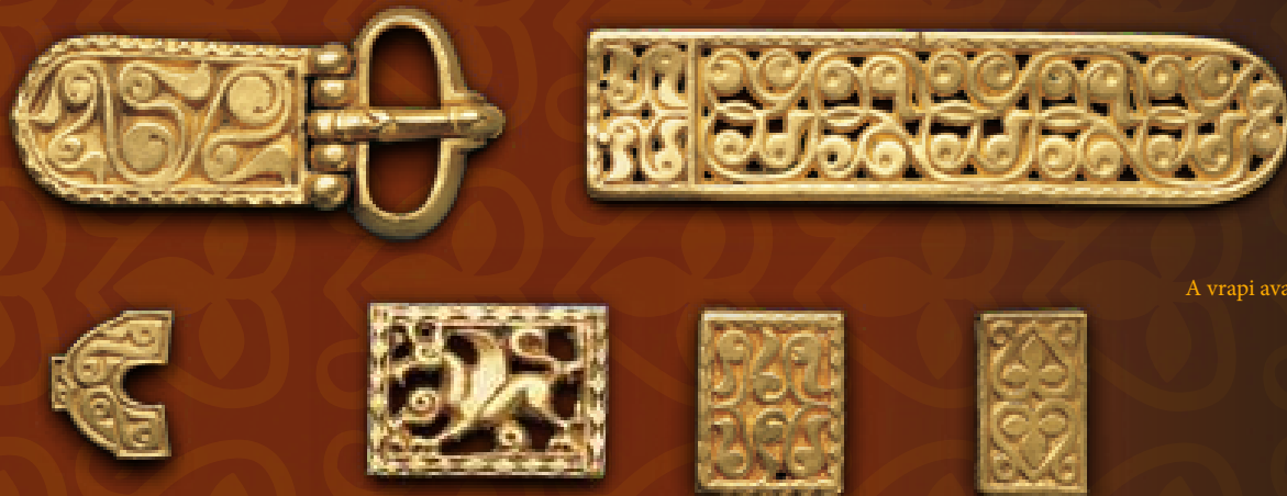
A vrapi avar kori leletegyüttes

A fentiek alapján feltételezhető, hogy az avaroknál, keletről történő 6. századi elvándorlásuktól kezdődően egészen a 8–9. század fordulójáig folyamatosan használatban volt legalább egy olyan szekér- vagy kocsi típus, amelyet még a 20. században is dokumentáltak Mongóliában, de ami egyúttal Közép-Ázsiában, sőt Magyarországon is egészen a 19. századig – ugyan technikailag eltérő változatokban – használatban volt. Ennek a kocsinak az alapja egy tengelyre egymással párhuzamosan helyezett két rúd volt. Ezek közé fogták a vontató állatot (normál esetben mindig egyet). A tengely fölött alakították ki a volta-képpeni kocsi testét, ami lehet egy egyszerű rács vagy annak különféle módon befont, belécezett, illetve valamilyen módon fedett változata. Ez olykor teljesen zárt ládává, szekrénné alakulhatott, amelyben zárható módon voltak tárolhatóak a benne elhelyezett vagyontárgyak. A kocsi kereke Mongóliában keresztgerendás, Közép-Ázsiában, illetve a Kárpát-medencében küllös volt. Az előbbi esetben viszonylag alacsony a tengelymagasság (de az igavonó állatok is kisebbek), az utóbbiak kifejezetten magas tengelyűek.