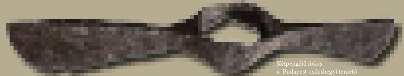
Kétpengéjű fók a Budapest-csúcshegyi temető 2. sírjából

A 10. századi magyar fegyverzet megismerésének legfontosabb forrásbázisát természetesen a korszak sírjai nyújtják. Napjainkra megközelítően ezer, különböző típusú fegyvert tartalmazó