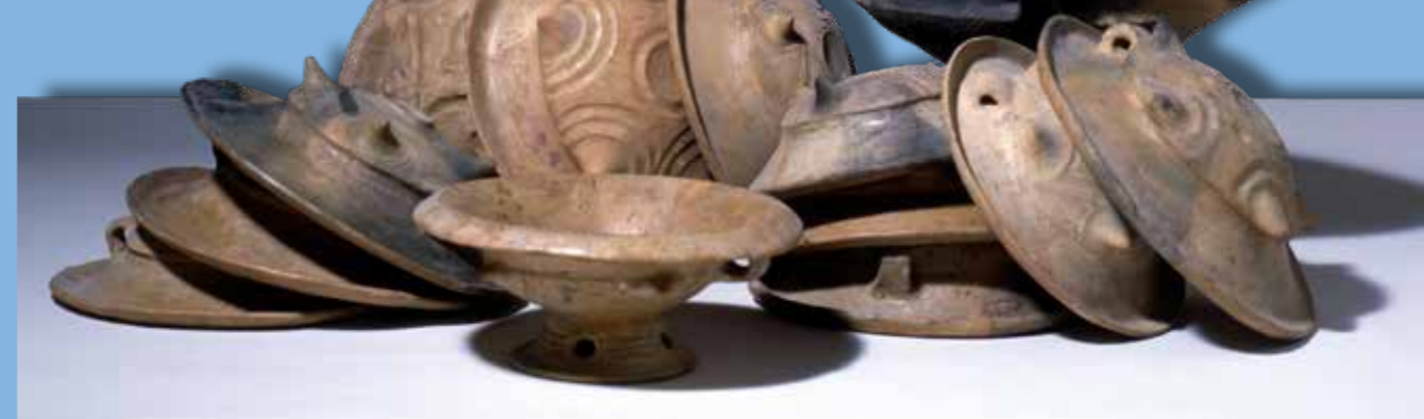
Tálak a 2. szint 1. házából

A tell rétegsorának kutatása után kilenc évvel, 2004-ben, lehetőségünk nyílt a sáncárok részleges átvágására, s ezzel bizonyítást nyert az erősítésnek a telep alapításával egyidejű kiépítése. Ezzel a védelmi óvintézkedéssel együtt járt azonban, hogy a házakkal beépíthető területet a továbbiakban nem lehetett bővíteni, a „város” beosztását tehát előre meg kellett tervezni – nem kezdhetett ki-ki házat építeni, éppen ott, ahol a kedve tartotta. Az itt élt közösség szervezettségét a településtervezés szükségessége kétségtelenné teszi, de nem kevesebb irányítást feltételez a 4 méter mély, s mintegy 8 méter széles sáncárok kiásásával járó földmunka megszervezése vagy a telep életében mindvégig működő, vízzel teli sáncárok karbantartása.