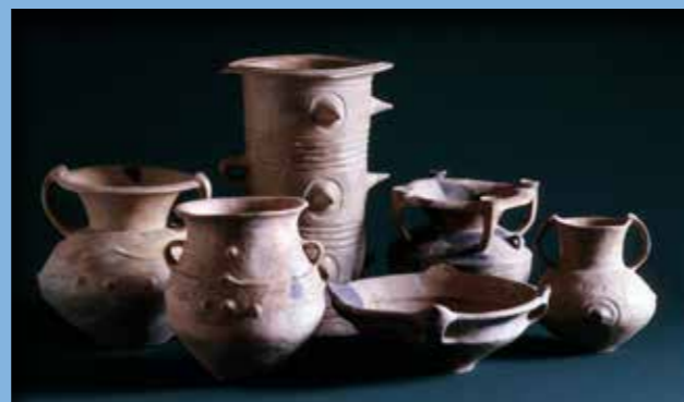
Díszedények a 2. szint 1. házából