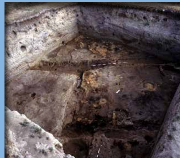
A 7. szint képe

A „vár” ilyen fokú beépítettségében, szigorú szabályosságában a maximális helykihasználásra való törekvés tükröződik, azaz a nyilvánvaló céllal, hogy e sáncárokrendszerrel védett magaslattal a lehető legtöbb ember befogadására legyen alkalmas. Ez a tény egyúttal azt is valószínűsíti, hogy az erősítés a telep alapítását követően hamarosan – illetve azzal egy időben – elkészült. Erre a következtetésre éppen a házsűrűség alapján jutottunk – mi más indokolná egyébként ezt a zsúfoltságot.