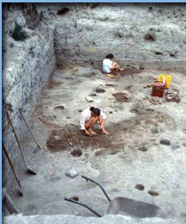
A 6. szint kézi bontása

Tűzvész nyomait azonban nemcsak a 2. szint feltárasakor tapasztaltuk. A 11 települési szint közül nyolc esetben a házak tűzben semmisültek meg. Mivel emberi maradványokat, elégett áldozatokat sem itt, sem más telleken nem találtunk, az időről időre fellángoló tüzet ezért nem véletlen balesetnek, hanem szándékos rituális cselekedetnek tekinthetjük.