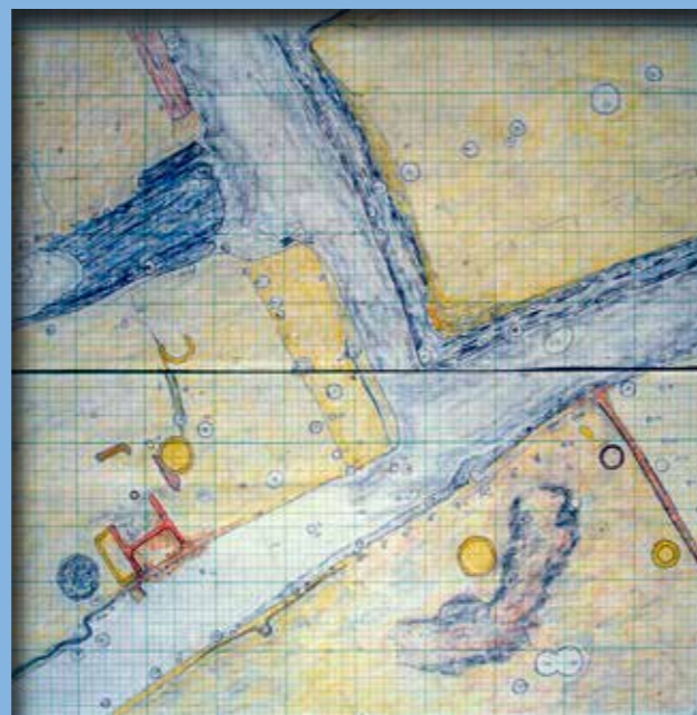
A 10. szint ásatási felszínrajza

tartamára érvényes volt. A rétegről rétegre haladó feltárás alapján tanúi lehettünk a telep rendszeres megújulásának, rekonstruálhattuk, hogy miképp is épültek fel időről időre az új házak a régiek romjain. Szorosan egymás mellett (50–80 cm széles sáktorokkal elválasztva), sakkáblaszzerű elrendezésben sorakoztak a házak a telep korai időszakában, valamivel később kissé távolabb helyezkedtek el egymástól (1,5–2 méter széles utcákkal) a felsőbb szintekben, de az esetek többségében újra meg újra ugyanazon a helyen épültek újjá. A házsűrűség a legalsó, 11. szintben még eltér a későbbiekétől: itt csak egyetlen épület részlete került elő, talán a kis létszámú „elő-őr” által emelt kevés lakóházak egyike.