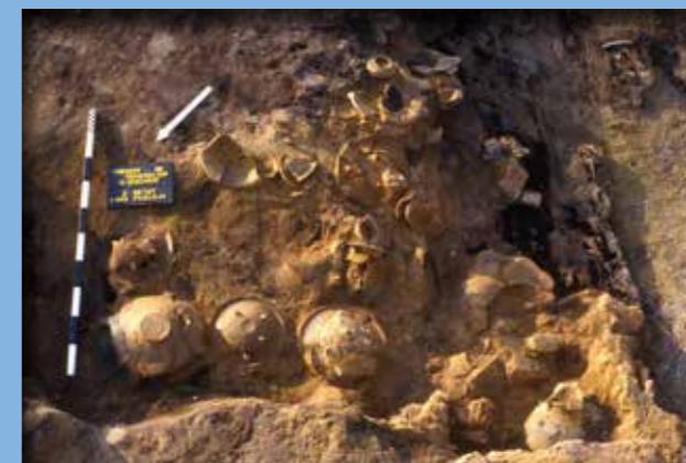
Padlóra borult polc a 2. szint 1. házában

Az ásatás adatai alapján a telep teljes rétegsora a bronzkorból származik, élettartama a Kr. e. 2000–1600 közötti időszakra tehető. A telep alapítása a kora bronzkorban történt, ezt