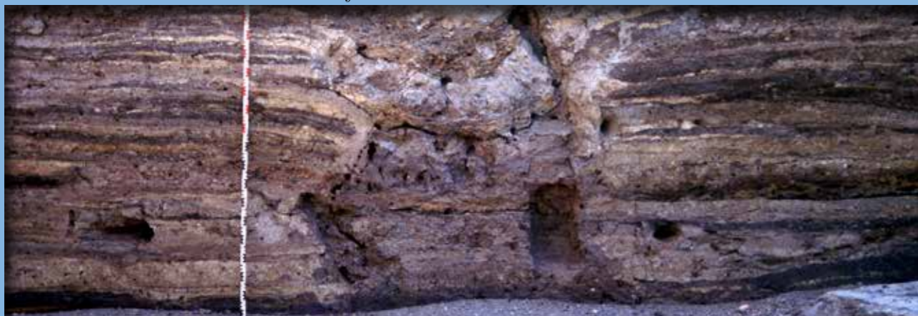
A kora bronzkori rétegek metszete: padlószélek és a közöttük lévő utca

CS aknem negyven éve annak, hogy régész kollégánk, Makkay János, az MTA Régészeti Intézetének nemzetközi hírű munkatársa, a Békés megyei régészeti topográfia munkálatai közben felfedezte a korábban régész által nem kutatott bronzkori tellt, a túrkevei Terehalmot, és a szolnoki múzeumba látogatva felhívta rá a figyelmünket.