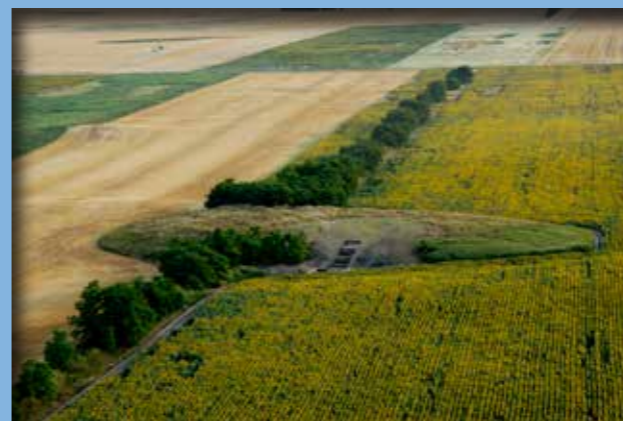
Tell telep a magasból

Mindezen intenzív telepjelenségek ellenére Túrkeve-Terehalom korábban valahogy elkerülte a régészek figyelmét, s bár kíváncsiskodók, kincskeresők újra meg újra ásót ragadtak, mégis, amikor a feltárást elkezdtük, a domb lenyűgözően érintetlennek látszott. Ásatási szelvényünket a tell fennsíkjának legmagasabb részén, a háromszögletes ponthoz közel jelöltük ki. Innen indultunk le a mélybe, rétegről rétegre, mind korábbi és korábbi időkbe jutva ezáltal.