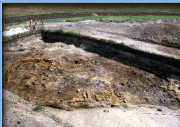
A 2. szint 1. ház padlója

Az ásatás alapján arra lehetett végül következtetni, hogy a műszeres felmérések által kimutatott házsűrűség a telep teljes idő-