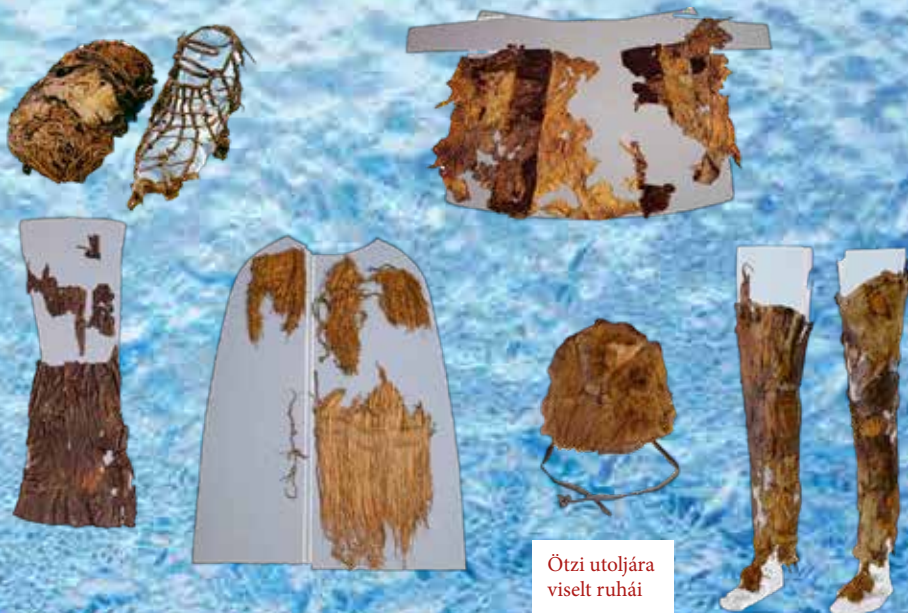
Ötzi utoljára viselt ruhái