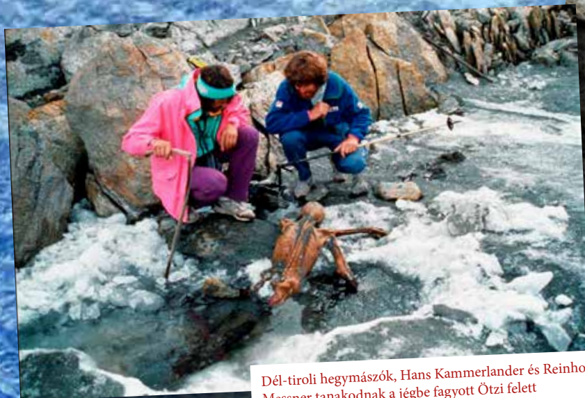
Dél-tiroli hegymászók, Hans Kammerlander és Reinhold Messner tanakodnak a jégbe fagyott Ötzi felett