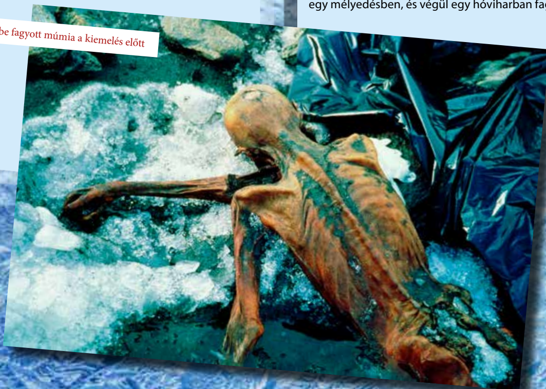
A jégbe fagyott múmia a kiemelés előtt

gyógyulásnak indult, innen lehet következni az időpontra. Valószínűleg a konfliktusból győztesen került ki, hiszen a kézfejen található sebesülés, illetve a később szerzett, talán a halálát okozó seb kivételével nem található a testen egyéb sérülés.