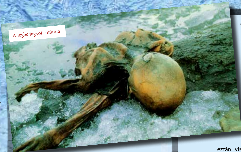
A jégbe fagyott múmia

A korszerű vizsgálatoknak köszönhetően mára egyébként nagyjából sikerült rekonstruálni Ötzi utolsó napjait is. A gyomrában talált polleneknek köszönhetően nemcsak az évszakot lehet meghatározni (késő tavasz – kora nyár), hanem mozgásának irányát is, ugyanis eltérő magasságban honos növények virágporait is azonosítani lehetett a mintákban. Az eredmények szerint Ötzi halála előtt kb. 33 órával, mintegy 2500 méteres magasságban evett egyet, majd lement a völgybe. Itt kb. 24 órával a halála előtt összetűzésbe keveredett valakikkel, amire legfeltűnőbbben a jobb kezén látható, csontig hatoló vágás utal. Több kisebb, tipikus védekezési sebnek aposztrofálható sérülés is megfigyelhető a kezein. A nagy, vágott seb