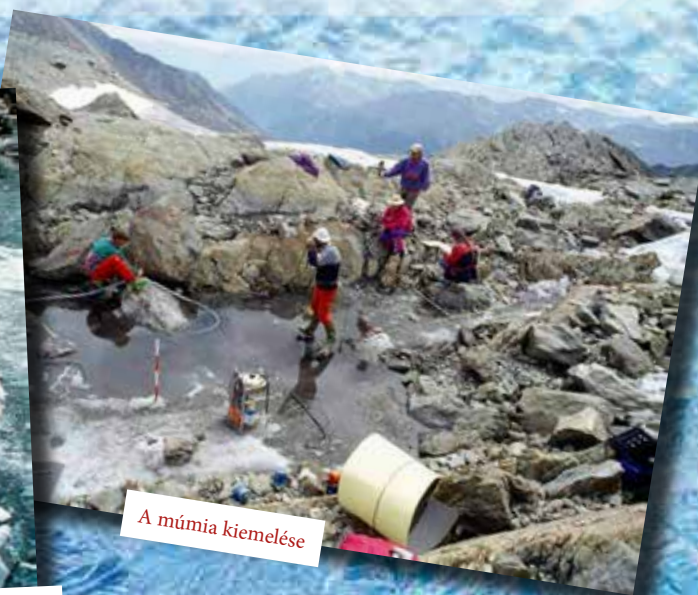
A múmia kiemelése