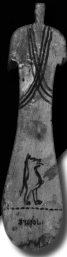
Középbirodalmi sematikus nőalak ( paddle doll ) hátoldala Toerisz rajzával (Brooklyn Museum)