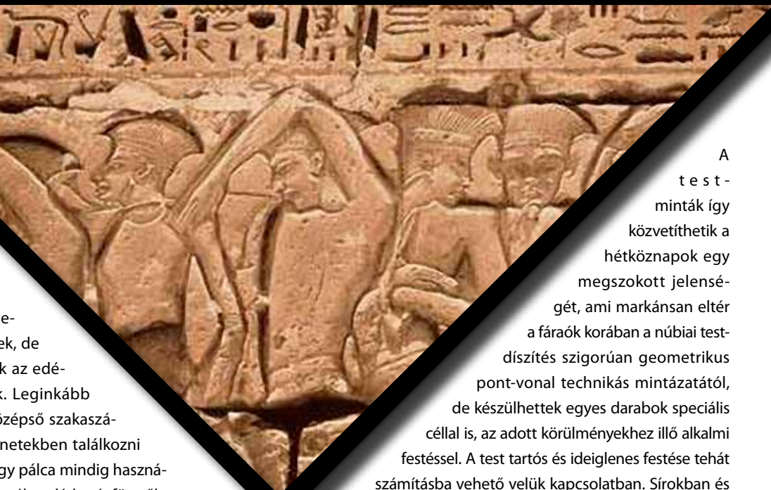
Hadifoglyok sora Medinet Habuban, a tengeri népek csatája után

szúrta sebiskönynyen megmagyarázható valamilyen csatával.