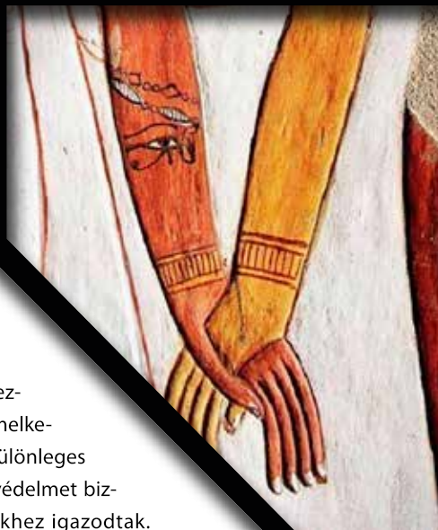
Utátszat szeméttábrázoló tetoválás egyiptomi falafestményen

A leletek ismeretében feltételezzük, hogy mivel a tetoválás ekkoriban jól látható helyen helyezkedett el, társadalmi helyzetet, kiemelkedő tetteket, rítusokon való részvételt, különleges mágikus/vallási ismereteket jelzett, vagy védelmet biztosított, és a testre tetovált elemek a nemekhez igazodtak. Alkalmazásukra feltehetően speciális körülmények között került sor, és erre szakosodott személyek végezték.