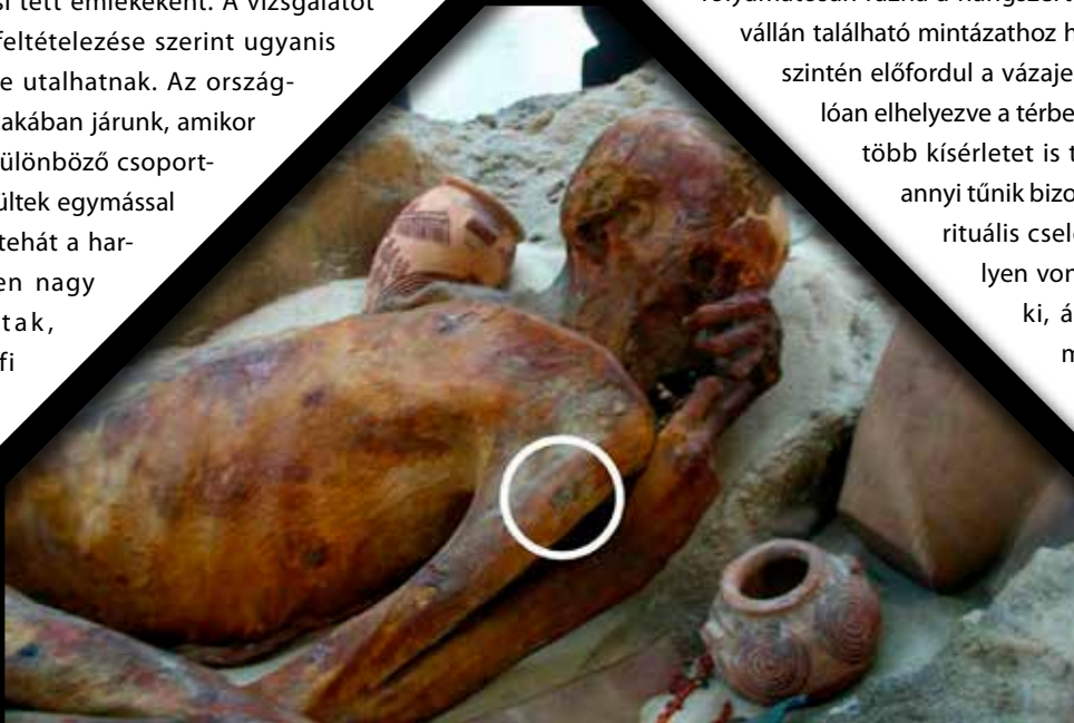
Gebelein A – karján a tetoválás fehér karikával jelezve

A két állat kicsit egymásba csúszik, és a vonalak telítettségének a különbsége alapján feltételezhető, hogy különböző időben kerültek az ifjú karjára – esetleg valamilyen hősi tett emlékeként. A vizsgálatot végző csapat feltételezése szerint ugyanis harci erényekre utalhatnak. Az ország-egyesítés korszakában járunk, amikor a Nílus-völgy különböző csoportjai gyakran kerültek egymással összetűzésbe, tehát a harci erények igen nagy becsben álltak, másrészt a férfi hátán megfigyelhető