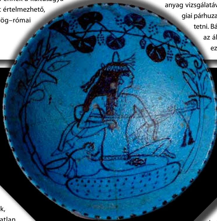
Újbírodalmi fajansztál, lantjátékos combján tetovált Bész-alakkal (Rijksmuseum van Oudheden)

Minthogy a tetoválás visszafordíthatatlan nyomot hagy a testen, alkalmazása egész életre szóló következményekkel jár. Helyétől függően bárki számára látható jelként szolgál, vagy egy bizonyos kör számára látható, vagyis egy kisebb közösség számára van jelentősége, vagy meghatározott cselekmény közben. Így értelmezése az adott kultúrán belül lehetséges. Az ókori Egyiptomban a díszítő és azonosító funkció mellett erősen védelmező szerepet is magában foglalt. Úgy tűnik kezdetben nők és férfiak egyaránt alkalmazták, a fáraók korában viszont kifejezetten a nőknek volt rá szükségük. Az okokra írásos források hiányában csak a fennmaradt tárgyi és képi anyag vizsgálatával, illetve néprajzi/antropológiai párhuzamok alapján tudunk következtetni. Bár nyilván voltak egyedi esetek, az általános használat feltárására ezek összessége nyújt alapot.