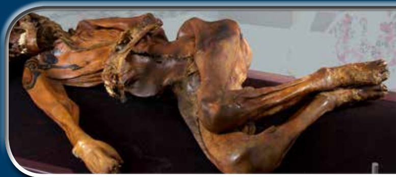
Az Ak-Alaha 3. temető 1. kurgánjában talált nő tetoválásai (fotó: Institute of Archaeology and Ethnography Russian Academy of Sciences, Siberian Branch, Novosibirsk)

A verh-kaldzsini 2. temető 3. számú sírjában talált múmia (fotó: Institute of Archaeology and Ethnography Russian Academy of Sciences, Siberian Branch, Novosibirsk)