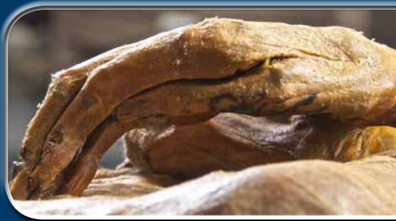
Az Ak-Alaha 3. temető 1. kurgánjában talált nő kezének tetoválása

A paziriki tetoválásokban megfigyelhető, hogy ismétlődnek az egyes ábrák szereplői. Ezeknek az elemeknek az állandósága a tetoválás hagyományának konzervatizmusára utal, ami azzal függ össze, hogy az emberi testre nem egyszerűen mintát vagy rajzolatot vittek fel, hanem jelrendszert, egyfajta „szöveget”. Egy írásbeliség nélküli kultúrában, amely nem a szövegek megsokszorozására irányul, hanem az ismételt újjáalkotásukra, az írásbeliség szerepét mnemonikus (emlékeztető) szimbólumok töltik be. Ez utóbbiak közé sorolhatjuk a paziriki tetoválás példait: a fantasztikus és reális állatok, halak, madarak a paziriki kultúra művészeti nyelvének, írásának és ezen túl az ősök nyelvének elemei. Az ábrázolt szakrális információ valószínűleg fontos mitológiai ismeretek átadását célozta.