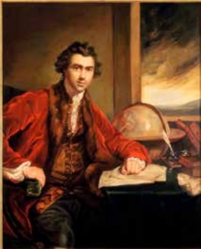
Sir Joseph Banks