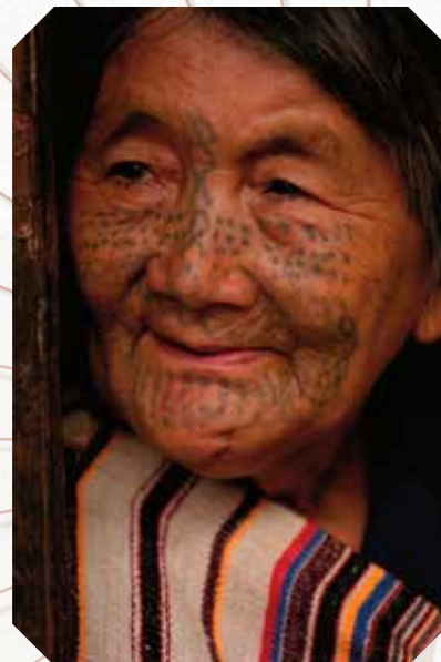
Tetovált arcú derong nő

„Ha Karadzsan elhagyjátok, és öt napig utaztok nyugat felé, egy Zardandan nevű tartományba értek. A nép bálványimádó és a Nagy Kán alattvalója. A főváros neve Vocsan. Az ország népe csupa aranyfogat hord, vagy jobban mondva, egyfajta aranyburkolattal