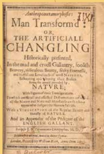
John Bulwer 1653-as kötetének címlapja