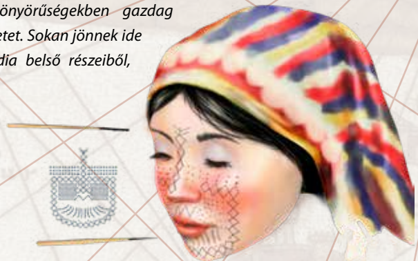
Egy derong tetoválás eszközei és mintája

Érzékletes leírásából kiderül, hogy nem pusztán nonfiguratív tetoválásokkal lehet számolni ekkortájt, de állat- (oroszlánok, sasok, darvak) és egyéb figurális ábrázolások (sárkányok) használatával is. A fenti motívumok egytől egyig a kínai kultúra szerves részét képező alakokból kerültek ki. Marco Polo precízen leírja a tetoválás készítményének technikáját is, mely az „utólagos” festékanyag-bevitelnek köszönhetően valamelyest eltér a leginkább ismert technikától. Roppant izgalmasak egyúttal a tetoválás társadalmi elfogadottságára, sőt előkelőségére vonatkozó megjegyzések is. Ennek fényében már nem is annyira meglepő, hogy a harmadik részletben Marco Polo már valóságos tetoválóturizmusról emlékezik meg: „Itt van egyúttal Zajton kikötője, melyet az indiai hajók keresnek fel fűszerekkel és mindenféle értékes áruval. [...] A nép bálványimádó, rendkívül békeszerető, és szereti a könnyű, gyönyörűségekben gazdag életet. Sokan jönnek ide India belső részeiből,