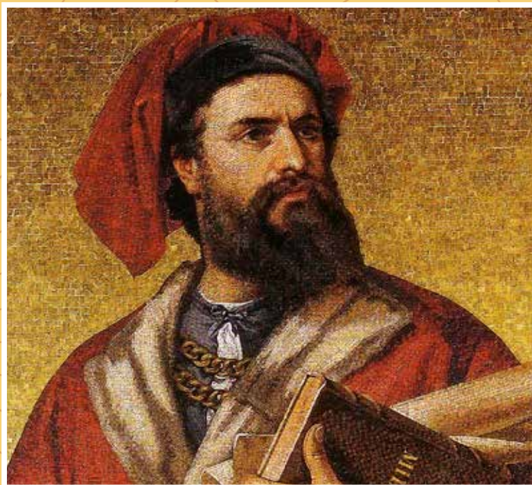
Marco Polo idealizált ábrázolása