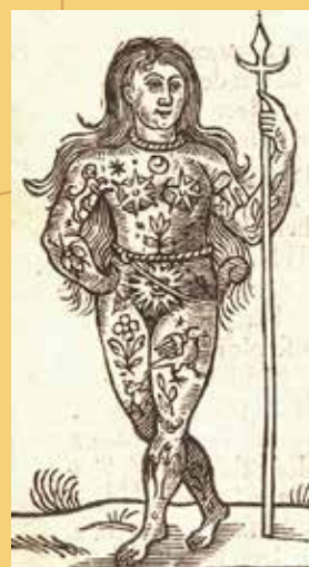
Tetovált piktet ábrázoló metszet Bulwer kötetéből

hogy a korábban említett módon túvel telerajzoltassák testüket, mert a város lakói ebben a mesterségben igen jártasak.” (Vajda Endre fordítása)