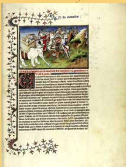
Egy oldal a Csodák könyvéből

számára hihetetlen dolog említése mellett – több ízben is megemlékezik a tetoválás szokásáról, így, ha másból nem is, ebből a könyvből már a művelt európaiaknak is ismerniük kellett az eljárást jóval Cook polinéziai hajóújtját megelőzően.