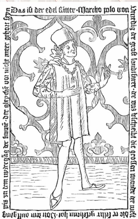
Marco Polo az egyik első nyomtatott kiadványban

A mikor Cook kapitány tudós utastársa, Sir Joseph Banks egy polinéz tetovált férfival 1771 júliusában Angliába érkezett, az európai közvélemény szinte egyszerre döbbsz le és csodálkozott el a tetoválás szokásán, pedig írott és szerencsére manapság már régészeti források sora is bizonyítja, hogy a tetoválás korántsem volt ismeretlen szokás Európában a 18. századot megelőzően. (Ötzi tetoválásainak köszönhetően tudjuk, hogy már egészen a rézkortól kezdve!)