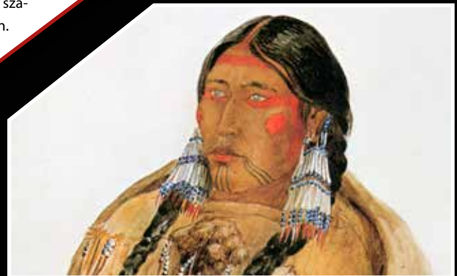
Krí ( nehíyaw ) indián asszony állán tetovált vonalakkal, 1833. Karl Bodmer festménye