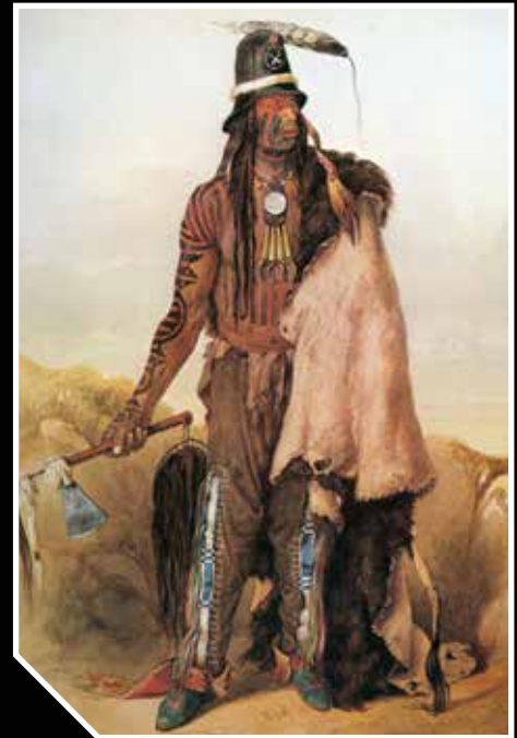
Addih-Hiddish hidatsza ( hiraacá ) főnök, akinek a tetoválása szabadon maradt közeit vörös testfestéssel töltötték ki. 1833. Karl Bodmer festménye

A tetoválás maga egy bonyolult szertartás volt, amelynek során a tetováló papoknak imákat kellett mondaniuk, és szent dalokat kellett énekelniük.