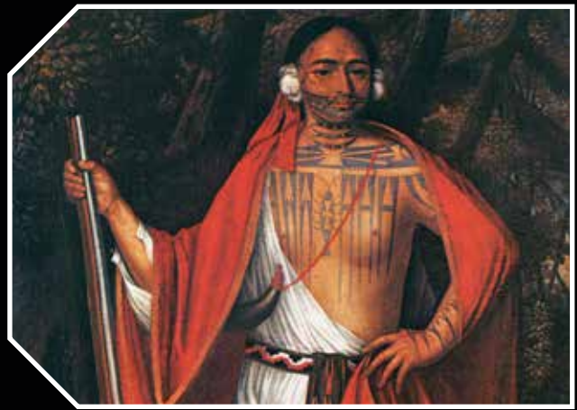
Sa-Ga-Yeath-Qua-Pieth-Tow mohawk (kanien'kehá:ka) főnök, akit Peter Brant néven kereszteltek meg angliai látogatása során. 1710. John Verelst festménye Anna királynő számára. A főnök felsőtestét díszítő tetoválás nemzetsége állatósét, a medvét szimbolizálja.

Erről Sánta Őz, a sziú indián sámán így beszélt: „Bennünket, indiánokat születésünktől halálunkig úgy burkolnak be a szimbólumok, akár egy puha takaró. [...] van a legtöbbünk csuklóján tetoválás [...] egy név, néhány betű vagy egyszerű ábra. A szellemek hajlékához vezető utat őrző Bagoly Asszony csak ránéz a tetoválásra, és már mehetünk is tovább. Olyan ez, mint holmi útle-