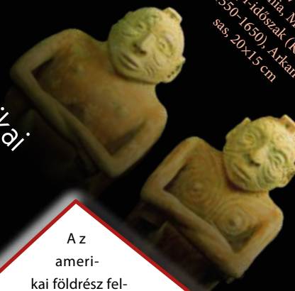
Ember alakú víztároló edények. Festett kerámia, Mississippi-időszak (Kr. u. 1550–1650). Arkansas, 20x15 cm

Az észak-amerikai bennszülött népek tetoválási szokásairól