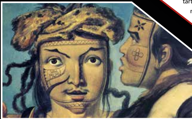
Mikhail Tikhanov festményének részlete a Baranov- (Sitka) szigeti tlingit indiánok arctetoválásairól. 1817.

A tetoválás szertartásának legkidolgozottabb formáit a szíu nyelvcsalád dhegiha ágának népeinél – az omaha ( umonhon ),