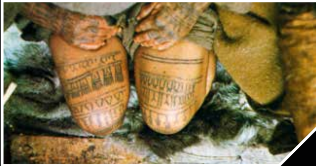
Korom és bálnaszír keverékével készített eszkimó (inuit) tetoválás egy asszony kezén és combjain (a National Geographic nyomán)

eszkimó nőket az állukon, az orrukon, az orcáikon, valamint a karjukon és a térdek fölött, a combokon tetoválták, s csak az ilyen testdíszítéssel rendelkező nőket tartották szépnek. A tetoválást még pubertáskorban végezték: korommal kevert bálnaszírba mártották a színeget, amelyet az egyszerű mintáknak megfelelően egy varrótűbe fűzve áthúztak a bőr felszíne alatt. Amennyiben a tetovált leány sztoikus nyugalommal viselte a fájdalmas eljárást, akkor az annak a jele volt, hogy kész arra is, hogy gyermeket szüljön. Az állra tetovált minták a termékenységet voltak hivatottak biztosítani, míg az orcák bonyolultabb mintái csupán jelentés nélküli díszítések voltak. A tetoválásnak vallási tartalma is volt, mert az inuitok úgy tartották, hogy egy szép tetoválás nélküli asszony nem tud eljutni halála után az „áldottak földjére”, csupán Nóquinta , a „Szik-