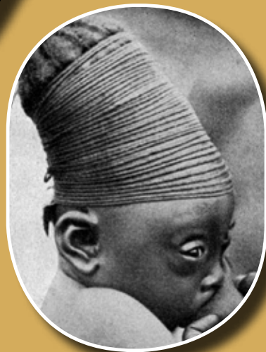
Gyermek bandázsos koponyatorzítással (Afrika)

Nemi különbségek nemigen voltak, mind kislányok, mind pedig kisfiúk koponyáját egyaránt torzították. A koponyatorzítás azonban számos egészségügyi következménnyel járhatott: légúti fertőzések, megváltozott hang, gyakori fejfájás, hirtelen halál, esetleg rövidebb élettartam. A torzított koponyájú személyek szellemi képességei azonban valószínűleg nem változtak számottevően.