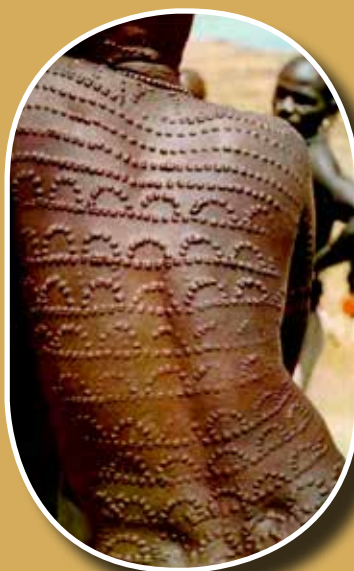
Hegtetoválás a háton (Afrika)