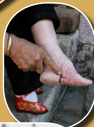
A lábelkötés végeredménye (Kína)

A legkívánatosabb az úgynevezett aranylótusz (3 kínai inch – kb. 10 cm), majd az ezüstitótusz (4 kínai inch – kb. 13,3 cm), végül a vaslótusz (5 kínai inch – 16,6 cm). Az ennél is nagyobb és főleg az elkötetlen lábat lenézték, jó házasságra esélye sem volt az ilyen lányoknak.