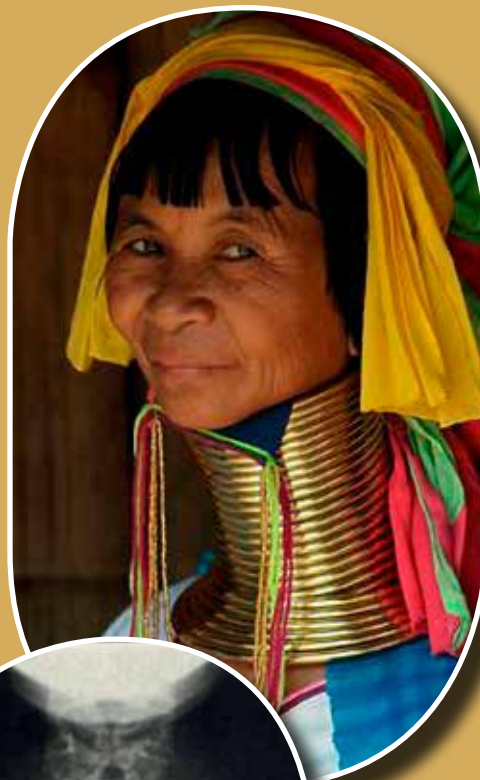
Nyakkarikákat viselő asszony (Burma)

A nyakkarikákat viselő nők a karjukon és a lábukon is hordanak hasonló formájú, méretű és súlyú ékszereket, amelyek összesen akár 15–25 kg-ot is nyomhatnak.