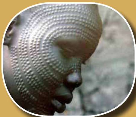
Hegtetoválás arcon (Afrika)

A hegtetoválás elsősorban Afrikában tekint vissza hosszú múltra. Sokkal népszerűbb volt, mint a hagyományos tetoválás, mert a tinta nehezen látszik a sötétebb bőrön. A hegtetoválás többféle eljárással készülhet: vágással, égetéssel vagy nyúzással. Az eszköz lehet kés, üveg, kő vagy kókuszdióhéj. A vágott sebeknél gyakran „zsebeket” képeznek a bőrben, amikbe agyagdarabokat vagy hamut helyeznek, hogy a heg minél jobban kiemelkedjen. A nők általában a melleken és a hasukon, míg a férfiak az arcukon, a vállukon és a karjukon viselték/viselik a hegtetoválást. Elkészítésük nagyon fájdalmas, de nagy szégyennek számít, ha valaki ezt kimutatja. Többnyire fontos életese-ményeknél, például a pubertás elérésénél vagy házasságkötésnél kerül sor az eljárásra.