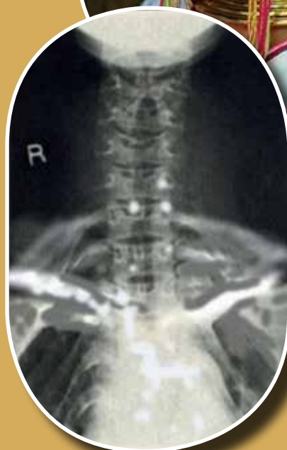
Nyakkarikákat viselő asszony nyaki röntgenképe (Burma)