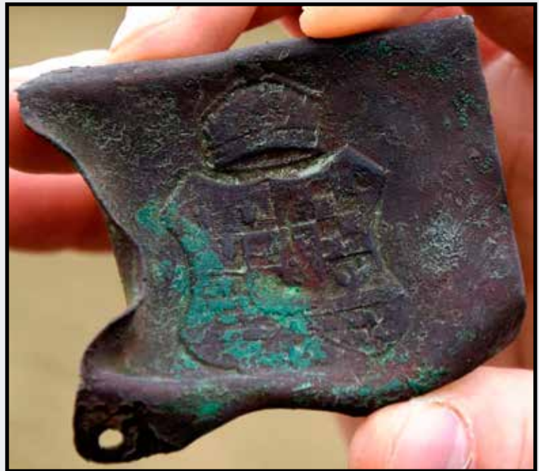
1891 M honvédövcsat