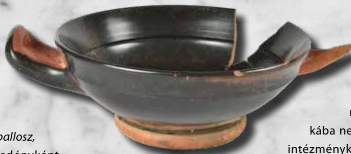
Több töredékből összeállítható betétes peremű tál