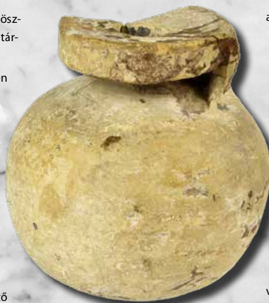
Lekopott festésű korinthuszi gömb arüballosz