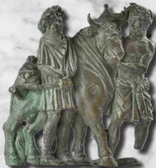
Áldozati jelenetet ábrázoló bronzöntvény