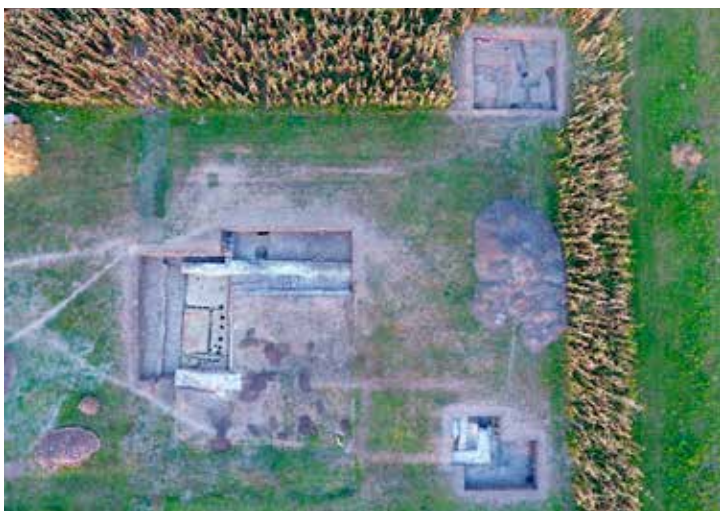
A 2016-os feltárások