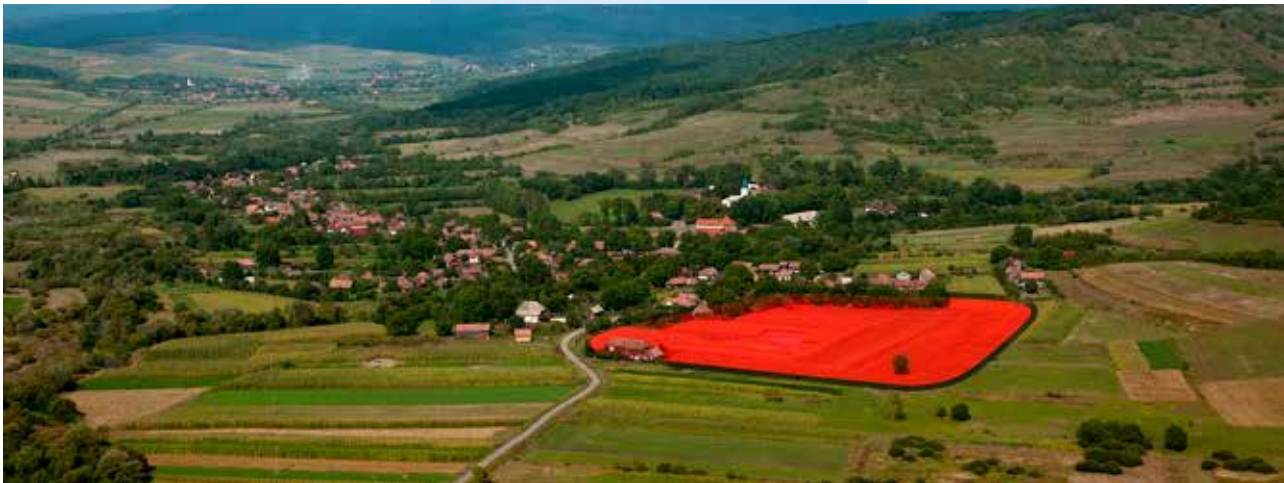
A segédcsapattábor fekvése (készítette: Szabó M.)