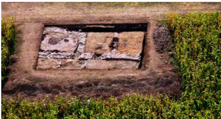
A 2013-as feltárások