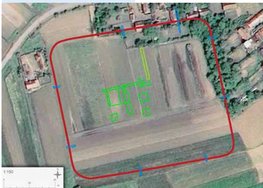
A régészeti feltárások helyszínrajza (készítette: Laczkó N.)

2015-ben a helyi és a megyei hatóságokkal együttműködve tettük meg az első lépéseket azzal kapcsolatban, hogy a mezőgazdasági hasznosítást beszüntessék egy néhány hektár nagyságú területen, annak érdekében, hogy megkezdhesük