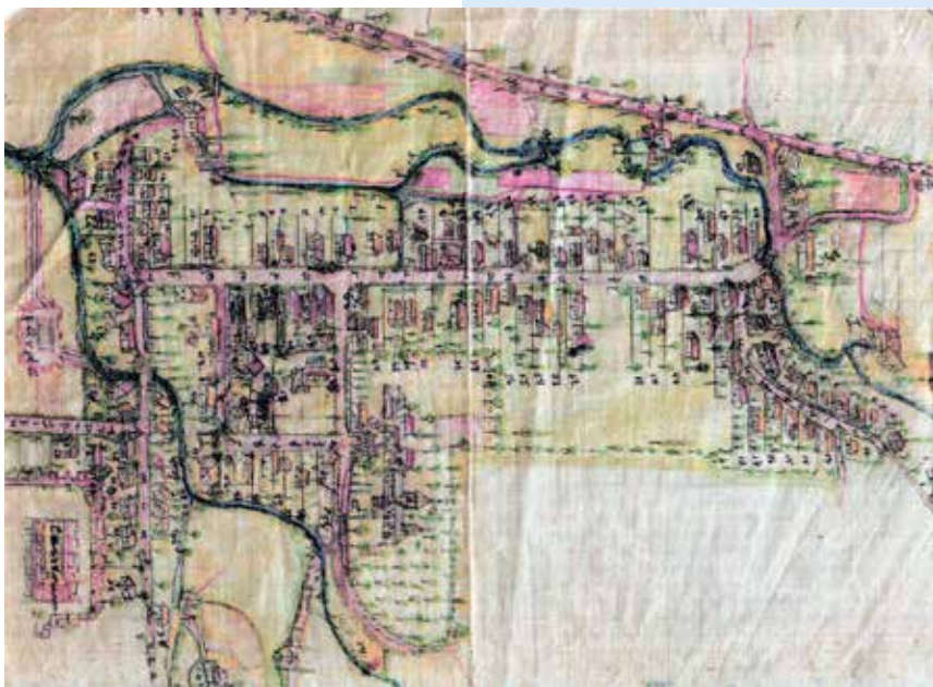
Mikháza alaprajza a 20. század elején (készítette: Lokody A.)

szén kezdett régészeti kutatásokat (sárgával jelölve). Az ekkor húzott kutatóárok átvágta az egyik utat, valamint az út vízvezető árkat és egy hosszú, hathelyiséges épületet is, amely valószínűleg egy legény-ségi barakk lehetett.