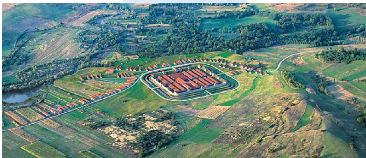
A római tábor és település rekonstrukciója (készítette: Vasáros Zs.)

Paulovics István régész 1942-ben végzett átfogó terepbejárást Dacia tartomány keleti határvonala mentén, mely során ellátogatott Mikházára is. Terepi megfigyelései alapján leírta a tábor pontos fekvését, valamint közölt egy vázlatos helyszínrajzot is.