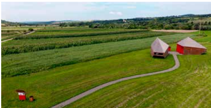
Az „Idődoboz” pavilonok

a mikházi régészeti park kialakítását. A parkot a Maros Megyei Múzeum kezeli, és célja, hogy megvédje a feltáratlan régészeti objektumokat, s egyúttal lehetőséget kínáljon arra, hogy a BME Ipari és Mezőgazdasági Épülettervezési Tanszékének oktatóival és hallgatóival közösen ötletbörzézünk a feltárt maradványok konzerválásának és bemutatásának mikéntjéről. A park megnyitása óta információs táblák tájékoztatják a látogatókat a lelőhely főbb látnivalóiról. 2016 óta pedig két „Idődobozra” keresztelt faépület ad helyet a lelőhelyről szóló állandó kiállításnak. A pavilonok a régészeti park első épületei voltak, és megépítésükkel az volt a célunk, hogy szokatlan kiállítóterek segítségével a látogatók elvonatkoztassanak a jelentőtől, és egy időutazáson vehessenek részt. A pavilonok a régészeti park emblemikus épületeivé és a táj meghatározó pontjaivá váltak. A kiállítások a római katonai tábornok és az itt állomásozó katonai egységet, illetve a katonai fürdő és a római testápolás kérdéskörét ismertetik. A látogatók betekintést nyerhetnek a Mikházán folyó eddigi kutatások eredményeibe és a római határ ( limes ) mentén élő katonák és civilek hétköznapijába.