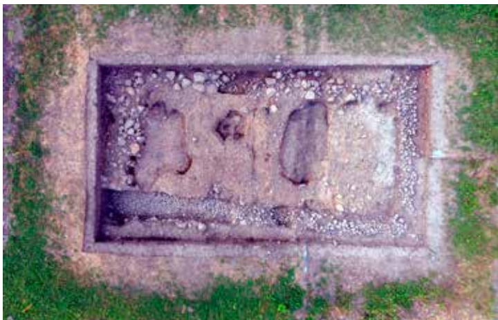
A 2018-as feltárások