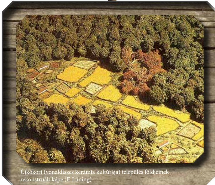
Újkőkori (vonaldíszes kerámia kultúrája) település földjeinek rekonstruált képe (F. Lüning)

Az európai és új-guineai kőeszközök társadalmi, gazdasági, vallási szerepének bemutatása, illetve a kőpengék „továbbélése”, másodlagos, az eredeti funkciótól eltérő használata szintén megjelenik a kiállításon. Külön