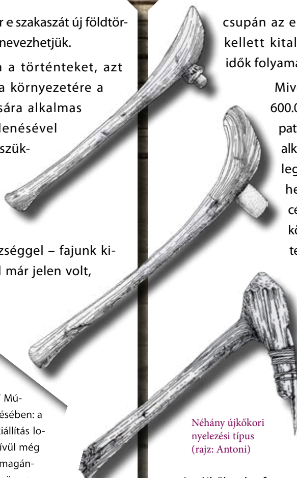
Néhány újkőkori nyelzési típus