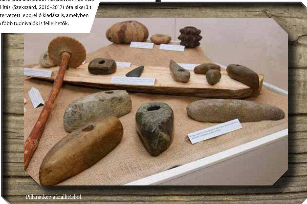
Pillanatkép a kiállításból

Az újkőkor legfontosabb nyersanyaga a fa volt, s a fa feldolgozásához használt legfontosabb eszköz pe-