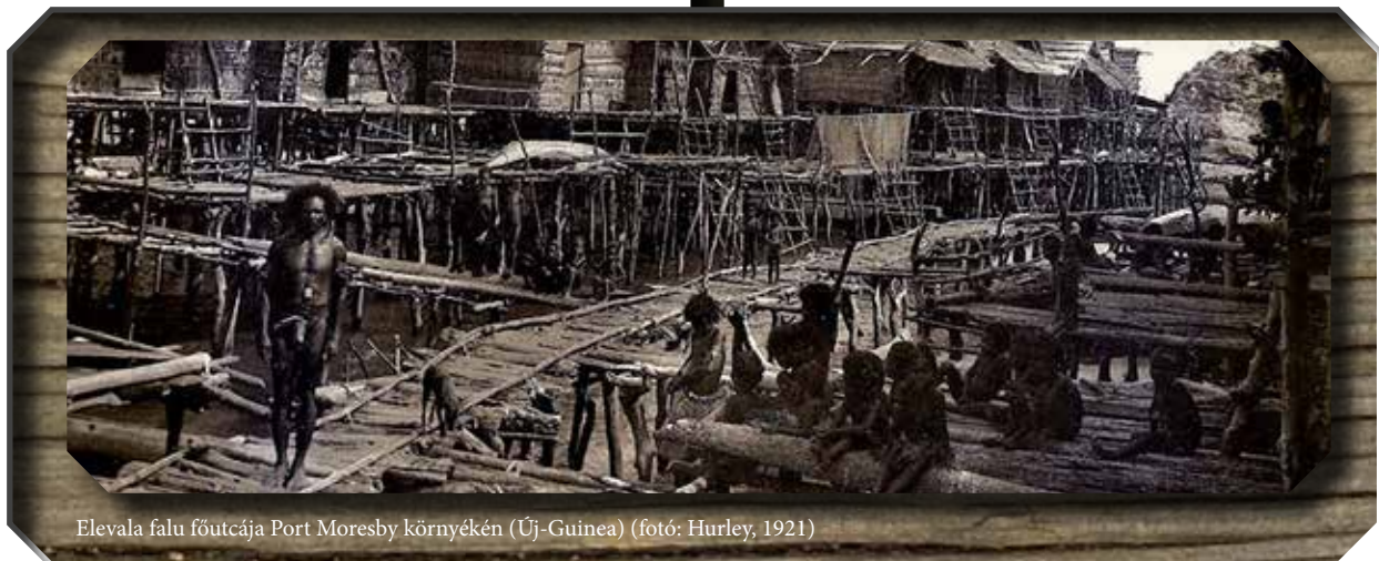
Elevala falu főutcája Port Moresby környékén (Új-Guinea) (fotó: Hurley, 1921)