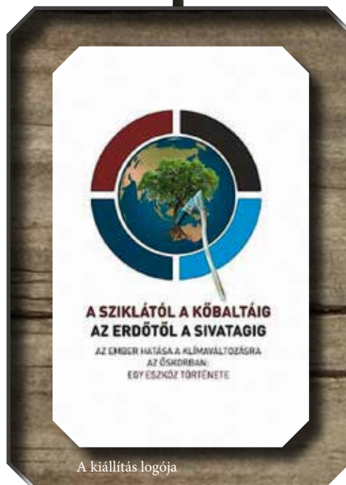
A kiállítás logója

A tehetetlenség és az elkeseredés szülte az ötletet, mely A sziklától a kőbaltáig – az erdőtől a sivatagig – Az ember hatása a klímaváltozásra az őskorban: egy eszköz története című vándorkiállítás összeállításához és megrendezéséhez vezetett.