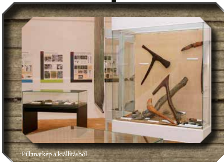
Pillanatkép a kiállításból

globális klímaváltozás/felmelegedés (és ennek valamennyi kísérőjelensége), az első olyan esemény a Föld életében, amelyet már az ember tevékenysége is befolyásol. Az utolsó 150–200 évben az emberiség olyan mértékben alakította át a termé-