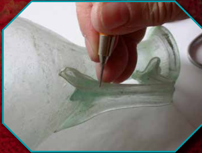
A kiskundorozsmai 5. sír üveggancsójának archaeometriai vizsgálata

nyek: így kancsók, poharak, ivókürtök, melyek zömmel a korai avar korszak előkelő/arisztokrata sírjaiból jól ismertek, de majdnem kizárólagosságot élveznek a késő avar kori nagyszentmiklósi fejedelmi tárgyegyüttesben is. Nyilvánvalóan nem lehet kizárni azt sem, hogy e fém- és üveggancsókba, az üveg- és a fémveretes szarukür-