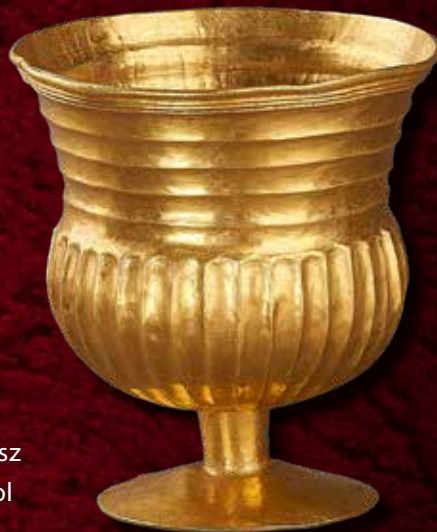
Arany pohár Bócsáról

A Mongolok Titkos Története című műben több részlet is szól a mértéktelen ivásatról: „Amikor a táltosok megkezdték varázslataikat, Toluj herceg kiitta a varázslóvizet. Egy darabig csak ült, majd megszólalt: Részeg lettem... Míg részegségemből magamhoz nem térek, fejedelmi bátyám viselje gondját öccseinek. [...] Mindent elmondtam. Megrészegedtem – mondotta. Kiment, és meghalt. Hát így történt. ” A mű végén Dzsingisz legidősebb fia és utóda, Ögödej így nyilatkozik: „ Viszont, amikor fejedelmi atyám trónjára ültettek engem, s rám rakták rengeteg birodalmát, hibát követtem el, mert hagytam, hogy legyőzzön engem a borital. ”