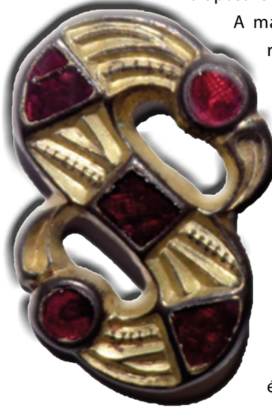
Langobard S-fibula rekeszes és ékvéséses testtel (Wosinsky Mór Megyei Múzeum, Szekszárd)

A madárfibulák korai, rekeszes stílusban készült formái is feltűnnek, de a későbbiekben jellemző, hogy e tárgyak testét ékvéséssel, úgynevezett Kerbschnitt technikával díszítették, kialakítva a szárnyakat, a fejet, a csőrt és a farktollakat. Az S-fibuláknál ugyancsak előszeretettel alkalmazták a Kerbschnitt technikát. Egyes darabokon a teljes testet hosszanti irányú bor-