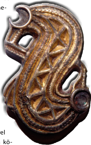
Langobard S-fibula ékvéséses testtel (Wosinsky Mór Megyei Múzeum, Szekszárd; a szerző fotója)

A langobard szállásterületen feltárt temetők női sírjaiból számos olyan leletet ismerünk, amelyen madárábrázolást figyelhetünk meg. Az egyik leggyakoribb leletípus a kis méretű fibula (hosszuk kb. 2–3,5 cm, szélességük kb. 1,5–2 cm). Ezekkel a kis méretű ruhakapcsoló tűkkel egyesével vagy párosával a közepén nyitott, hosszú felsőruhájukat, vagy a vállukra terített köpenyüket tűzték össze a kor hölgyei.