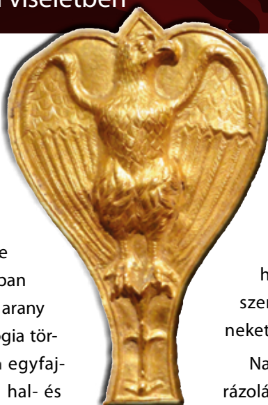
Római legiosas (aquila) (Cleveland Museum of Art)

Véleményem szerint azonban nem szükséges egy általánosan alkalmazott szimbólumot feltétlenül vallási, főként keresztény tartalommal felruházni, mindezt egy olyan nép esetében, amely még a 8. században is – hiába tért már meg jó ideje akeresztény hitre – gyakorolta a korábbi „pogány” vallása rítusait is. Még a 8. században, Itáliában uralkodó Liutprand langobard király (712–744) is fogalmazott olyan rendeleteket, amelyek próbálták korlátozni a korábbi