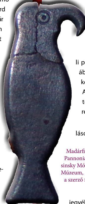
Madárfibula Pannoniából (Wosinsky Mór Megyei Múzeum, Szekszárd)

A cloisonné az 5. században elterjedt ötvöstechnikai fogás. A nemesfém tárgyak felületére vékony lemezekből álló, különböző alakú és nagyságú rekeszeket forrasztanak, ezekkel a tárgy teljes felületét beborítják. A rekeszek alját kötőanyaggal töltik ki, majd a rekeszekbe azok formájának megfelelően csiszolt gránát- vagy üveglapokat helyeznek.